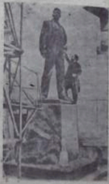
В 1957 году на площади имени Малковского в Москве будет установлен памятник В. В. Маяковскому. Проект памятника работы скульптора А. П. Кибальникова получил на конкурсе высшую оценку. В настоящее время А. П. Кибальников заканчивает изготовление рабочей модели памятника.