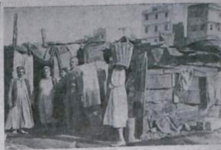
ПОРТ-САНД. В результате англо-французской агрессии тысячи жителей Порт-Санда лишились крова. НА СНИМКЕ: в квартале Аль-Манак. Население ютится в пещерах сколоченных хижинах.