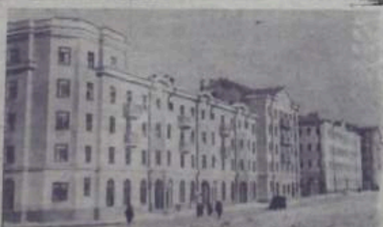
Караганда. Растет и хорошеет город угольщиков. За минувший год здесь построено 89 тысяч квадратных метров жилой площади или в два раза больше, чем в 1955 году.

деятельности и физкультурные соревнования. Сейчас к фестивалю развернулась деятельная подготовка.