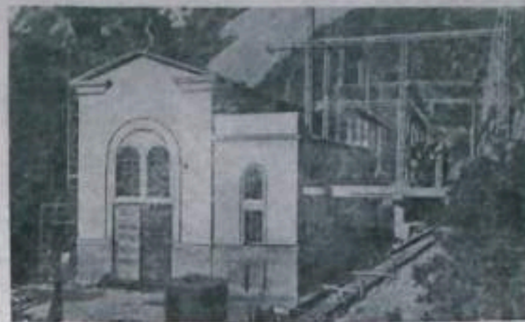
Грузинская ССР. Одной из крупных энергетических строек шестой пятилетки в Грузии является Тхибульска ГЭС. Первый из четырех агрегатов этой станции уже включен в систему "Грузэнерго". Управление агрегатом автоматизировано. Завершена монтаж остальных трех агрегатов.

НА СНИМКЕ: Здание Тхибульска ГЭС. Сарая — открытая подстанция.