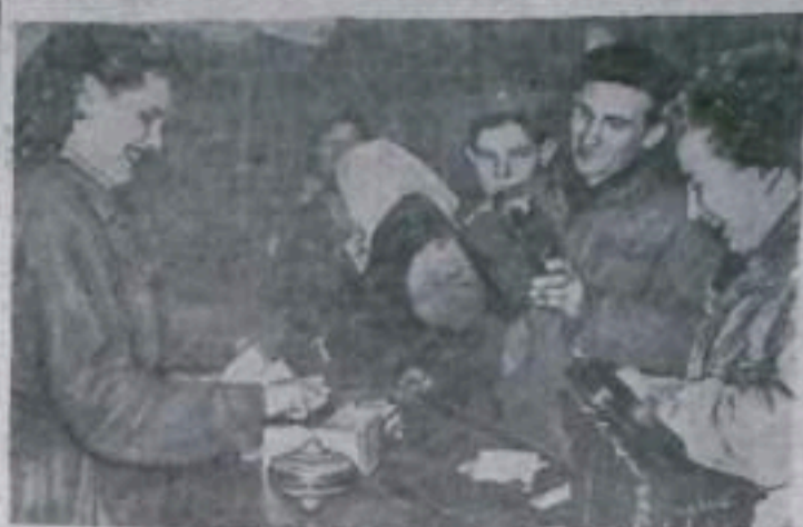
ВЕНГЕРСКАЯ НАРОДНАЯ РЕСПУБЛИКА. Нормальной жизнью снова живет город металлургов — Дулапентеле. Работают заводы, возобновились занятия в школах, открыты магазины. НА СНИМКЕ: в промтоварном магазине. Покупатели приобретают игрушки.