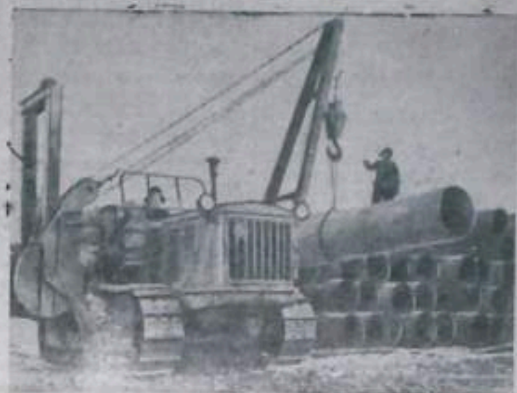
На днях досрочно закончено сооружение первой очереди газопровода Ставрополь—Москва. Ставропольский газ пришел в столицу.

Сейчас в Подмосковье кипит работа. Строители-газовики трудятся над прокладкой стометрового газопроводного кольца, которое опояшет Москву и будет служить целым лучшим газоснабжения промышленных предприятий и населенных пунктов Московской области.