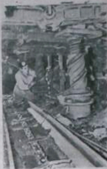
Кемеровская область. На шахтах Кузнецкого угольного бассейна внедряются новые виды машин и механизмов, облегчающих труд шахтеров и способствующих увеличению добычи угля. Здесь находят применение металлическая крепь. На ряде шахт успешно освоены механизированная передвижная крепь «МПК», органная крепь «ОКУ».

Коллективы этих предприятий обратились ко всем работникам промышленности, транспорта и строений республики с призывом шире развернуть социалистичес-