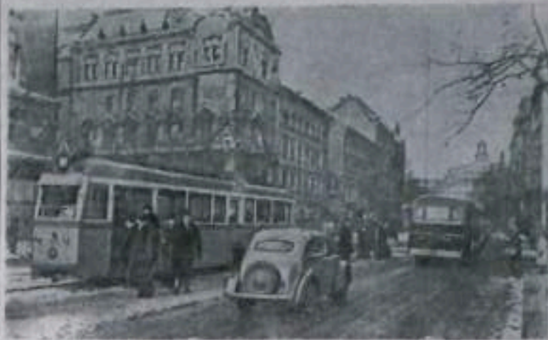
На улице Кошута