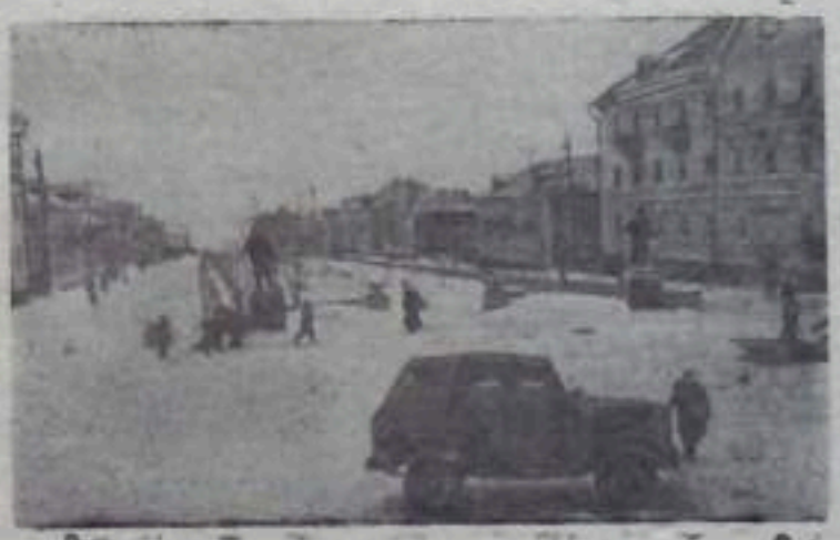
НА СНИМКЕ: Улица Ленина.