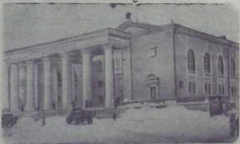
На снимке: Дворец угольщиков