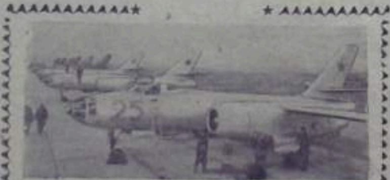
В Н-ской части легких бомбардировщиков. На аэродроме.