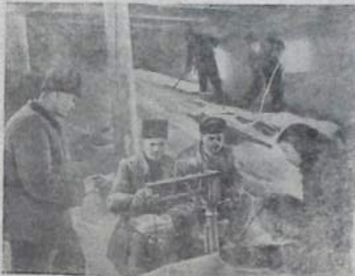
Вильгельм ССР. Дня-велье готовится к весне возколонии сельхозартель «Новая жизнь» Бельского района. В колхозных зернохранилищах ведется очистка семян. На поля вывозится удобрение. Расширяется парниковое хозяйство. На снимке: члены инвентаризационной комиссии колхоза «Новая жизнь» за взвешиванием семенной пшеницы.