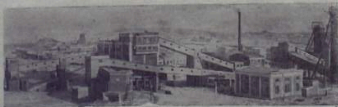
Казахская ССР. В Караганде вступила в строй действующих предприятий еще одна крупная шахта №121. Она будет выдавать ежегодно один миллион двести тысяч тонн угля. НА СНИМКЕ: общий вид шахты №121.

Обсуждено и принято на собраниях рабочих и инженерно-технических работников шахт, строек и предприятий комбината „Донбассантрацит“.