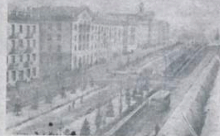
Черингов. Монется облик древнего города на Десне, по плану отстраивается свое 1906-летие. На месте ветхих домишек вырастают многоквартные здания. Строится промышленные объекты, административные помещения, жилые дома. На снимке: новые дома на центральной магистрале города — улице Шевченко.