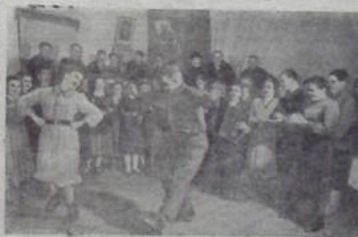
Оренбургская область. В колхозном совхозе «Анжиковский» для ранневой солдатки хорошие культурно-бытовые условия. Выстроено более 40 индивидуальных домов, столовая, магазин. В совхозной школе-семилетке обучается 170 детей. Любое место отдыха совхозной молодежи. Дом культуры. В нем проводятся вечера, читается лекции, демонстрируются кинокартины. Коллектив художественной самодеятельности Дома насчитывает 31 человека. На снимке: вечерок в совхозном Доме культуры.