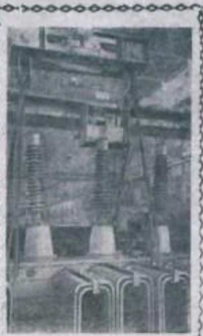
Запорожский трансформаторный завод закончил сборку первого силового трансформатора типа ТДНГ 40500-132 для Идли. Мощность трансформатора 40500 киловольтагер.