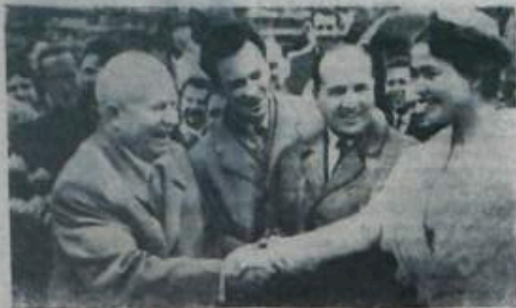
На снимке жители города Арад приветствуют главу Советского правительства.

Фото специального фотокорреспондента ТАСС В. Соблава. (Снимок принят по фототелеграфу)