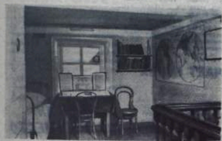
Ульяновск. Дом-музей В. И. Ленина. На снимке: комната Владимира Ильича.

времени отдувался, разрезая носом очередную волну. Он шел по Куйбышевскому морю — самому большому в мире водохранилищу, созданному человеком.