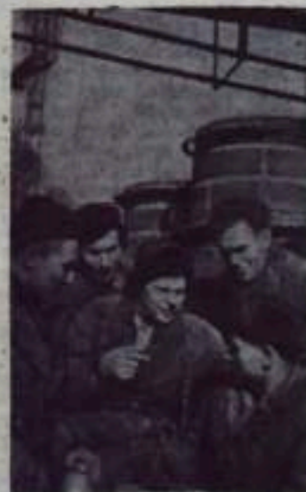
ЛУГАНСКАЯ ОБЛАСТЬ. На Алчевском металлургическом заводе имени Ворошилова сооружается крупная доменная печь. Это — ударная комсомольская стройка.

Исследовательские работы закончены. Научные работники и практики доказали, что сернистый кокс с успехом может быть использован для выплавки стали, производства алюминия и для других отраслей промышленности. Возможности снабжения промышленности таким коксом неисчерпаемы. Только нефтеперерабатывающие заводы Башкирии могут дать народному хозяйству страны ежегодно сотни тысяч тонн этого кокса. Стоимость нефтяного кокса по сравнению с другими коксами в три-четыре раза дешевле. Применение дешевого кокса даст государству ежегодно сотни миллионов рублей экономии. На нефтеперерабатывающих заводах Башкирии сооружаются новые мощные установки, позволяющие более полно удовлетворять потребности народного хозяйства в коксе.