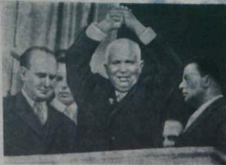
Председатель Совета Министров СССР Н. С. Хрущев в Париже. На снимке: Н. С. Хрущев отвечает на приветствия с балкона здания на Кв д'Орсэ, являющегося его резиденцией в столице Франции.