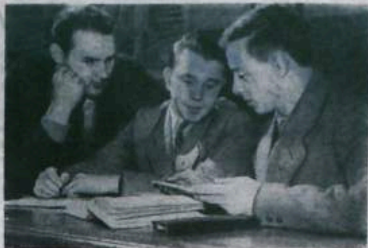
ЛЕНИНГРАД. Крепкая дружба связалась между студентами кораблестроительного института и молодыми рабочими Адмиралтейского судостроительного завода. Они помогают друг другу учиться и работать. Студенты старших курсов института дали шефство над занимающимися в институте и техникуме производственниками. Они консультируют рабочих по физике, математике. Студенты часто приглашают на завод и работают в бригадах.

— Зачем? Все равно я первого увольняюсь.