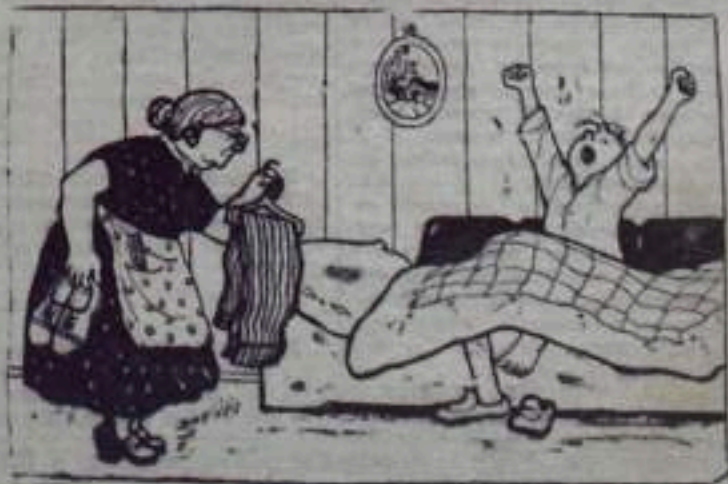
На добром мамеобслуживании.