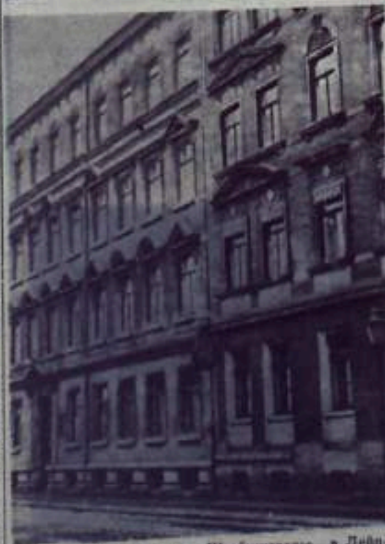
Дом № 28 по улице Штейнштрассе в Дрездене, в котором В. И. Ленин останавливался в 1912 — 1914 годах.