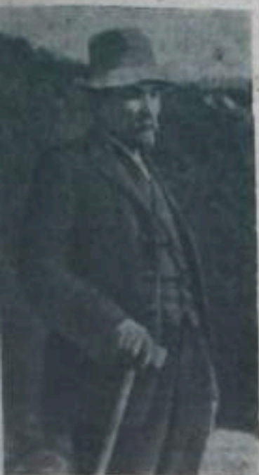
В. И. Ленин на прогулке в горах в окрестностях жемчужки Лапонии в Польше. Заполане, лето 1914 года. (Фото из альбома, подготовленного к выпуску Институтом марксизма-ленинизма при ЦК КПСС).

жать ему руку. Есть много товарищей, которые учились и даже работали под его руководством. Мой опыт — капля в море, но даже в Советском Союзе есть миллионы, которые хотели видеть его, слышать его, говорить с ним, но им это не удалось. Каждый, кто