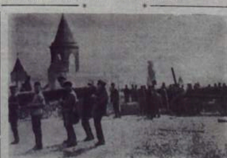
В. И. Ленин на Всероссийском субботнике работает на переноске дров во дворе Кремля 1 мая 1920 года.

Бывший солдат Даниил ГРЕХОВОДОВ. 14 апреля 1918 г.