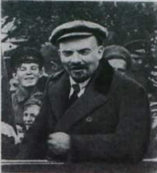
В. И. Ленин у рабочих Рублевской водокачки. 1 мая 1919 года (кинокадр). (Из альбома, подготовленного к выпуску Институтом марксизма-ленинизма при ЦК КПСС. Фотохроника ТАСС.

В Правых Ламках еще живы некоторые из авторов этого письма В. И. Ленину: многие помнят и то, что Ленин ответил