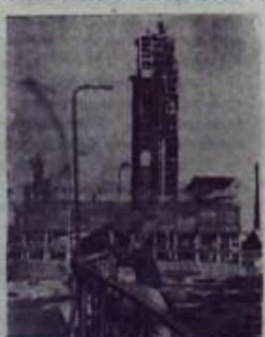
ЧЕЧКО-ВИГУШКАЯ АССР. В Грозном завершается строительство установки непрерывного контактного коксования (Г-18). На этой установке из тяжёлых крекинг-остатков битума и нефти будет производиться бензин, дизельное топливо и электрический кокс.