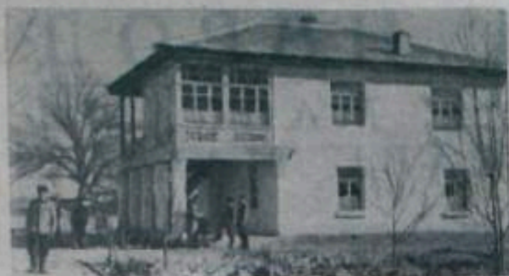
УЗБЕКСКАЯ ССР. За последние годы в колхозе имени Карла Маркса Шахрисабзского района Сурхан-Дарьинской области построено много жилых домов, две средние и начальная школы, медицинский пункт, столовая, магазин, гостиница и другие культурно-бытовые учреждения. На снимке: новая колхозная гостиница.