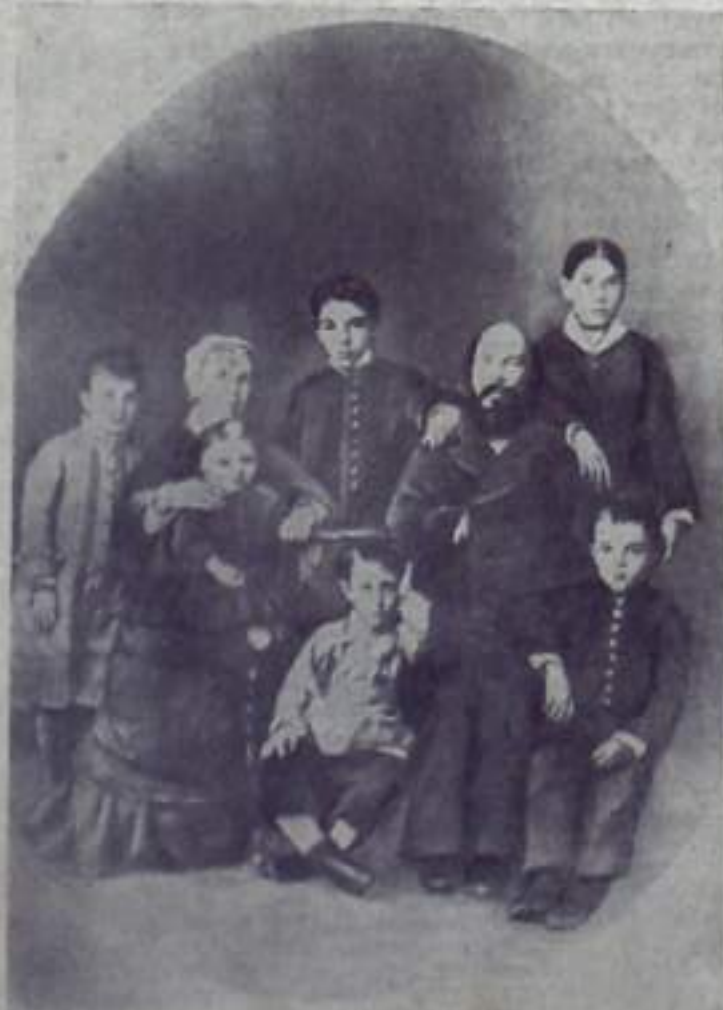
СЕМЬЯ УЛЬЯНОВЫХ В СИБИРСКИЕ.