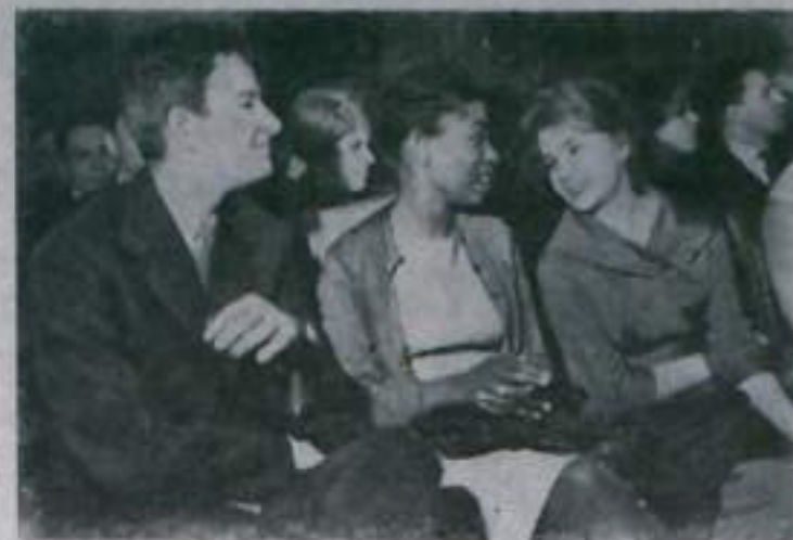
МОСКВА. В Доме дружбы с народами зарубежных стран состоялась встреча советской молодежи с молодыми туристами из Великобритании, Польши, Франции и Швейцарии.