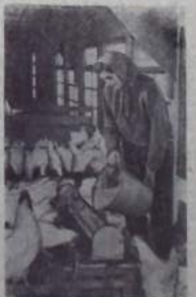
Чехословацкая Социалистическая Республика. На пятиферме государственного хозяйства Иглава.