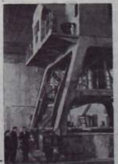
ОПЕР. На «Южуралмашмашин» изготавливается автоматизированный конструкторский прибор. По сравнению с прежними конструкторскими приборами автоматизированный имеет значительно меньший вес, но большую производительность, он более надежен в работе. На снимке: один из агрегатов автоматизированного конструкторского прибора.