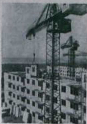
В Запорожье ведется большое жилищное строительство. К концу семилетки в городе намечено соорудить около полутора миллиона квадратных метров жилья.