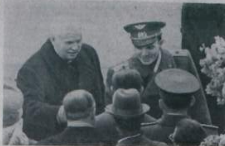
МОСКВА. 14 апреля 1961 года. Торжественная встреча на Внуковском аэродроме младшего сына советского народа героя-космонавта Юрия Алексеевича Гагарина.

И. ВАСИЛЬЦОВ, машинист экскаватора угольного разреза.