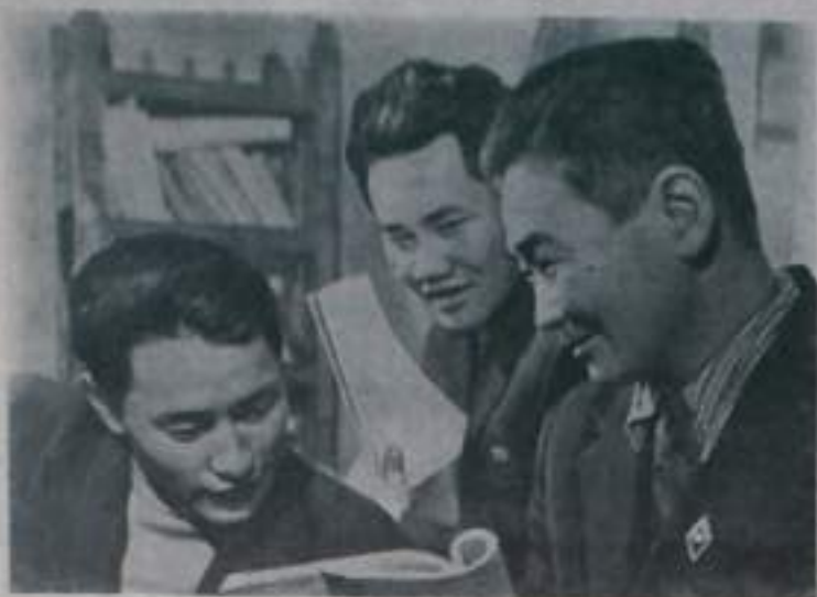
ЧИТИНСКАЯ ОБЛАСТЬ. В далеком забайкальском колхозе имени Кирова Молодотуйского района Ленинского Буряцкого национального округа несколько лет назад было три специалиста с высшим образованием. Сейчас их 18 человек. Сегодняшние зоотехники, агрономы, инженеры, ветеринарные врачи и учителя-колхозники. Они поехали в город, получили образование и вернулись в родной колхоз.

13 молодых специалистов учатся сейчас в учебных заведениях страны.