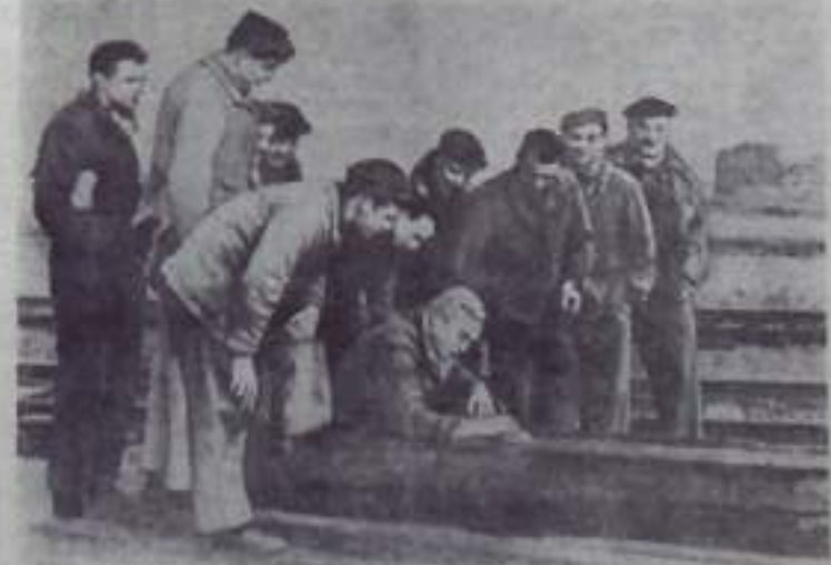
Трудящиеся Франции усиливают борьбу за немедленное прекращение войны в Алжире, продолжающейся более шести с половиной лет.

На снимке: железнодорожники Лиона проводят сбор подписей под резолюцией, требующей прекращения колониальной войны в Алжире.