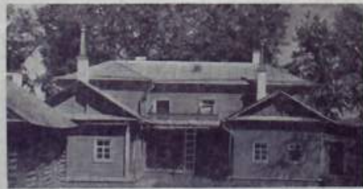
Семья И. И. Ульянова приехала в город Симбирск в 1869 году и поселилась на улице Стрелецкая во флигеле дома Прибыловского. Здесь и родился Владимир Ильич.

В 1875 г. со Стрелецкой Ульянова переехали на Московскую (ныне Ленина) в дом №72. В этом доме прошли юношеские годы В. И. Ленина. В саду растет 187-летний ябл, в тени которого беседка — любимое место отдыха семьи Ульяновых.