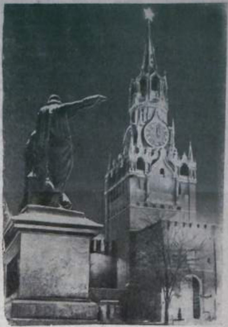
Москва. Спасская башня Кремля ночью.