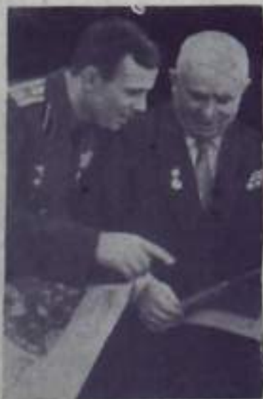
Н. С. Хрущев беседует с первым в истории космонавтом Ю. А. Гагариным на приеме в Большом Кремлевском дворце 14 апреля 1961 года.

Так на практике, в повседневной жизни, будет осуществляться ленинское требование, чтобы «каждый член Совета обязательно нес постоянную работу по управлению государством, наряду с участием в собраниях Советов» и чтобы «все население поголовно привлекалось постепенно... и несению службы государственного управления».