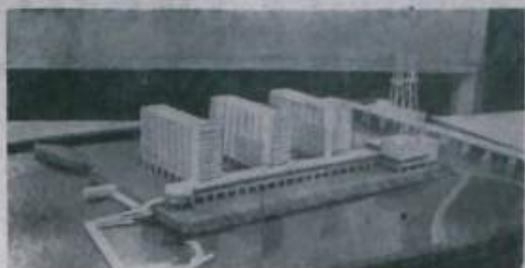
БАКУ. Четыре проекта высотных зданий для морских нефтяных промыслов разработали архитекторы бакинского института «Бакипроект». Каждый проект предусматривает сооружение 11-этажного жилого дома типа гостиницы на три тысячи человек. На строительстве намечается использовать новейшие строительные материалы — алюминиевые защитные покрытия, пенопласты. На Нефтяных Камнях уже началось сооружение насыпной площадки для строительства многоэтажной гостиницы. НА СНИМКЕ: один из проектов высотных зданий для морских нефтяных промыслов.