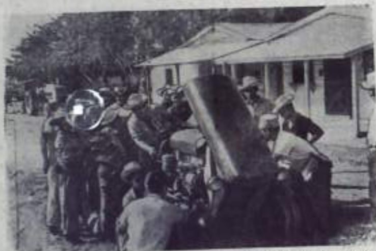
Нубинская Республика. В кооператив Сан-Франциско неподалеку от Монсаньяла пришла техника.