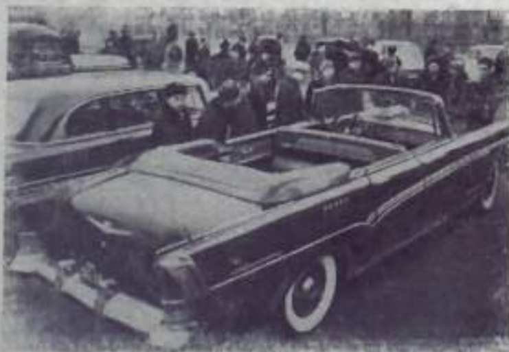
МОСКВА. Во Дворце культуры автозавода имени Лихачева состоялась совещание заводского актива работников предприятий и организаций Управления автомобильной промышленности Мосгосавтонадзора.

В подарок от заводского коллектива к 1 Мая часы «Космос» получит первый летчик-космонавт, Герой Советского Союза Юрий Алексеевич Гагарин.