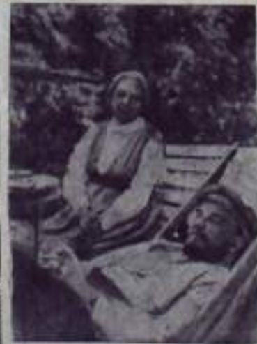
В. И. Ленин и Н. К. Крупная в Горнах у телеснопа.