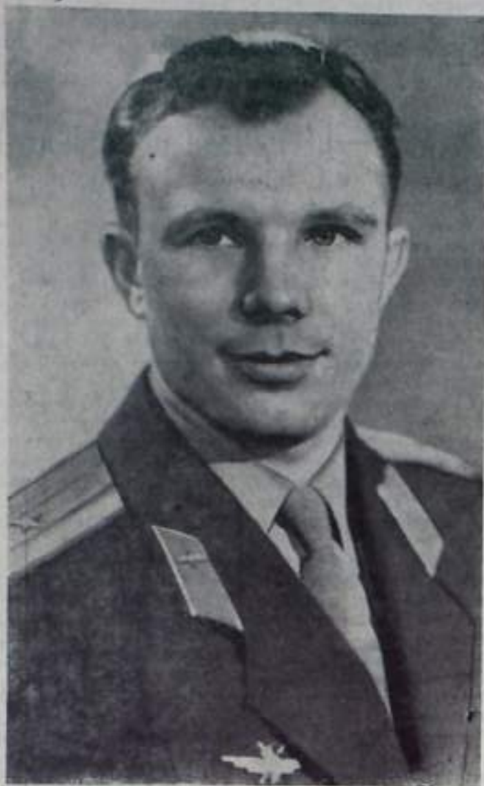
ГАГАРИН ЮРИЙ АЛЕКСЕЕВИЧ — первый в мире пилот-космонавт, совершивший 12 апреля 1961 года полет в корабле-спутнике «Восток».