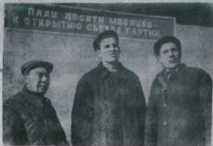
Коллектив Омского нефтеперерабатывающего завода решил создать рационализаторский фонд семилетия и сумме 10 миллионов рублей. За первые два года сэкономили составили 3 миллиона 700 тысяч рублей. Только в 1960 году принято и внедрено в производство 1129 предложений, из них реализовано — 1020. Сейчас каждый пятый работающий на заводе — рационализатор. В 1961 году решено добиться условной годовой экономии от внедрения рационализаторских предложений в 1800 тысяч рублей.