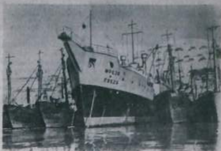
Рыбачи Камчатской области на 15 дней раньше срока завершили выполнение квартального плана. Выловлено на 76 тысяч центнеров рыбы больше, чем за то же время в прошлом году.

В море, омывающее полуостров, на зимних промыслах выловлено в настоящее время десятки траулеров и антарктических сейнеров. Часть флота готовится к экспедиционному промыслу сельди. Коллектив плавучего судоремонтного завода «Фрегат» ремонтирует механизмы, переоборудует трюмы и промысловое оборудование.