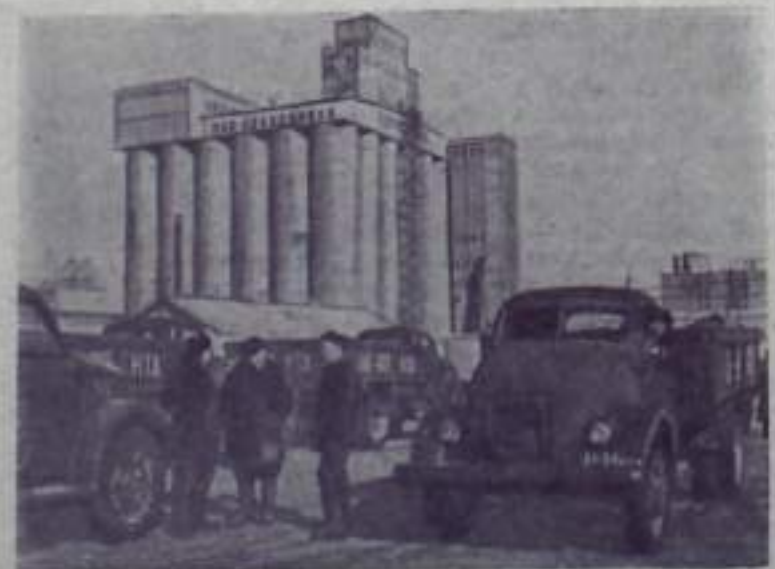
ЦЕЛЫЙ КРАЙ. На станции Тамбов Казанской железной дороги выехал в строй новый элеватор. Плотники и слесари целынского района, спешащие в нарядной, заканчивают обмен редуктора зерна на сортовые семена. На снимке: у нового элеватора.

ОТДЕЛ ПРОПАГАНДЫ И АГИТАЦИИ ГОРКОМА КПСС.