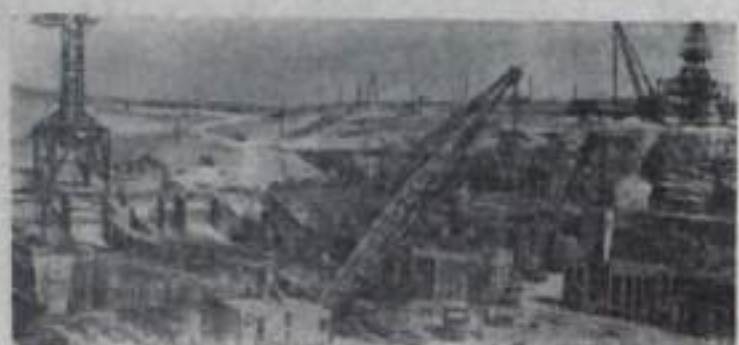
КИРГИЗСКАЯ ССР. На крупнейшей стройке республики — Уч-Курганской ГЭС — с опережением графика идет строительство основных гидросооружений.