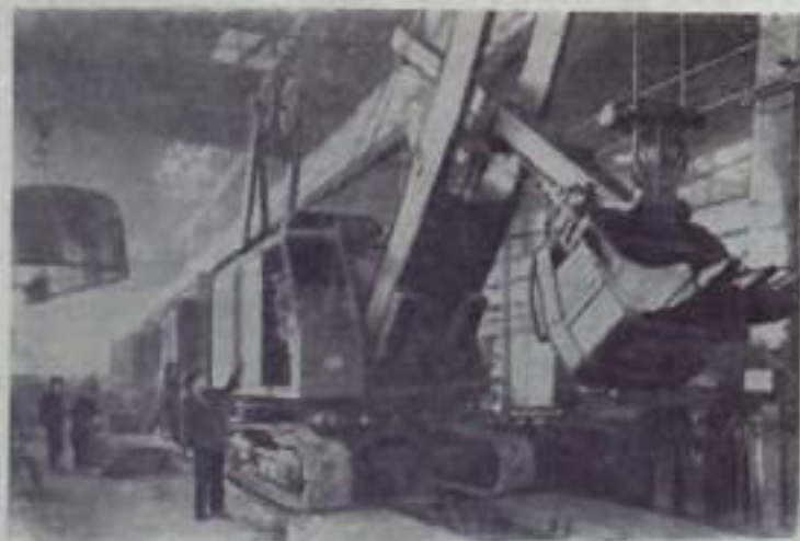
ВЛАДИМИРСКАЯ ОБЛАСТЬ. Родина отечественного экскаваторостроения. Ковьорский завод в июне этого года отмечает столетие своего существования. За годы Советской власти завод стал одним из крупнейших в стране. За последние 30 лет ковьорские экскаваторостроители выпустили свыше 16 тысяч землеройных машин. Эти экскаваторы хорошо известны не только в нашей стране, но и за рубежом, они отправляются в 16 стран. Готовится партия экскаваторов для Объединенной Арабской Республики. Они будут использоваться на строительстве Аравийской плотины.