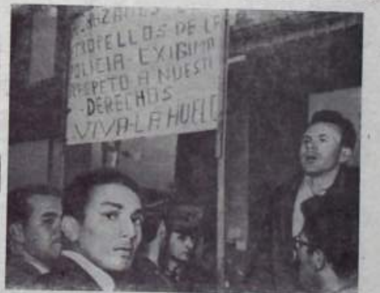
В Колумбии больше месяца продолжается забастовка на предприятии «Леонардас Лара и К» — одной из крупнейших фирм в стране. Администрация угрожает закрыть предприятие, если рабочие не вернутся на работу.

В коммюнике указывается, что все попытки английских колониальных войск разоружить силы народного сопротивления Омала оказались безрезультатными.