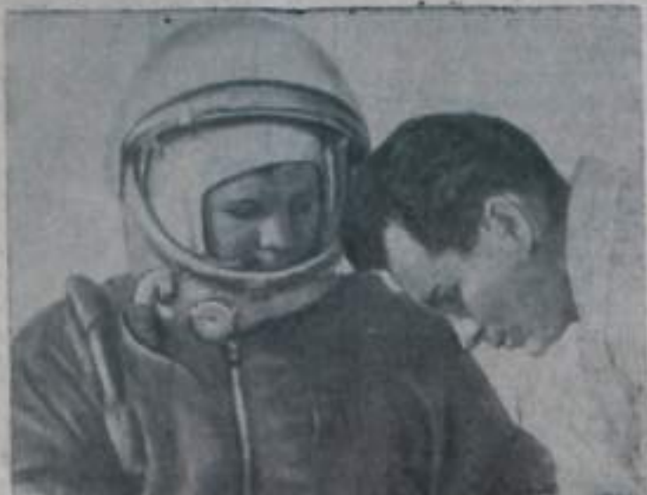
Первый космонавт Ю. А. Гагарин готовится к полету.