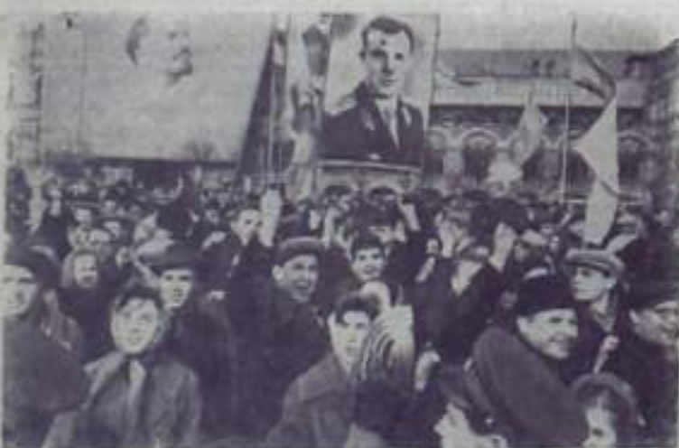
МОСКВА. 11 апреля 1961 года. Митинг трудящихся города Москвы на Красной площади, посвященный великой всемирно-исторической победе советского народа — успешному осуществлению первого в мире космического полета нашего соотечественника Ю. А. Гагарина.