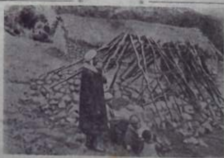
Алжир. В деревне, освобожденной Алжирской национально-освободительной армией.