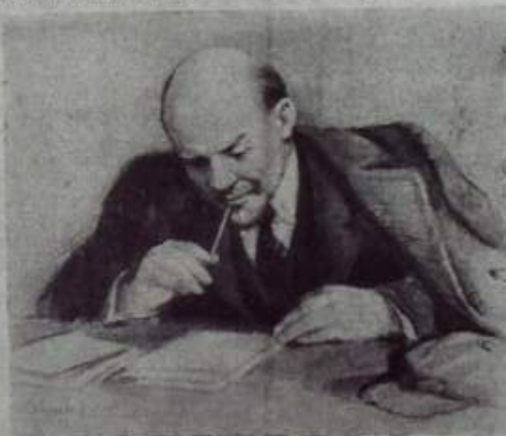
В. И. Ленин за работой

По воспоминаниям и по материалам, оставшимся от Владимира Ильича, необходимо восстановить и эту замечательную способность — умение работать. И отсюда мы точно так же почерпнем много полезных указаний.