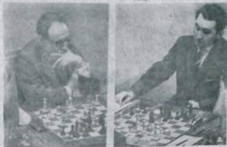
В Москве проходит матч за первенство мира по шахматам между гроссмейстерами М. Ботвинником и Т. Петросяном. На снимке: М. Ботвинник (слева) и Т. Петросян за игрой.