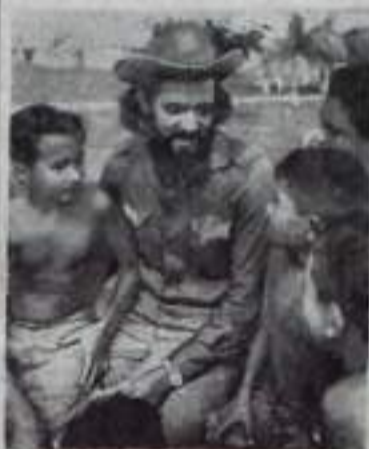
РЕСПУБЛИКА КУБА. Школьный учитель в деревне Каней (Сьерра-Маэстра). Есть о чем рассказать ученикам сражавшемуся в горах смелому бойцу-партизану.