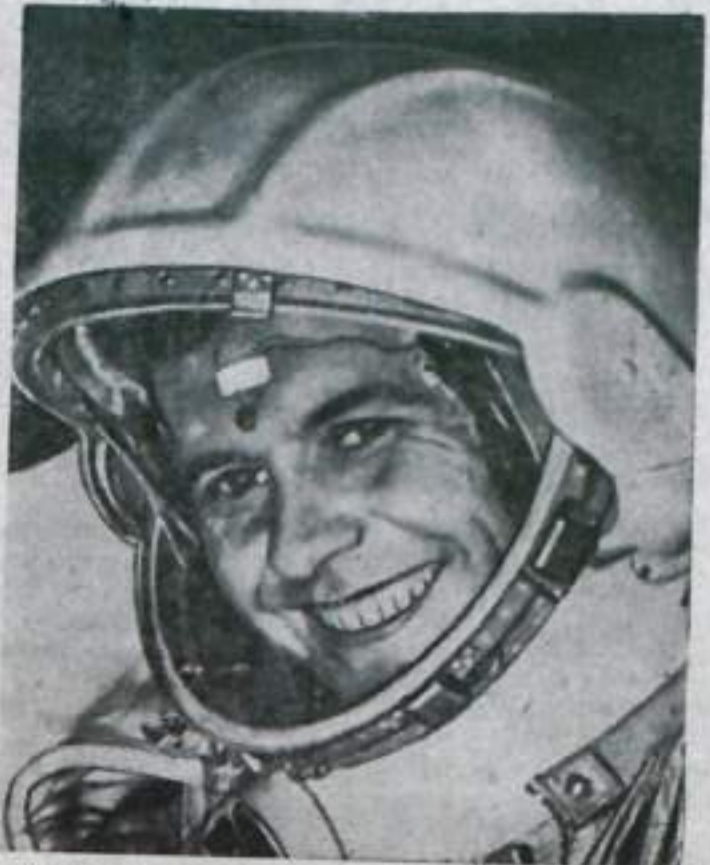
Пилот космического корабля «Восток-4» летчик-космонавт подполковник Павел Романович ПОПОВИЧ.