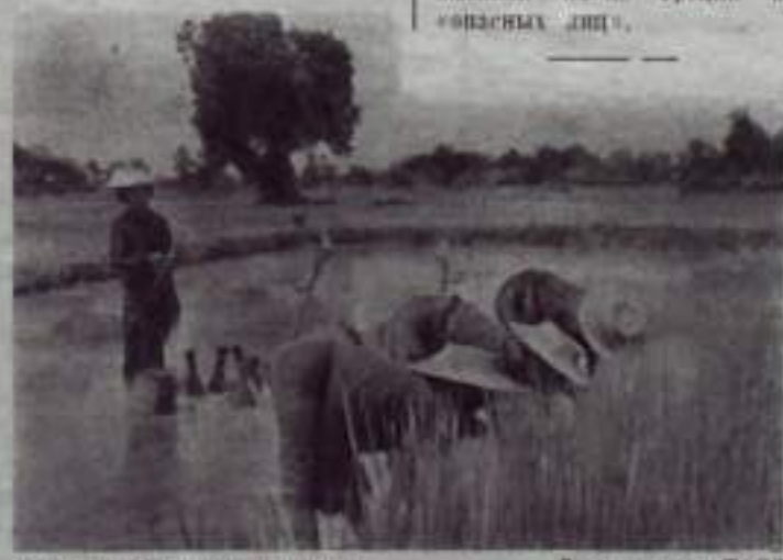
Таиланд. На рисовом поле.

Лес Окренглик в 1941—43 годах был местом массовых казней. Жертвы расстреливались или отравлялись газом от двигателей внутреннего сгорания в специально оборудованных грузовых автомобилях.