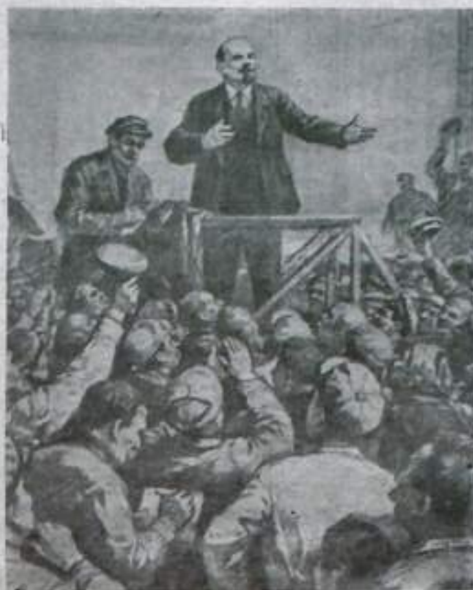
Выступление В. И. Ленина перед рабочими Обуховского завода (1917 г.).

В этот период в редакцию приходило особенно много писем с фронта. Ни о каком подчете их в то время, конечно, не могло быть и речи, потому что не было соответствующего аппарата: он был мал допелая, но это преобладание солдатских писем в первые месяцы революции бросалось в глаза не только нам, работникам редакции, через руки которых проходила вся почта, но и всем читателям «Правды», так как многие из этих писем были напечатаны в ней. В большинстве солдатских писем