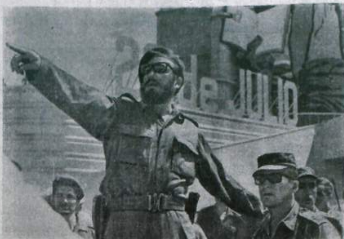
СВОБОДА или СМЕРТЬ!