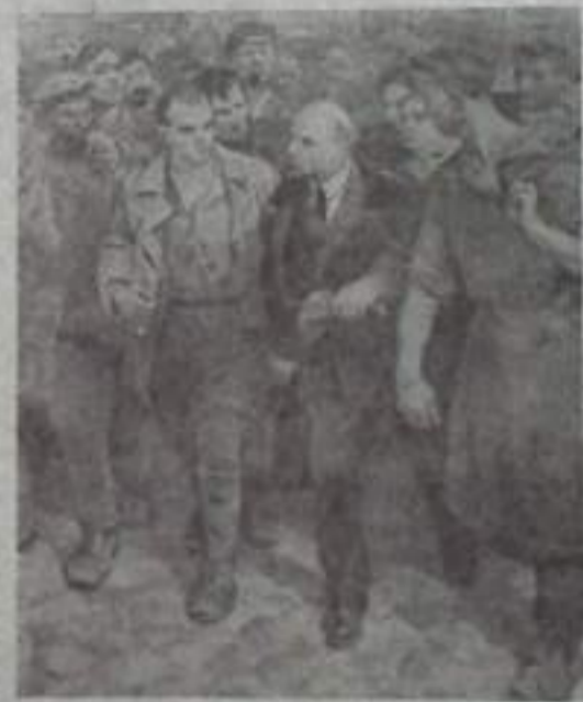
«С Лениным» — картина художника В. А. Серова, выдвинутая на конкурс Ленинской премии 1963 года.