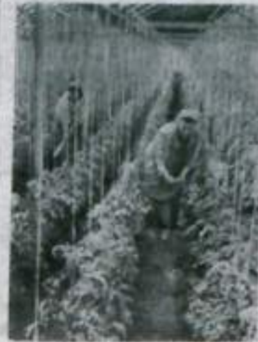
Овощи являются одной из основных статей экспорта Народной Республики Болгарии. В прошлом году экспортировано 2600 тонн овощей, полученных в теплицах.

В марше приняло участие около 10 тысяч человек.