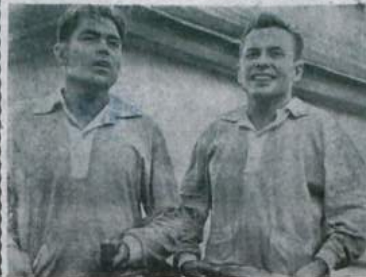
Советские космонавты А. Г. Николаев и П. Р. Попович после приземления в Караганде. (Снимок 1962 года)