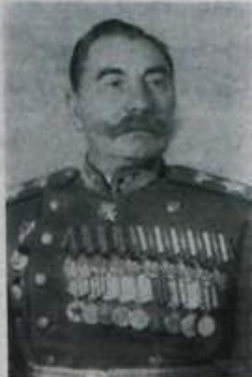
Маршал Советского Союза Семен Михайлович Буденный.