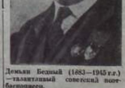
Демьян Бедный (1883—1945 г.) — талантливый советский поэт-баснописец.

В 1922 году Демьян Бедный написал одно из самых значительных своих произведений — поэму «Главная улица». В ней нарисована яркая картина революционных событий в стране, восстел подлинный колосс мира — трудовой народ, от имени которого поэт говорит: