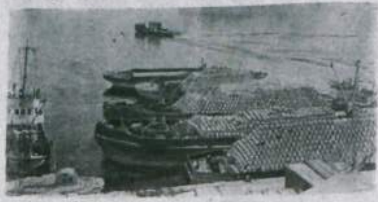
Камчатку палывают рыбным целом страны, и главный вход этого цеха — Петропавловск-Камчатский. Морской и рыбный порты, судоремонт, рыбокомбинат и консервные заводы...