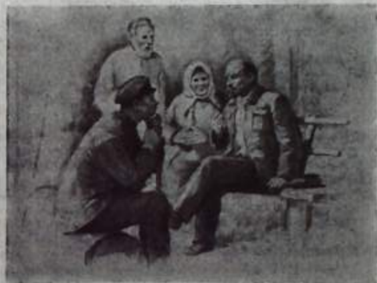
В. И. Ленин беседует с крестьянами в Горках.