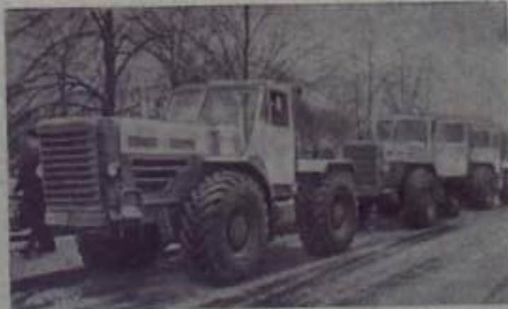
НА СНИМКЕ: колесные тракторы «Т-125»

Писните нам по адресу: г. Кумертау, ул. Карла Маркса, административное здание, 3-й этаж, комнаты 50, 51, 52. Звоните по телефонам: редактор — 34-47, ответственный секретарь и отдел культуры — 33-15, отдел партийной жизни и промышленно-транспортный — 32-21, бухгалтерия — 31-55.