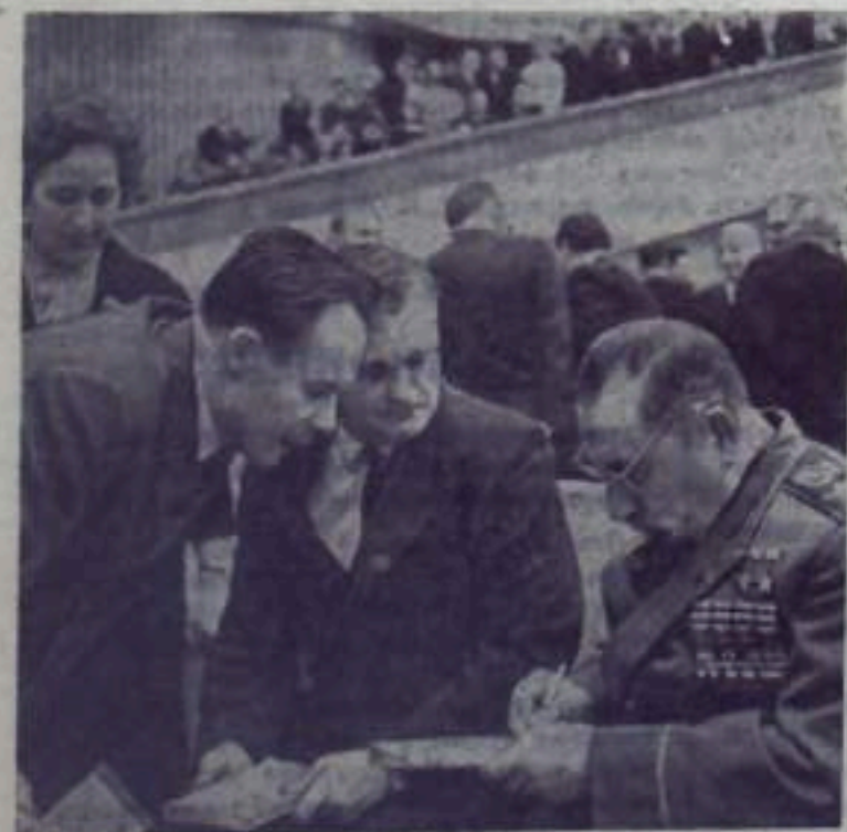
Москва. Кремлевский Дворец съездов. XXIII съезд Коммунистической партии Советского Союза. На снимке: Маршал Советского Союза С. М. Буденный дарит автографы делегатам съезда.