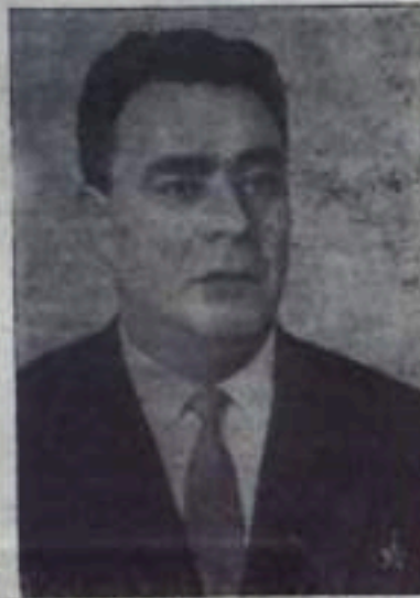
Л. И. Брежнев — Первый секретарь ЦК КПСС.

заседании А. Н. Косыгин первым словом предоставляет секретарю Московского городского комитета партии Н. Г. Егоричеву.