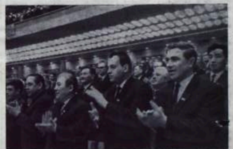
НА СНИМКЕ: в зале заседаний.