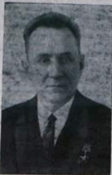
А. Н. КОСЫГИН — Председатель Совета Министров СССР.

430 раз, угля — в 16 с лишним раз, производство цемента — в 39 раз, станков — в 93 раза, тракторов — в 273 раза, минеральных удобрений — в 223 раза.