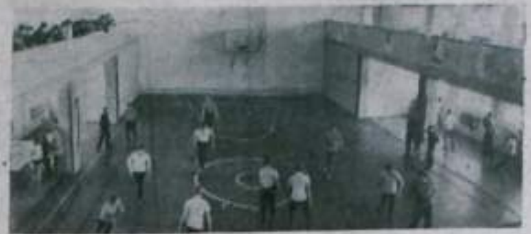
В селе Покровка Октябрьского района Приморского края недавно построен двухэтажный Дом спорта. В 8 секциях здесь занимается около 200 человек: колхозники сельхозартели «Искра», механикаторы треста «Примводстрой», рабочие передвижной механизированной колонны треста «Примвострой», учащиеся строительного профтехучилища, сельская интеллигенция.

НА СНИМКЕ: тренировка баскетболистов.