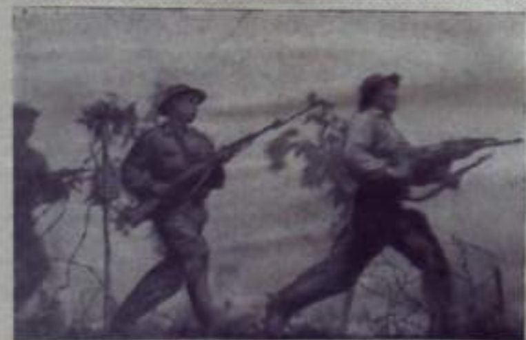
Южный Вьетнам. Части Народных Вооруженных Сил освободили провинцию от американских оккупантов и мариноточных войск. Агрессоры несут тяжелые потери.

Меню квартиру со всеми удобствами в г. Орехово-Зуево Московской области на равноденную в г. Кумертау. За справками обращаться в любое время после 6 часов вечера по адресу: г. Кумертау-4, ул. Пятковская, 16.