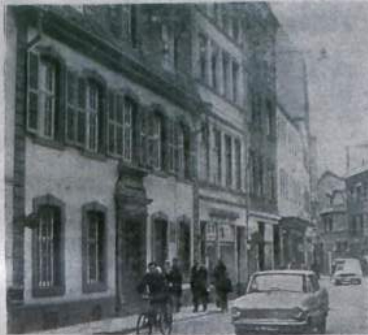
Дом номер 10 (крайний слева) по улице Брюккелштрассе в старинном немецком городе Трире, где 5 мая 1818 года родился Карл Маркс.