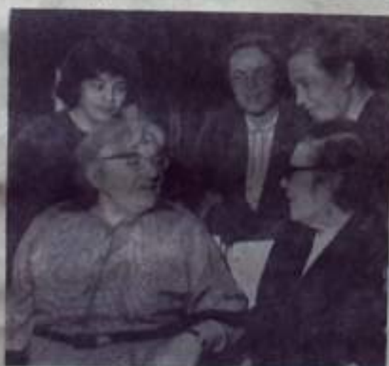
переднем плане слева) беседует с группой женщин.