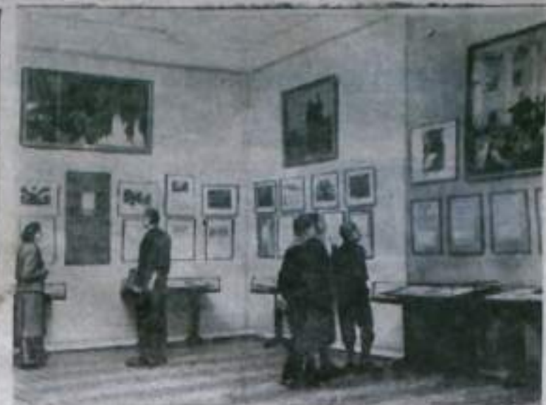
В польском городе Кракове в 1912—1913 годах жил и работал Владимир Ильич Ленин. Он приехал сюда из Парижа, чтобы быть ближе к России, чтобы лучше руководить революционной борьбой на родине.

В Кракове создан музей В. И. Ленина. С его многочисленными экспонатами приезжают знакомиться как польские граждане, так и иностранные туристы.