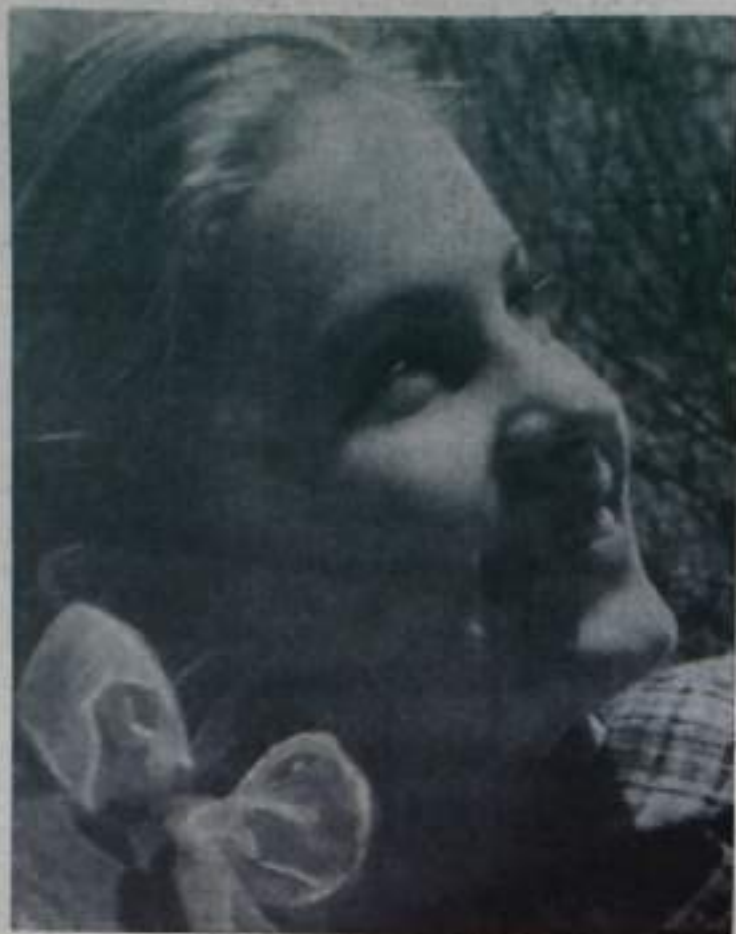
Здравствуй, солнце!