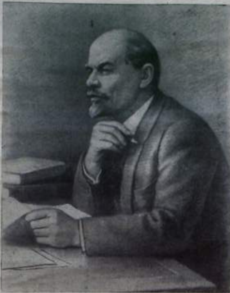
В. И. ЛЕНИН. Рисунок художника А. Кручины.

Разработанная В. И. Лениным научная теория строительства социализма и коммунизма — верный и надежный компас советского народа. Вот уже пять десятилетий неуклонно идет он по ленинскому пути. Могучей, передо-