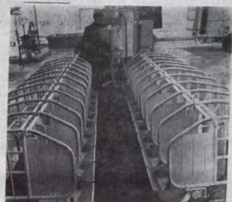
МОСКВА. Свыше 200 телят могут накормить за час три телятницы при помощи установки «УВТ-20», созданной в Украинском научно-исследовательском институте сельскохозяйственного машиностроения. Эта установка для выпаживания телят, которая демонстрируется сейчас на ВДНХ СССР, состоит из двух секций. В каждой из них — десять полных чаш. Молоко или его заменитель поступает в них по трубопроводу из бака емкостью 100 литров. Для заполнения всех двадцати чаш требуется всего лишь три минуты. Количество молока можно регулировать в зависимости от возрастного рациона телят.

НИТЬ УБИВАЕТ МИКРОБЫ Смертоносная для микробов нить создана в Московском текстильном институте совместно с Всесоюзным научно-исследовательским институтом искусственного волокна. Бактерицидное гидратцеллюлозное волокно содержит специальным антимикробный препарат, вводимый на стадии подготовки прижального раствора. Это и обеспечивает стойкую бактерицидность ниточки, которая будет выпускаться нашей промышленностью в виде штапельного полотна (холста или нетканого материала) и нитей. Штапель может использоваться, например, для фильтрации и стерилизации воздуха. Текстильная же нить пойдет для изготовления марли, бинтов и материала для повязок, надежно защищающих рану от проникновения бактерий. Из этих нитей смогут делать и трикотажное белье. Бактерицидное волокно будет показано в павильоне «Химическая промышленность» ВДНХ СССР. (Пресс-центр ВДНХ СССР—ТАСС)