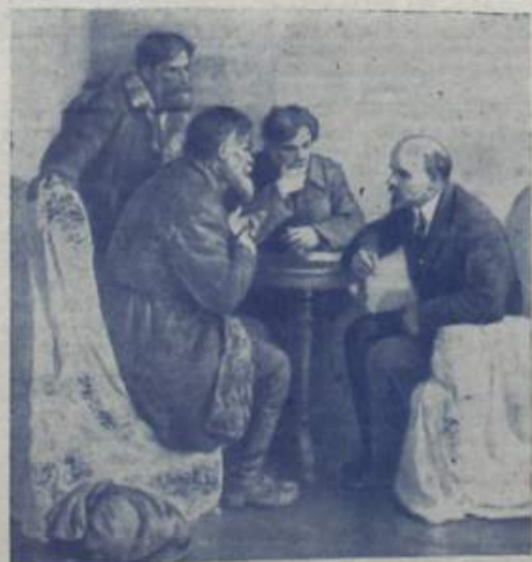
«Ходоки у В. И. Ленина». Художник В. Серов.

«ПУТЬ ИЛЬИЧА» 3 стр. 22 апреля 1970 года.