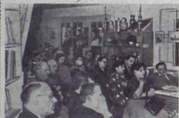
В Швейцарии проходят торжественные собрания и встречи, посвященные 100-летию со дня рождения В. И. Ленина. Такие собрания уже состоялись в Базеле, Локarno, Женеве, Цюрихе и других городах страны. Празднично проходил юбилейный вечер в Лозаннском обществе культурных связей «Швейцария-СССР».

На снимке: во время юбилейного вечера в Лозанне.