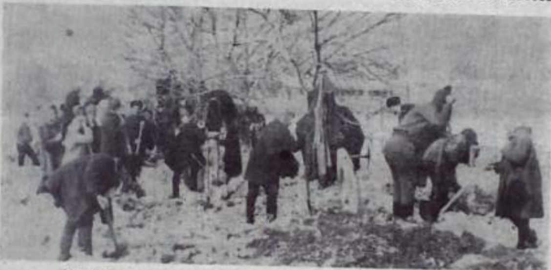
На снимке: машиностроители на уборке снега по улице К. Маркса.