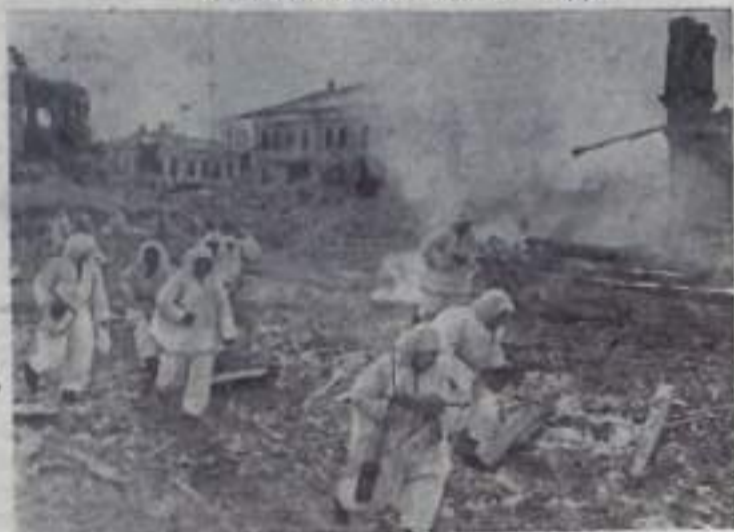
1941 год. Западный фронт. Советские разведчики ворвались в населенный пункт.