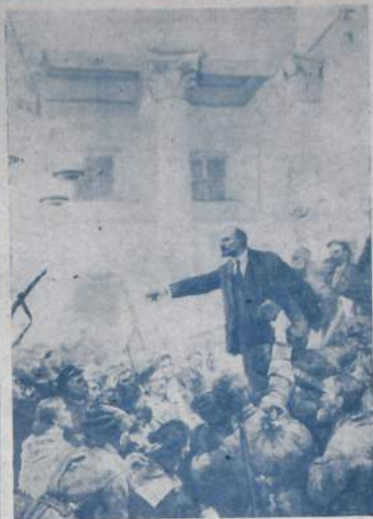
«Ленин провозглашает Советскую власть». Художник В. Серов.

Окончив десятилетку, я решил: буду рабочим. Еду в техникум Кумертау. Угольный разрез в ту пору остро нуждался в машинистах электровазов. Вот я и выбрал для себя эту профессию. Но не тут-то было. Группу по подготовке помощников машинистов уже укомплектовали, а меня зачислили на отделение слесарей по ремонту оборудования. Было горько и обидно. Слишком уж я связался с мыслью, что через два года буду водить электроваза. Обищаться тогда в парторганизацию училища, наверняка бы удовлетворили мое желание. Но сторочка и взял и написал об этом сра-