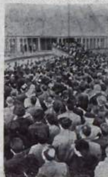
САКА (ЯПОНИЯ). Всемирная выставка «ЭКСПО-70». На снимках: в павильоне СССР посетители осматривают уральский комбайн, сделанный в Караганде; у павильона СССР.

Борьба КПСС за разрядку международной напряженности, против угрозы новой мировой войны.