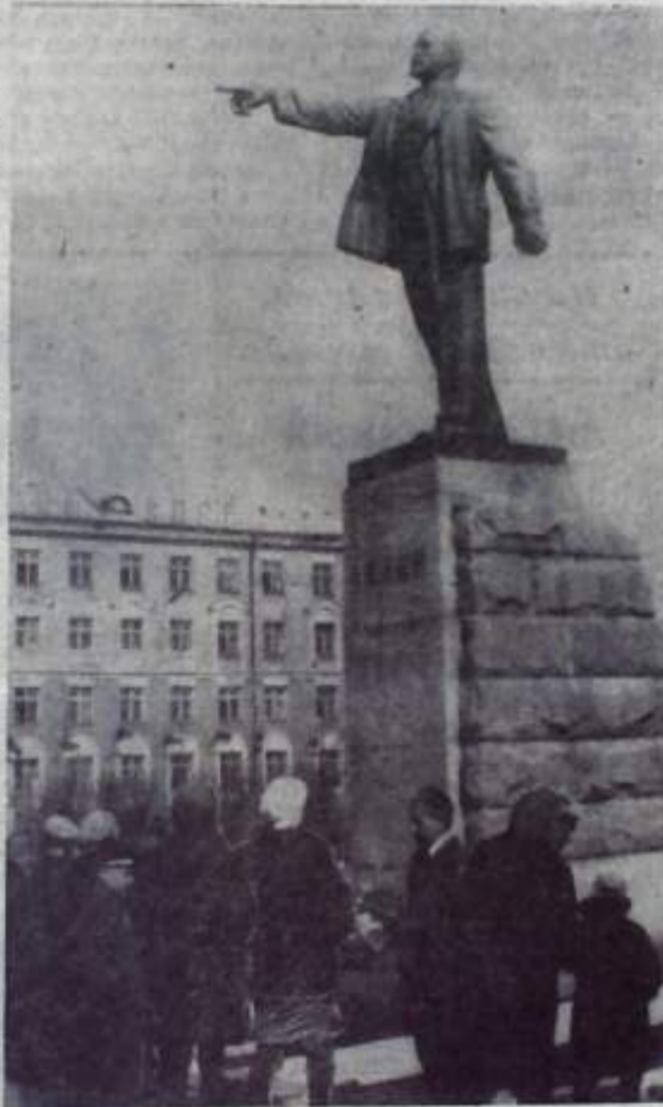
На снимке: у памятника В. И. Ленину.

Трудящиеся города и района, как и весь советский народ, высоко несут знамя социалистического соревнования в честь 100-летия со дня рождения В. И. Ленина. За 4 года и 3 месяца пятилетки промышленные предприятия города и района выработали сверхплановой продукции более чем на 43 млн. руб. Только в прошлом году в закрома Родины засыпано 882 тысячи центнеров добротного зерна. По итогам соревнования колхоз им. Калинина награжден юбилейной Почетной грамотой Президиума Верховного Совета, Совета Министров РСФСР и ВЦСПС. Юбилейной Почетной грамоты Башкирского обкома КПСС, Президиума Верховного Совета и Совета Министров БАССР и областного совета проф-