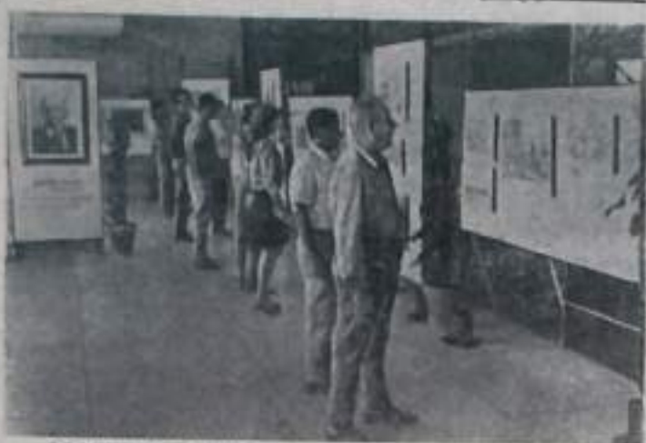
РЕСПУБЛИКА КУБА. В демонстрационном зале гаванского Дворца трудящихся открыта выставка, посвященная жизни и деятельности В. И. Ленина. На ней представлены фотографии и материалы, рассказывающие о входе мирового пролетариата. На снимке: посетители знакомятся с экспонатами выставки.

ЦУРИХ. (ТАСС). Мемориальная доска памяти Владимира Ильича Ленина открыта в Цюрихском народном доме. На стенох зала бронзовый барельеф со знаменитыми всему миру чертами и подписью: «В. И. Ленин, основатель Советского Союза — первого в мире социалистического государства, выступал в этом зале 9 января 1917 года с докладом о значении русской революции 1905 года».