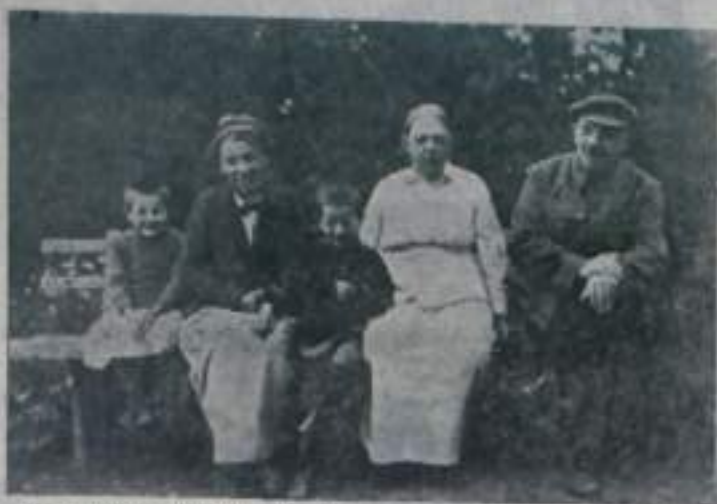
На снимках: сверху — В. И. Ленин, Н. К. Крупская и А. И. Елизарова в Горках, Август-сентябрь 1922 г.