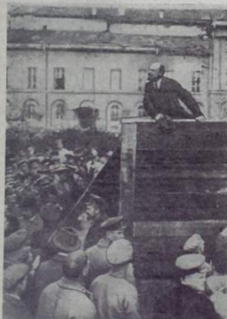
В. И. Ленин выступает с речью на площади Свердлова на параде войск, отправляющихся на польский фронт. 1920 год, 5 мая. Москва.