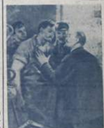
«Беседа с Ильичем». Художник В. Хитриков.

Благодаря вторжению машин в сельскохозяйственное производство возросла производительность труда, ежегодно увеличиваются доходы хозяйства. Это позволяет закупать больше техники, расширить свой технический парк. Только в 1969 году хозяйствам района было реализовано различных видов машин, товаров технического назначения, запасных частей, минеральных удобрений на сумму 2 миллиона 700 тысяч рублей.