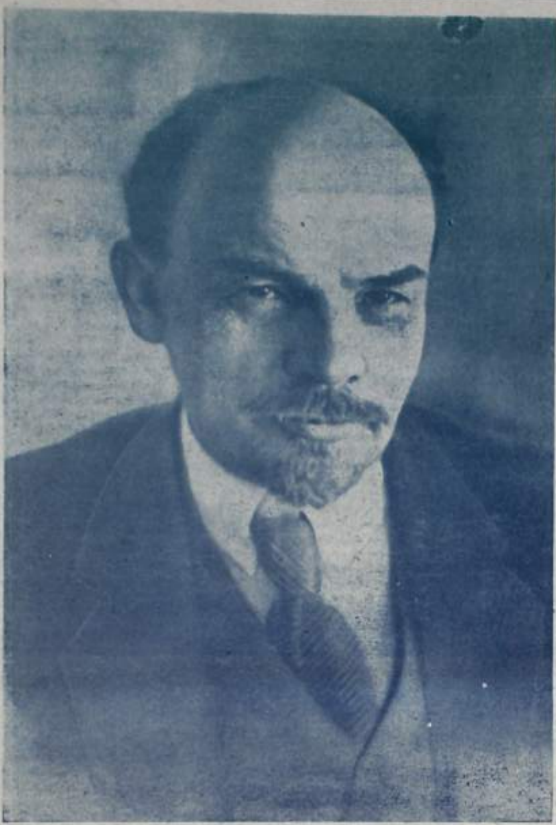
В. И. Ленин. Петроград. январь 1918 года.