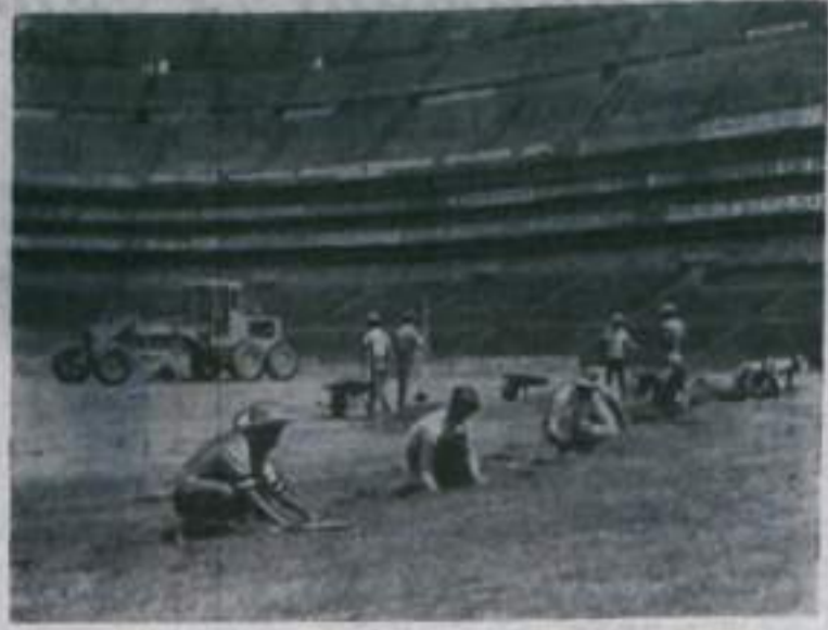
Стадион «Ацтека» в Мехико наводит лоск перед тем как принять сильнейших футболистов планеты. С футбольного поля смяли старый зеленый ковер и настилают новый.

Ровно, кубик к кубку, укладывают мексиканские рабочие плаз стадиона специально выращенной зеленой травой. В ближайшее время работы будут закончены. Затем траву подкормят удобрениями, укатают и обновленный «Ацтека» будет ждать гостей.