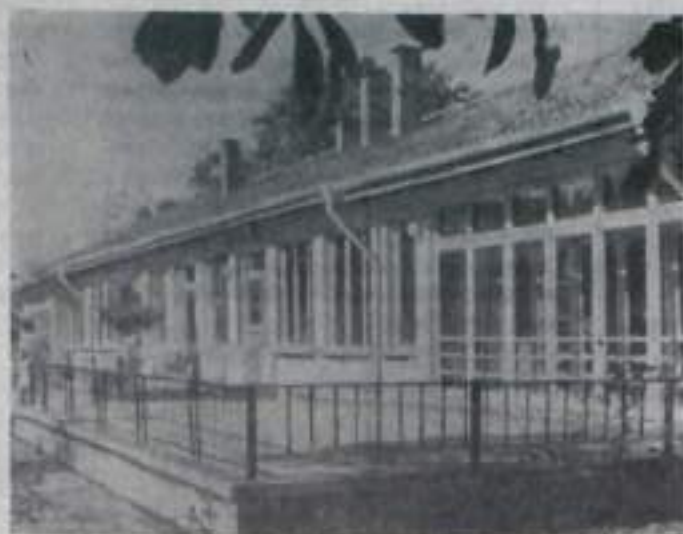
НАРОДНАЯ РЕСПУБЛИКА БОЛГАРИЯ. Многие промышленные предприятия, государственные кооперативные хозяйства, учебные и научные институты, площади и улицы городов носят бессмертное имя великого вождя трудящихся всего мира.

На снимке: детский сад в кооперативе имени Ленина в округе Стара Загора.