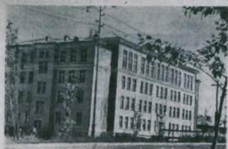
Новое здание школы-интерната в нашем городе.