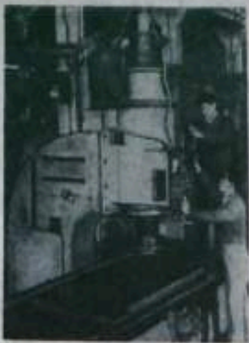
Китайская Народная Республика. На Шанхайском станкостроительном заводе изготовлен первый в стране шифональный станок, предназначенный для точной обработки поверхностей.

Учитывая повышение требований к учителю, совещание, наметив задачи на следующий учебный год, обязало учителей города улучшить качество уроков, сосредоточить внимание на получении учащимися прочных и глубоких знаний и обеспечении органической связи между преподаванием общеобразовательных предметов и производственным обучением, улучшить эстетическое и физическое воспитание, распространять передовой опыт работы, особенно по осуществлению связи обучения с жизнью.