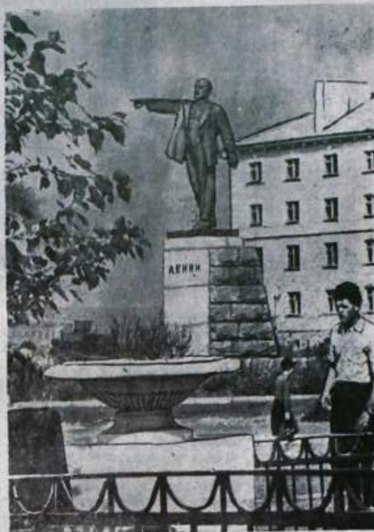
На центральной площади города угольщиков Кумертау.