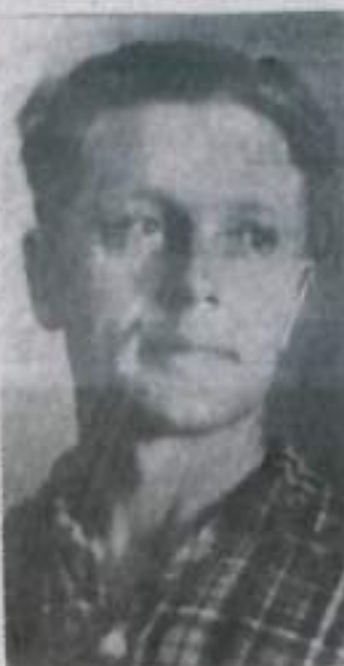
транспортного управления, избрав его на X городскую партийную конференцию.

Высокую честь оказали ему коммунисты погрузочно-