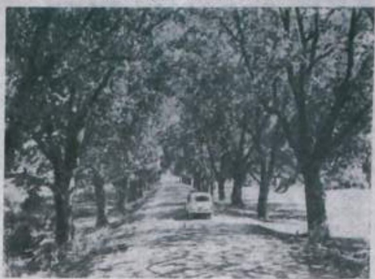
Азербайджанская ССР. Живописная автострада Нуха—Кали—Запатали. Десятки километров ее проходит среди ореховых рощ. На снимке: ореховые деревья на автострате Нуха—Кали—Запатали.