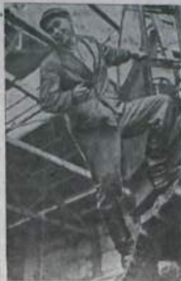
Свердловск. На Уральском заводе тяжелого машиностроения сооружается крупный пех сборных машиностроительных конструк-

Пропаганда коммунистической морали способствует воспитанию трудящихся, помогает им скорее избавиться от пережитков прошлого. Работники суда должны и впредь в своей работе чаще обращаться к общественности, поддерживать связь с населением, рабочими коллективами и их общественными организациями. Это даст возможность успешно бороться за высокие моральные качества советского человека — строителя коммунистического общества.