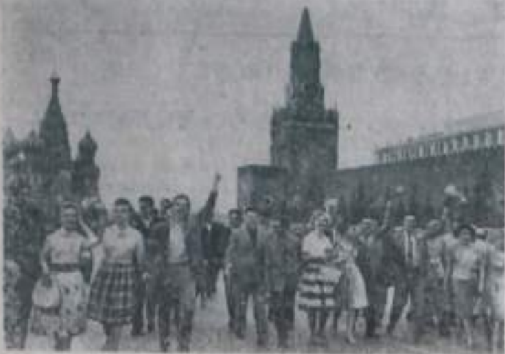
Группа молодежи из стран Латинской Америки с москвичами на Красной площади.