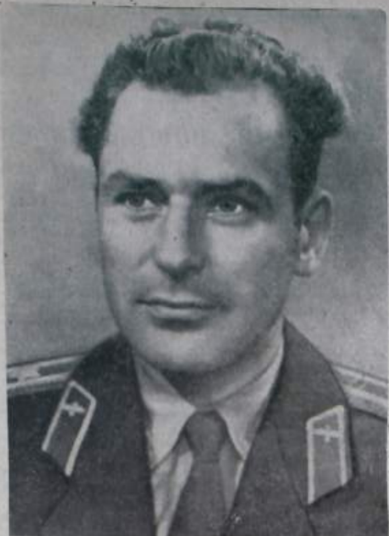
Летчик-космонавт майор Герман Степанович Титов — пилот космического корабля «Восток-2».

№ 96 (1217) ПЯТНИЦА 11 АВГУСТА 1961 г. Цена 2 коп.