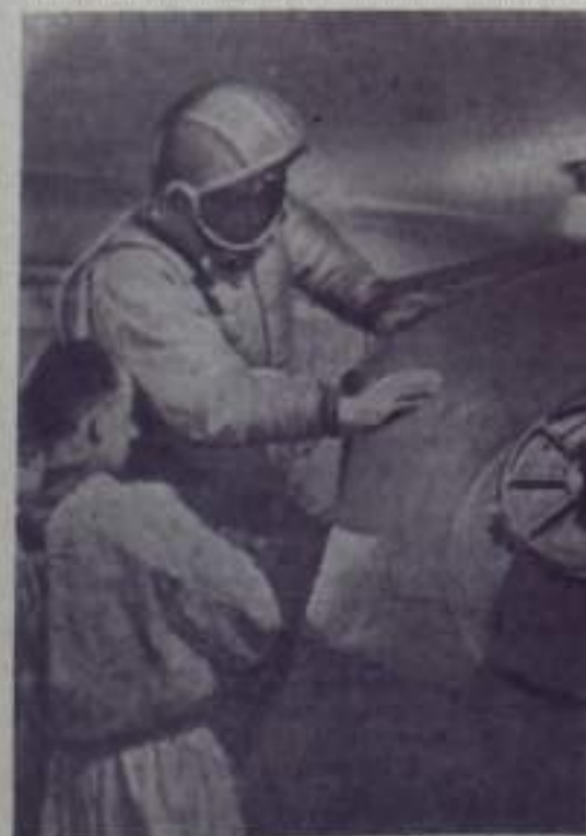
Летчик-космонавт майор Герман Степанович Титов на тренировке перед полетом в космос.

Контроль за выполнением решений отчетно-выборных собраний должен быть глубоким и постоянным, а не от случая к случаю. Долг партийных бюро состоит в том, чтобы претворить решения отчетно-выборных собраний в жизнь, сделать все, что можно, более высоким требованием, которые предъявили коммунисты на этих собраниях.