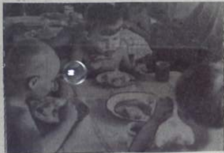
После длительной прогулки на аппетит обиваться не приходится.