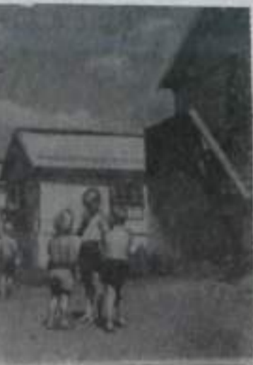
Как под линейку выстроились легкие белые палатки. В них все лето жили малыши детского сада № 4.

Сейчас ребята готовятся к большому празднику: пят и мам — Дню шахтера — и к своему празднику — проводят в школу старших товарищей.