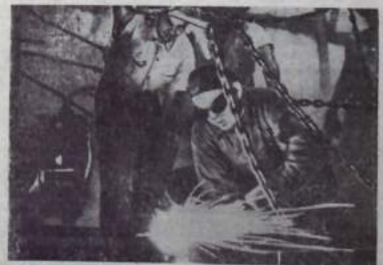
РЕСПУБЛИКА КУБА. В районе Декабрид начато строительство гидроэлектростанции. На совещании августа Иренса Латина, рабочие свободной Кубы показывают образцы самодельного труда. Работы ведутся с любовью над землей. НА СНИМКЕ: на участке строительства.