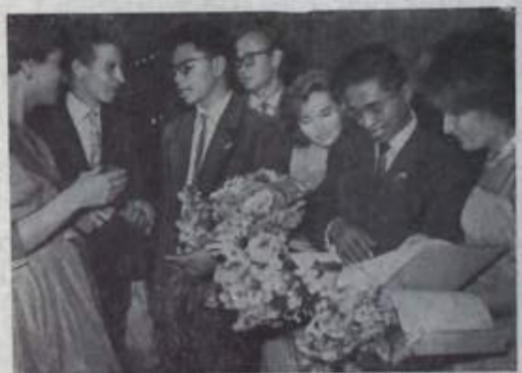
Группа молодежи, прибывшая на форум с Мадагаскара, знакомится с молодежью Москвы.