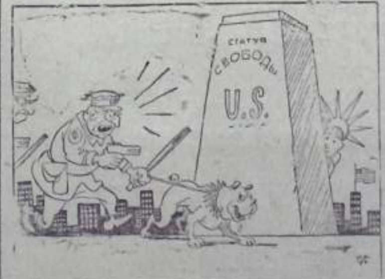
—Где она? Ища и в ФБР тащи! Рис. В. Сычева.

«Свободный мир» — это мир эксплуатации и бесправия, мир попрания человеческого достоинства и национальной чести, мир иранобесия и политической реакции, мир милитаристского разгула и кровавых расправ над трудящимися». (Из проекта Программы КПСС).