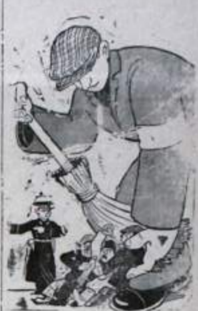
Рис. А. Зубова.