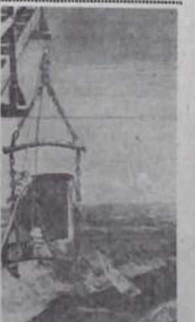
В Читинской области строится Харанорский угольный разрез, который будет одним из крупнейших в Забайкалье.

Разрешите от имени X городской партийной конференции заверить Центральный Комитет КПСС и обком партии в том, что наша городская партийная организация еще теснее свяжет свои ряды вокруг Ленинского Центрального Комитета КПСС и будет упорно и настойчиво бороться за претворение в жизнь задач коммунистического строительства.