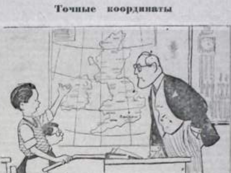
—Джо! Где находится Лондон? —Между базами США и бундесвера, господин учитель!

лия, Турция, Иран и Пакистан. США формально не состоит членом СЕНТО, но является его фактическим руководителем. США и страны СЕНТО разработали планы ядерного нападения на СССР и другие миролюбивые государства с военных баз, расположенных в Турции, Иране и Пакистане. Чтобы обезопасить себя от ответного ядерного удара, руководители СЕНТО напланировали нанесение 40 атомных ударов по территории Ирана и Пакистана. Эти каннибальские планы касаются района среднего Востока. Однако имеются достоверные сведения, относящиеся к опубликованной 19 августа заявлении ТАСС, что подобные планы разрабатывались также и в отношении стран, входящих в так называемый блок, как НАТО и СЕАТО.