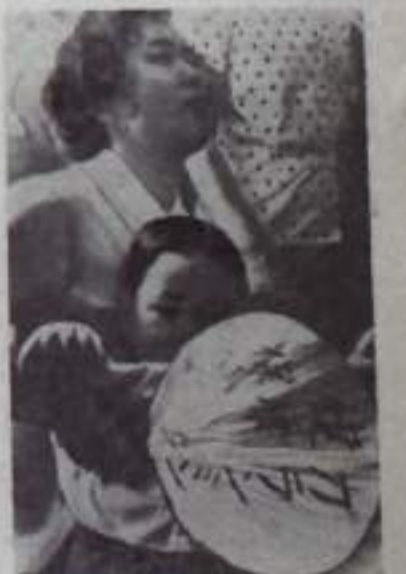
На снимке: участница демонстрации матерей с ребенком. Надпись на плакате: «Мы хотим галаманти».