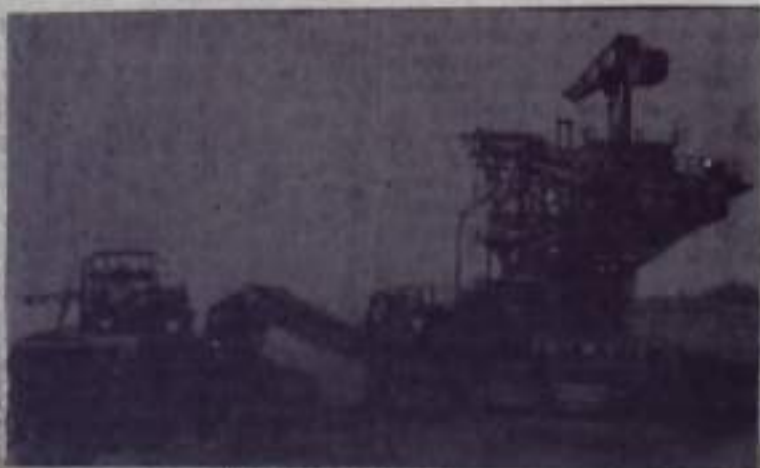
В угольном разрезе.