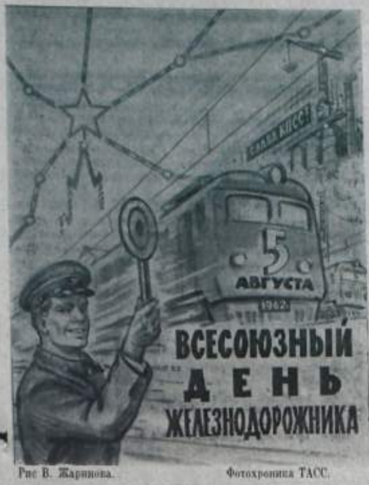
Рис. В. Жарникова.