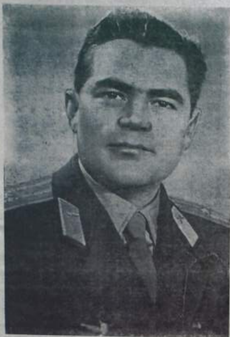
Пилот космического корабля «Восток-3» летчик-космонавт майор Андриян Григорьевич НИКОЛАЕВ.