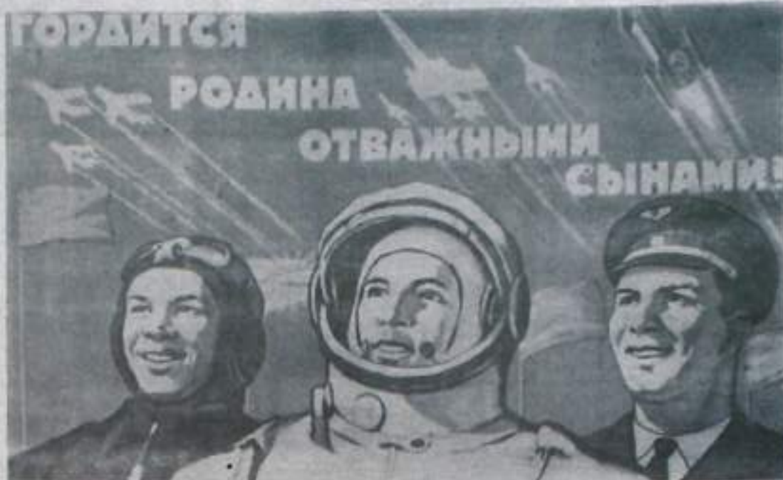
Плакаты художника Е. Соловьева (ИЗОГИЗ)