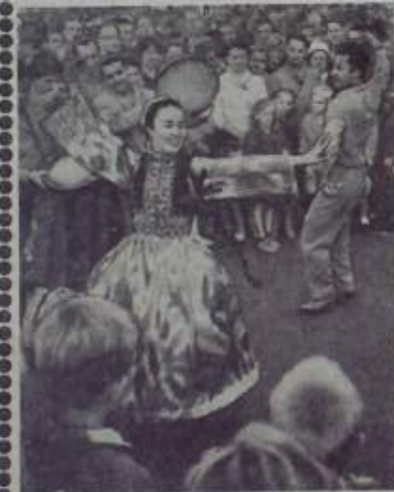
☆☆ НА СНИМКЕ: народное искусство Узбекистана, демонстрация в одном из залов финской столицы, в числе многочисленных зрителей.