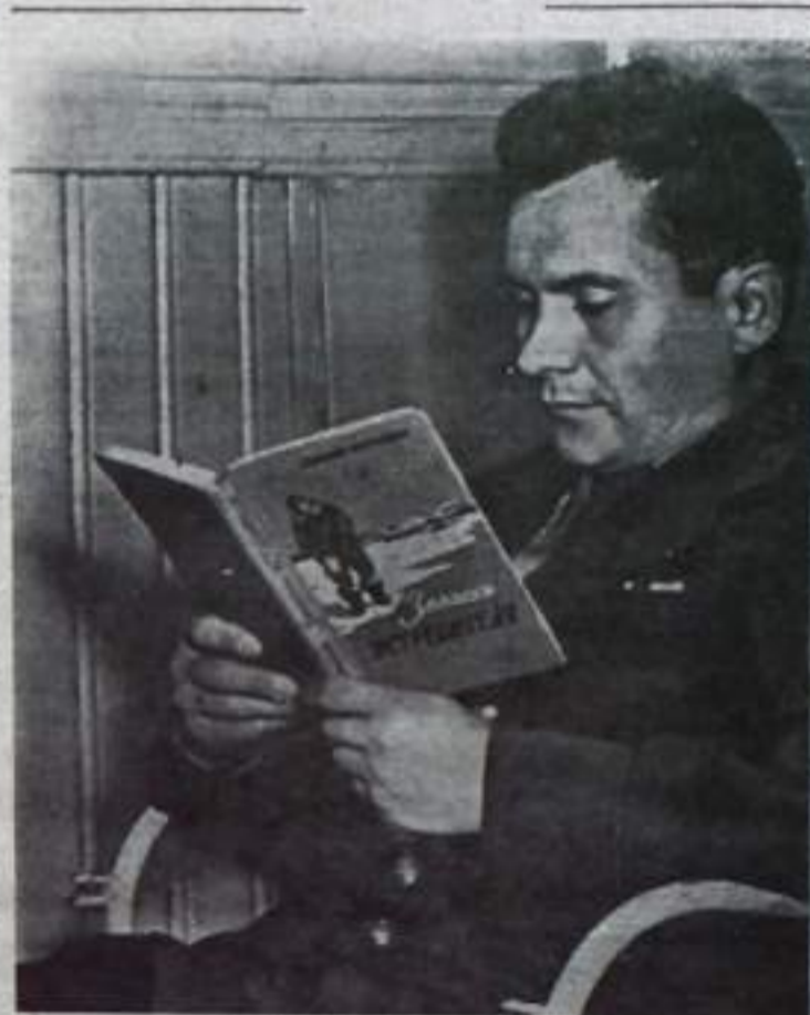
Летчик-космонавт подполковник Павел Романович ПОПОВИЧ.

мос больше не служат целям науки, а преследует лишь военные цели. Наша страна свои открытия в космос ставит на службу делу мира, прогресса всех народов. Советский Союз считает, что обеспечение прочного мира на земле открыло бы перед человечеством большие возможности в деле успешного овладения космическим пространством. Глава Советского правительства Н. С. Хрущев в своем послании президенту США Д. Кеннеди по вопросу изучения и использования космического пространства от 21 марта 1962 года отмечает,