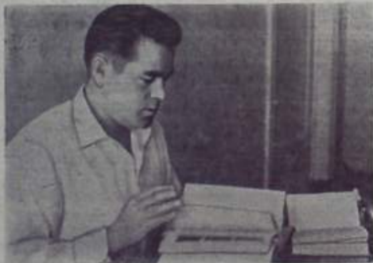
Летчик-космонавт Советского Союза майор Андриян Григорьевич НИКОЛАЕВ.