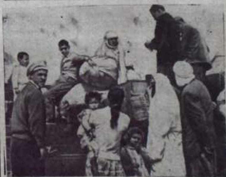
В свободный и незанятый Алжир после длительного отсутствия возвращаются беженцы, бежавшие от зверств французских колонизаторов в соседние с Алжиром страны. Ежедневно из города Джуда, находящегося на марокканско-алжирской границе, направляются на родину 1500—2000 беженцев — стариков, женщин и детей.

На снимке: алжирцы перед отъездом домой.