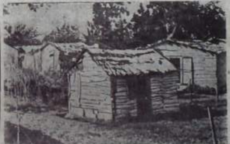
В этих хижинах живут доминиканские крестьяне. Этой и многими другими окружающими деревнями владеет брат убитого диктатора Трухильо.

вителей трудящихся со всех концов героического острова выступил руководитель легендарного штурма Монкада, первый секретарь Объединенных Революционных Организаций и премьер-министр Кубы Фидель Кастро. В большой и яркой речи он привал кубинский народ к бдительности в обстановке угрозы новой агрессии со стороны американского империализма.