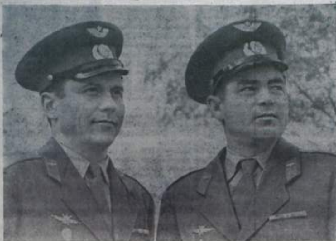
Летчики-космонавты А. Г. Николаев (справа) и П. Р. Попович.

Все космическое исследование, сказал академик, осуществлен