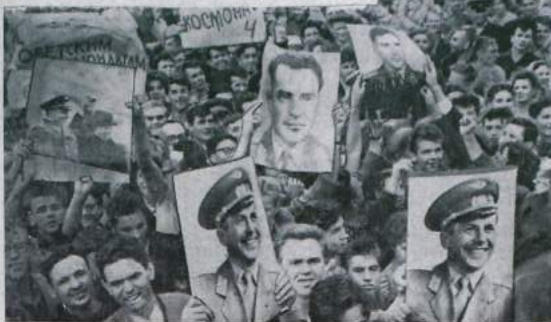
Москва рукоплещет героям.