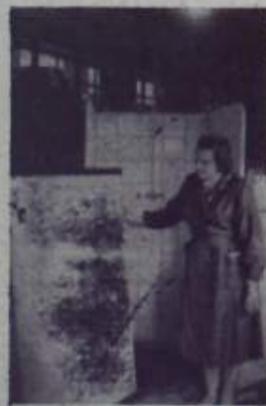
ДОНЕЦКАЯ ОБЛАСТЬ. На экспериментальном участке Краматорского шиферного завода созданы первые образцы цветных деталей из автоцемента. Они найдут широкое применение при облицовке жилых домов и зданий культурно-бытового назначения. На элементных этих новых материалах можно собирать душевые кабины. Скоро на предприятии начнется массовое производство автоцементных строительных изделий.

С 16 августа в первичных комсомольских организациях предприятий, учреждений и организаций нашего города начнутся отчетно-выборные комсомольские собрания. Горком ВЛКСМ составлен график проведения этих собраний.