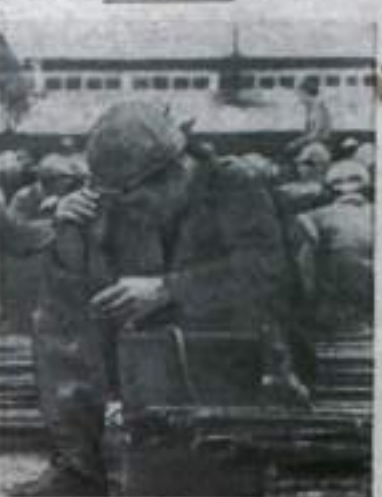
В промышленности Японии наблюдаются кризисные явления. Потерпев провал экономическая политика правительства и так называемая программа удвоения национального дохода, осуществлением которой правительство пыталось увеличить прибыль монополий.

ДЕЛИ. Муссонные дожди, лишившие без перерыва в течение последней недели в Северо-Восточной Индии и Восточном Пакистане, вызвали сильные наводнения в этих районах. В результате разливов рек без крова осталось около полу-миллиона человек. Имеются многочисленные человеческие жертвы.