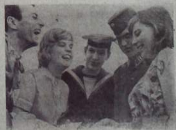
ХЕЛЬСИНКИ. VIII Всемирный фестиваль молодежи и студентов.

В парке Кайганиеме началась манифестация солидарности с молодежью колониальных стран и молодых независимых наций.