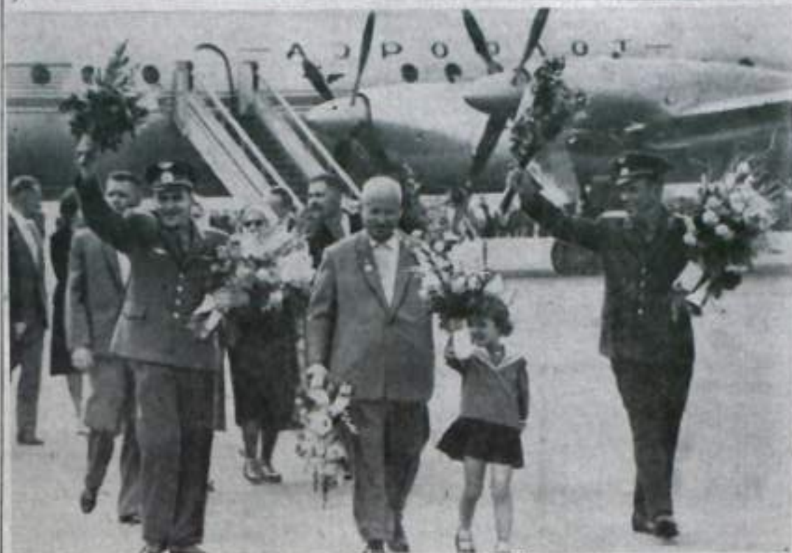
Москва, 18 августа 1962 года. Торжественная встреча на Внуковском аэродроме славных сынов советского народа героев-космонавтов майора Андрия Григорьевича НИКОЛАЕВА и подполковника Павла Романовича ПОПОВИЧА.

На снимке: во время встречи.