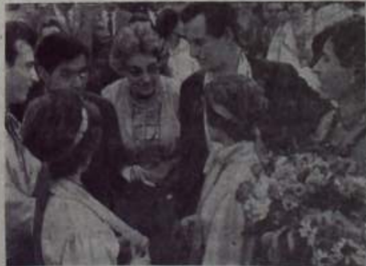
Хмельники. VIII Всемирный фестиваль молодежи и студентов.

цию значительно улучшилось обслуживание связей, сократилось количество обслуживающего персонала.