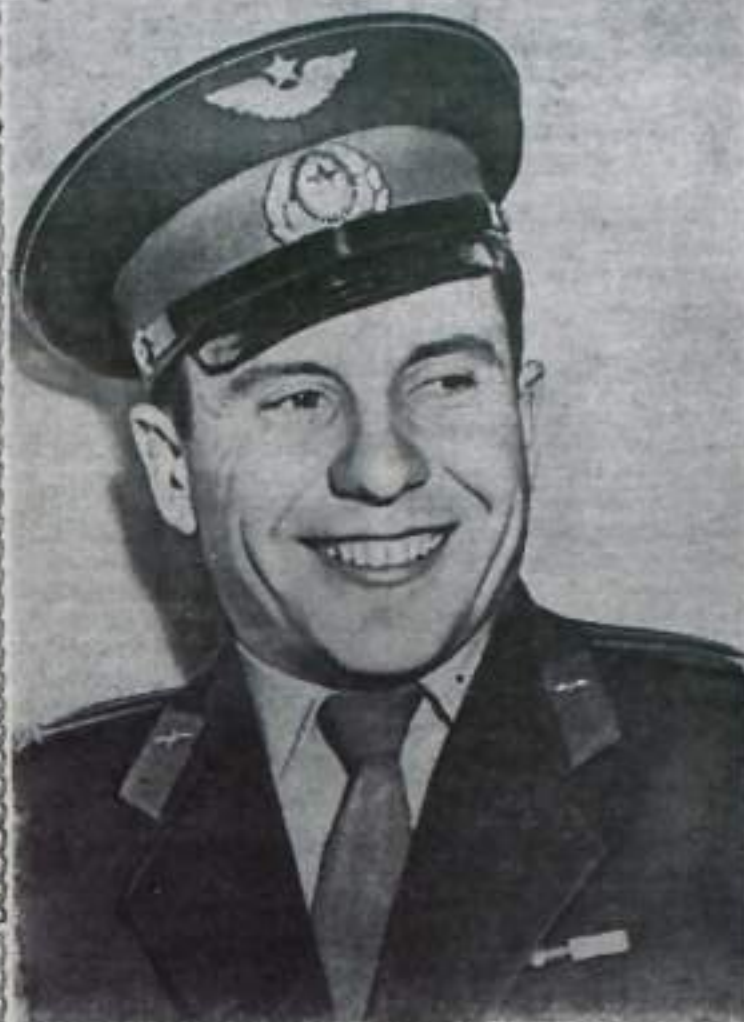
Пилот космического корабля «Восток-4» летчик-космонавт подполковник Павел Романович ПОПОВИЧ.

Н. ФАХРИСЛАМОВ, помощник машиниста элеватора.