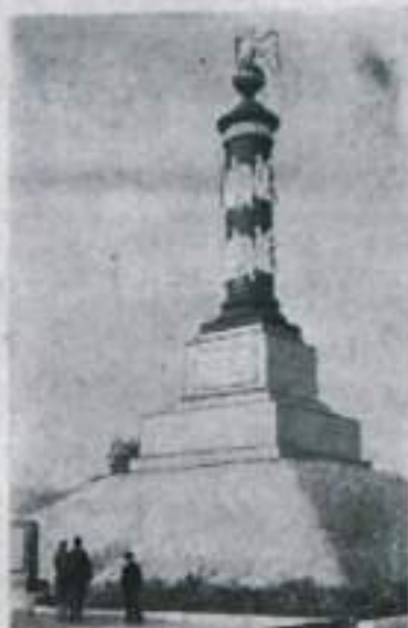
Союза посещают Тарутино.

В дни подготовки к 150-летию юбилею Отечественной войны 1812 года тысячи экскурсантов со всех концов Советского