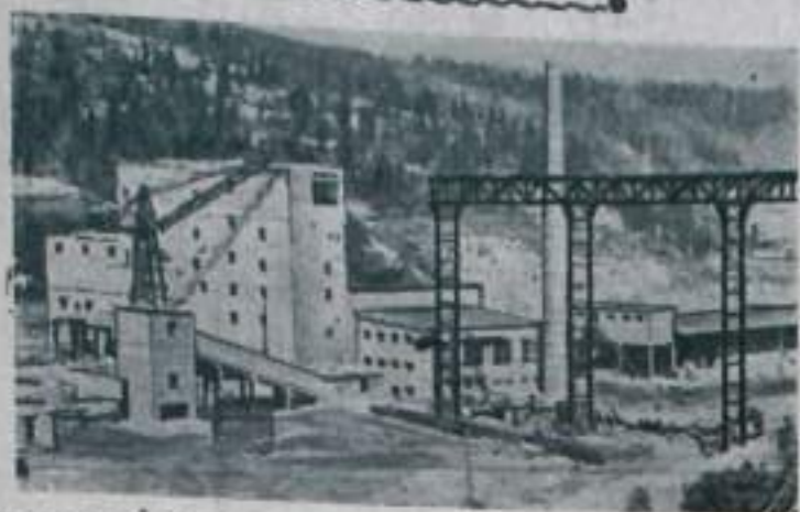
КЕМЕРОВСКАЯ ОБЛАСТЬ. В Кузнецком бассейне сооружается мощная шахта «Томьусинская 5-6». Ее проектная мощность 8000 тонн концентрированного угля в сутки. Строители решили сдать ее в эксплуатацию на три месяца раньше срока. Они работают по составленной ими скоростному графику. НА СНИМКЕ: общий вид строящейся шахты «Томьусинская 5-6».