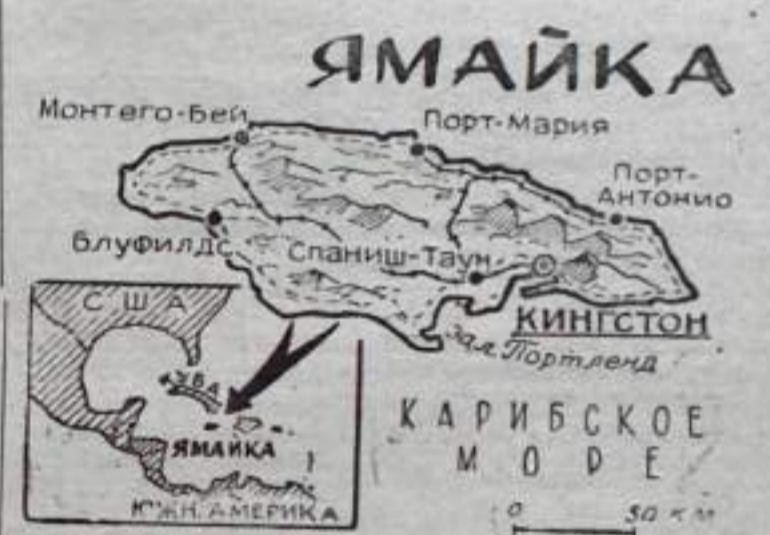
Рис. А. Ведерникова.