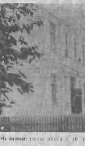
На снимке здание завода № 10 в процессе ремонта.

Ремонт закончен вовремя, что позволило избежать задержек. Работы выполнялись в соответствии с графиком. Все работы выполнены качественно.