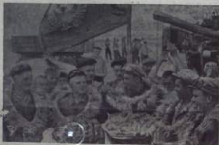
ОДЕССКАЯ ОБЛАСТЬ. Традиционный праздник «День урожая», посвященный окончанию жатвы и выполнению плана заказа государства, справили труженники колхоза имени Суворова Коминтерновского района.

«ПУТЬ ИЛЬИЧА» 3 стр. 10 августа 1966 года.