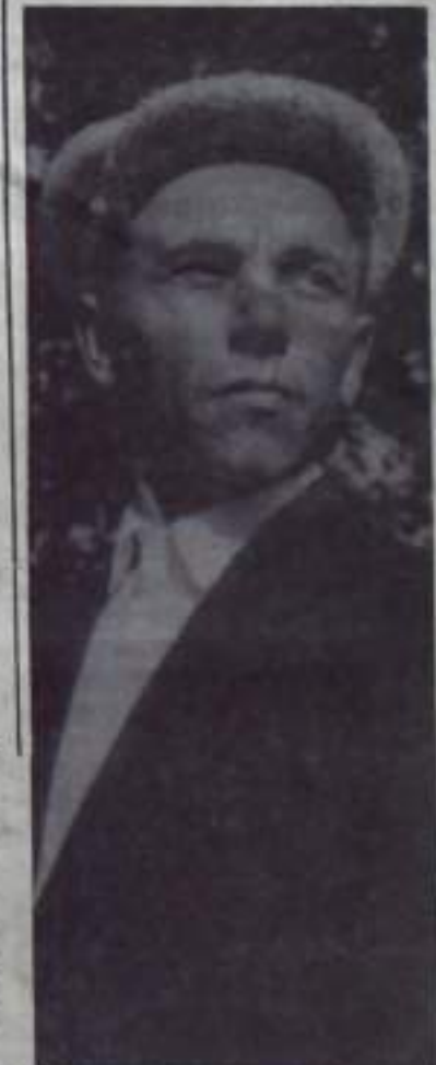
«ПУТЬ ИЛЬИЧА» 3 стр. 3 августа 1966 года.