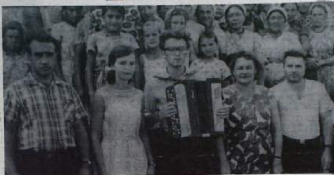
На снимке: члены агитбригады Ермалаевского Дома культуры среди рабочих отделений «Урняк» после выступления.