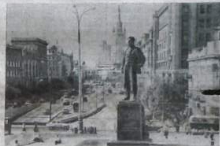
На снимке: Площадь Малого Арбата.