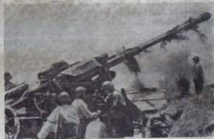
ДЕМОКРАТИЧЕСКАЯ РЕСПУБЛИКА ВЬЕТНАМ. Расчет зенитного орудия на охране воздушных подступов к Хайфону.