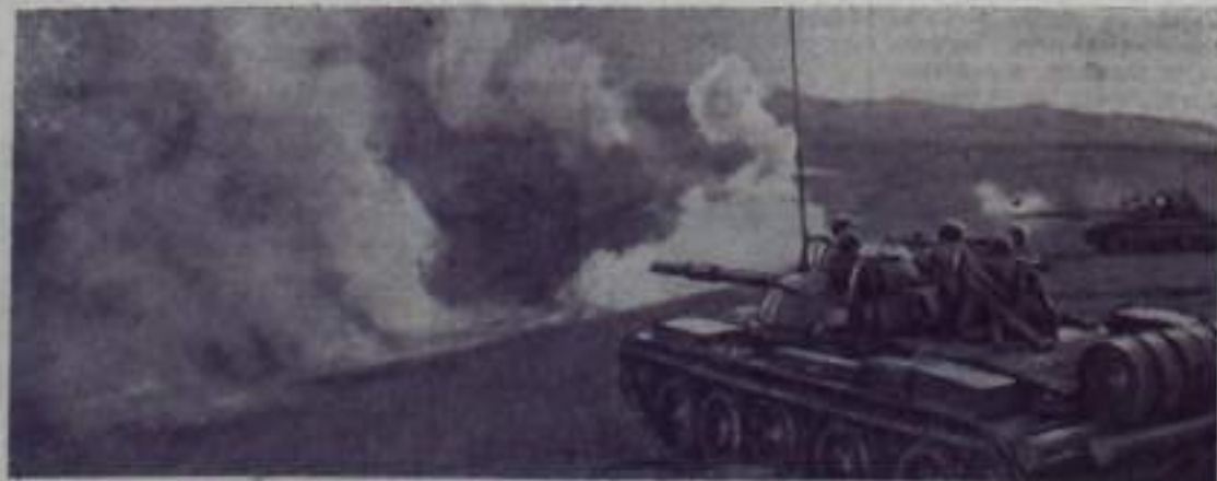
Танка подразделения офицера Г. С. Сименцова во время тактических занятий.