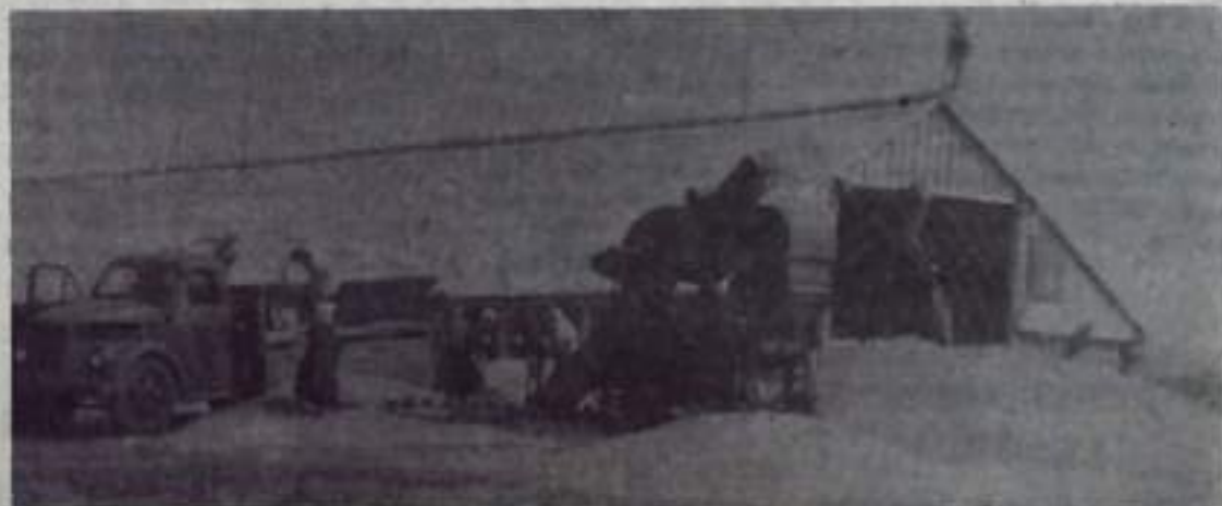
НА СНИМКЕ: страда на току колхоза «Красная поляна».