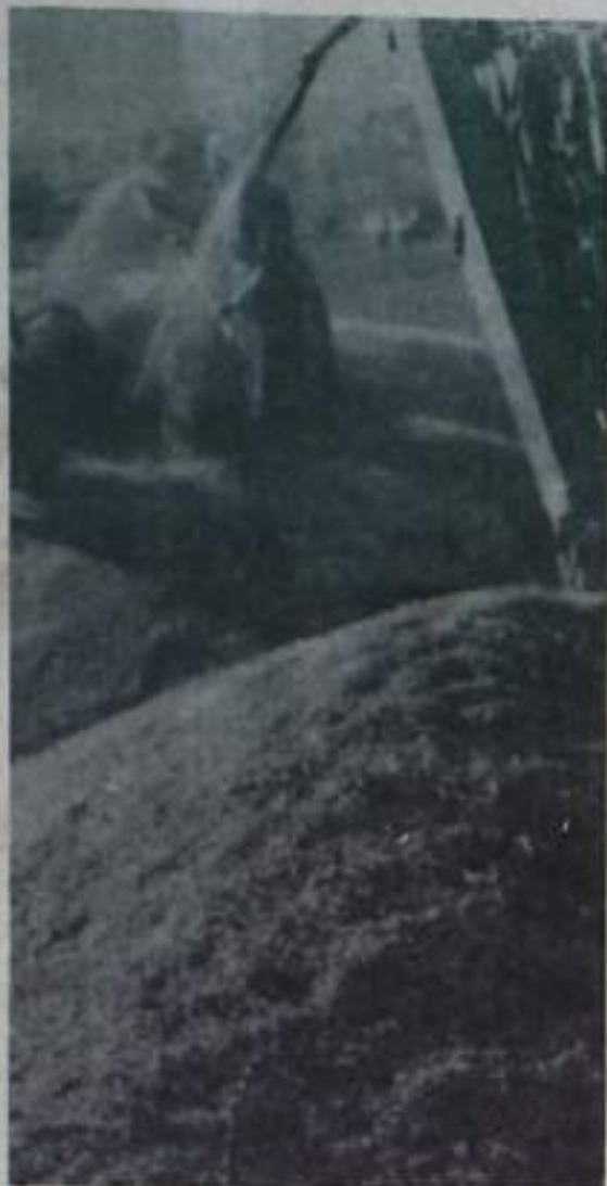
Вот он, хлеб нового урожая!