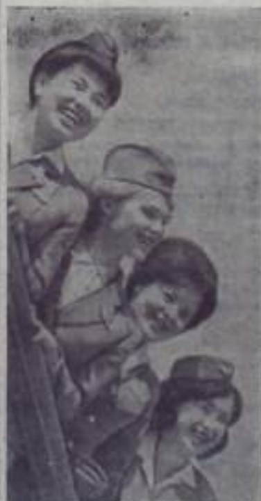
С каждым годом все шире размах крыльев нашей Родины, уверенно идущей во гла-

ве авиационного прогресса. Тысячи советских пилотов своими героическими подвигами возвеличили и прославили нашу авиацию. С особенной силой отвага и высокое мастерство крылатых защитников Родины проявились на фронтах Великой Отечественной войны. Сейчас у нас создана реактивная, сверхзвуковая, ракетнооснащенная авиация, нашим самолетам доступны скорости, почти втрое превышающие скорость звука. Успехи отечественной науки и техники в самолетостроении и создании могучих ракет способствовали триумфу нашей Родины в осуществлении полетов человека и звезд. Первооткрывателями неслыханно явились воспитанники Военно-Воздушных Сил.