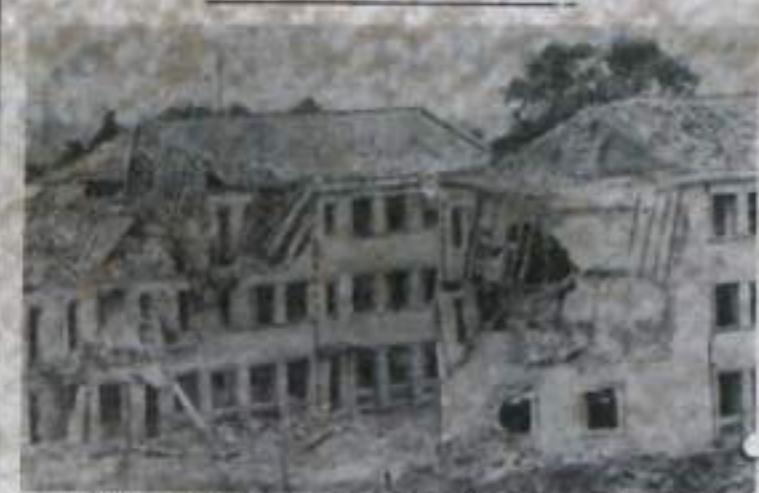
ДЕМОКРАТИЧЕСКАЯ РЕСПУБЛИКА ВЬЕТНАМ. Вот что оставили после себя американские стервятники в городе Уонгби. В этих домах жили рабочие-электрики.