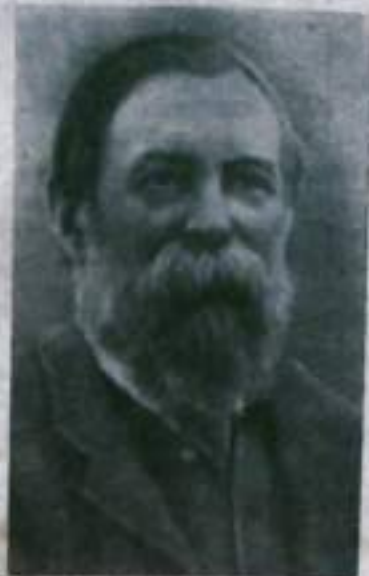
5 августа 1895 года умер Фридрих Энгельс.