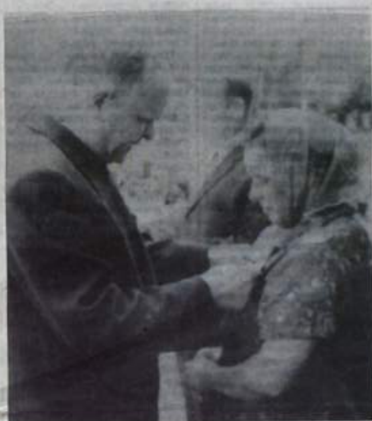
На снимке: момент вручения наград.

...Лучшим труженникам города вручаются правительственные награды, а коллективам-победителям соцо-