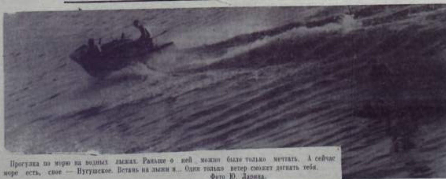
Прогулка по морю на водных лыжах. Раньше о ней можно было только мечтать. А сейчас морю есть, свое — Вугушское. Встань на лыжи и... Одна только петер сможет догнать тебя.

На экране кинотеатра «Горький» Сегодня — «ПЕТУХ», «Король Дреодобород». С 8 августа новая кинокомедия «БЕРЕГИСЬ АВТОМОБИЛЯ».