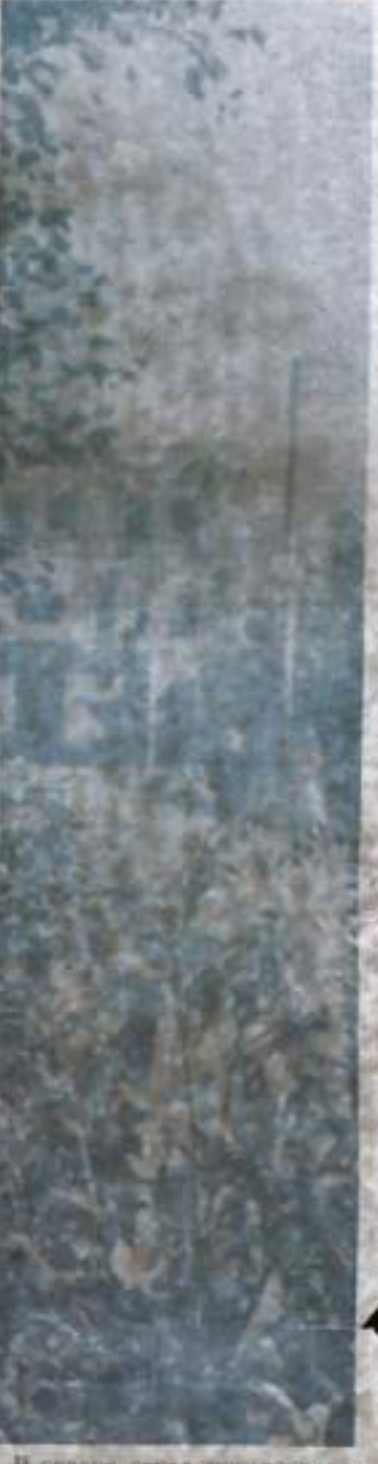
В старе перед управленем угольного района