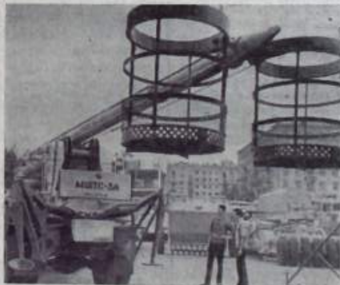
МОСКВА. Этот снимок сделан в разделе «Строительство» Выставки достижений народного хозяйства СССР. Здесь демонстрируется новая техника для жилищного, промышленного и автомобильного строительства.

Монтажная машина «МШТС-3А», которую вы видите на снимке, смонтирована на автомобиле «ЗИЛ-130» и поднимает двух рабочих с инструментом, материалами и деталями непосредственно к рабочему месту на высоте до 20 метров со скоростью 20 метров в минуту. Грузоподъемность ее — до 400 килограммов. «МШТС-3А» может быть использована при строительстве и эксплуатации жилых и промышленных зданий, различных наземных сооружений. Годовой экономический эффект от применения одной машины — 4500 рублей.