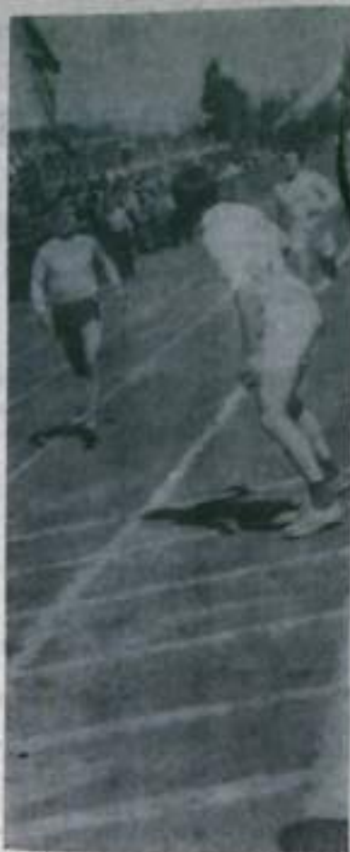
На снимках: сверху слева — награды сильнейшим; внизу — момент борьбы; справа — на дистанции эстафеты.