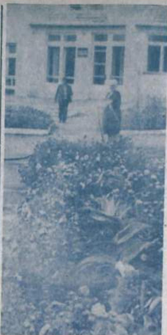
В профилактории колхоза «Башкирская» созданы все условия для летних горняков. Здесь имеются различные и современные ванны, специальные физиотерапевтические кабинеты, современные новейшие медицинские приборы.