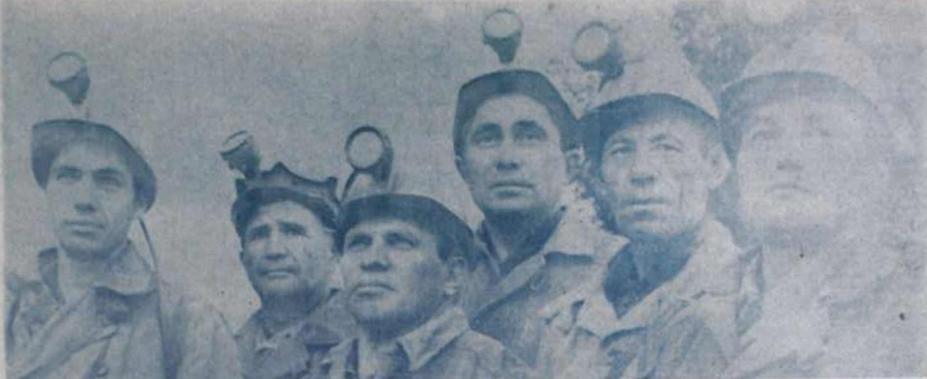
Пролетарии всех стран, соединяйтесь!