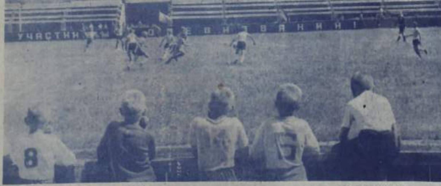
Кто кого в этот раз победит...

Детский кинотеатр «ЗВЕЗДОЧКА» 12-13 августа — «ЕСЛИ ЕСТЬ ПАРУСА» — 12.30, 14.30, 16.30. «Я ШАГАЮ ПО МОСКВЕ» — 10, 12, 14, 16.