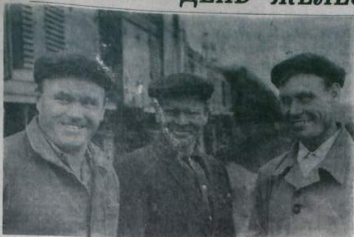
«Миллионщиками» называют бригады локомотивов № 26, 64 и 106. Они успешно выполняют свои обязательства по вывозке миллиона тонн горной массы в год.