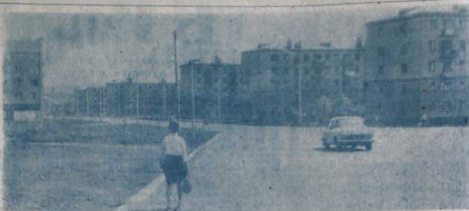
Страна меняет границы.

Всем этим кумертаусцы обязаны людям благородной и почетной профессии, людям, на которых мы заслуженно чествуем сегодня и поздравляем с праздником — Днем строителя.