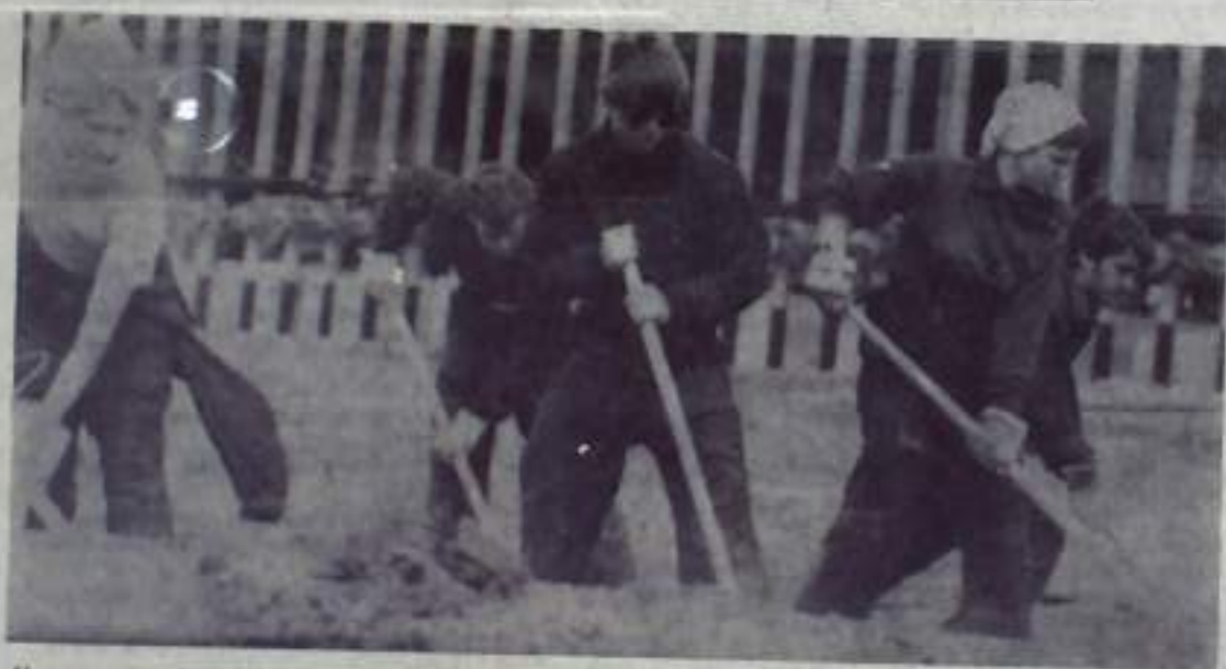
Четвертая бригада отряда «Икар» ведет строительство монолитной дороги.