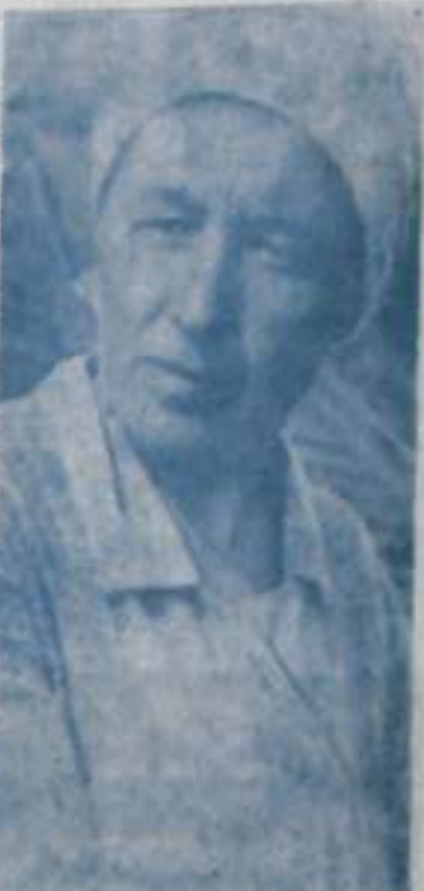
Ежегодному росту объема до