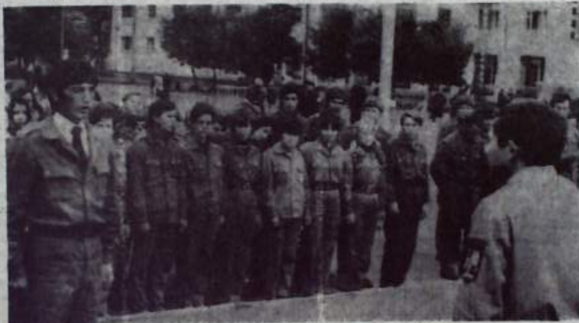
НА СНИМКЕ: торжественная линейка студенческих отрядов.