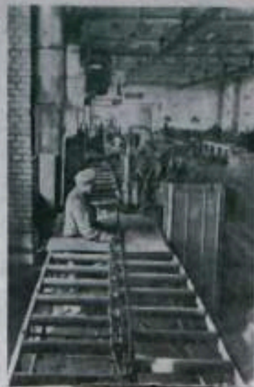
ЛЕНИНГРАД. Более 250 тысяч квадратных метров жилой площади должны быть в этом году достроены комбинатами Главгипроветстроя.

Сейчас мы живем в свободной стране. Если раньше об образовании башкиры только могли мечтать, то я получил семилетнее образование.