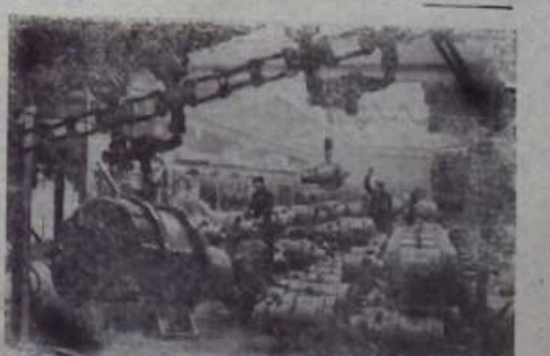
Армянская ССР. На снимке: генераторный цех Армянского электромашинно-строительного завода.

Близок знаменательный день, когда воздвигнутая молодыми патриотами криворожская домна начнет давать чугун.