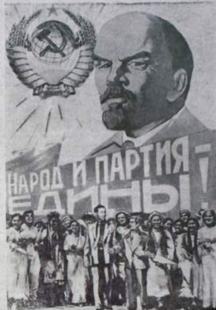
Фотоплакат художника Б. Антонова.