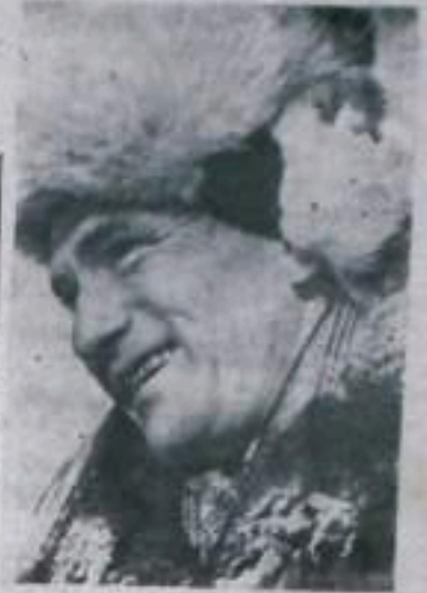
КАМЧАТСКАЯ ОБЛАСТЬ. Большими достижениями отмечают очередным Пленум ЦК КПСС колхозники и сельские работники «Красный партизан» Тульинского района Камчатского национального округа. По сравнению с прошлым годом колхоз увеличил производство мяса в четыре раза, получил молока на 40 процентов больше, чем за соответствующий период прошлого года. В суровых климатических условиях Крайнего Севера ошощеводы вырастили хорошие урожаи капусты и картофеля. Колхоз занесен на областную Доску почета.

Горняки разреза досрочно, 27 ноября выполнили годовую план вскрышных работ, что позволило им 4 декабря завершить план второго года семилетия по добыче угля и дать сверх плана 24,8 тысячи тонн угля.