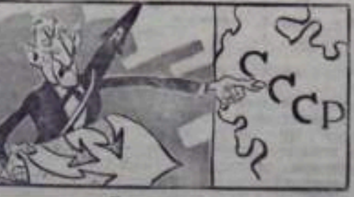
Как аукнется, так и откликнется. Рис. В. Жаринова.