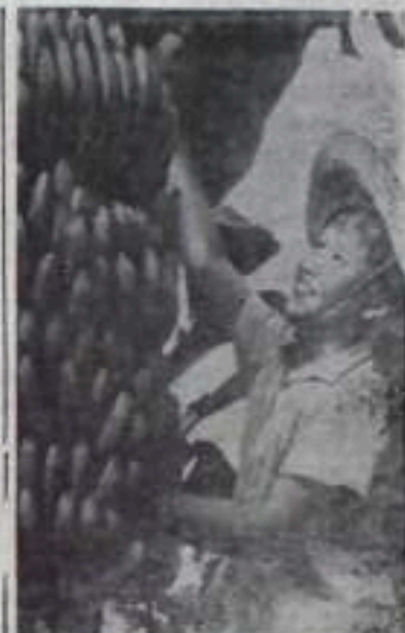
Китайская Народная Республика. Уезд Дуван в провинции Гуандун известен своими обширными банановыми плантациями. В этом году здесь созрел богатый урожай.

Передовые статьи, посвященные дружбе народов Китая и СССР, публикуют и другие китайские газеты.