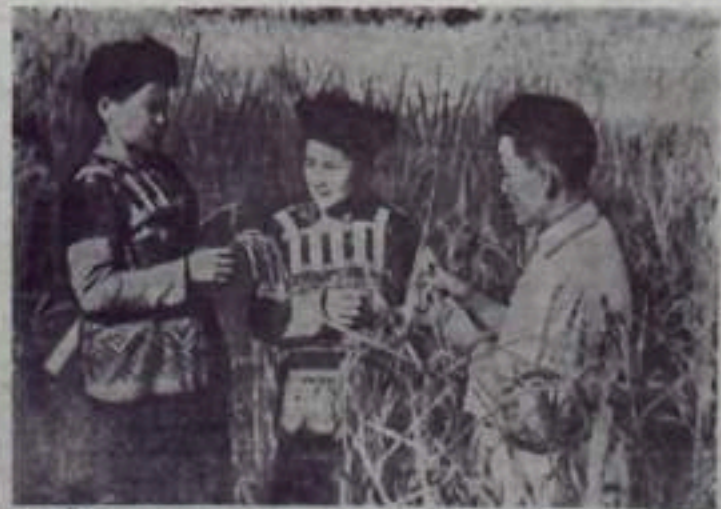
В Демократической Республике Вьетнам развернулась уборка осеннего урожая риса. Выборочный обмолот показывает, что в этом году урожай будет выше, чем в прошлом.

Новый котел можно устанавливать как в горизонтальном, так и в вертикальном положении. В качестве топлива может применяться газ, нефть или угольный порошок. Коэффициент полезного действия котла 90 проц.