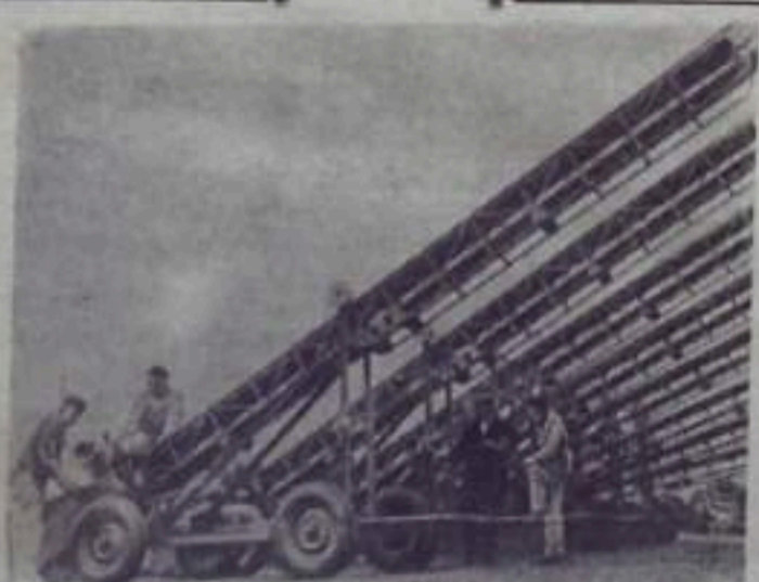
В Чехословацкой Социалистической Республике освоены выпуск новых сельскохозяйственных транспортеров. Они приводятся в движение двухтактным дизелем или по желанию потребителя снабжаются электромотором. Каждый транспортер способен перемещать в минуту до 200 килограммов растений. На снимке: новые транспортеры.

Дело подлежит рассмотрению в нарсуде 1-го участка г. Кумертау.