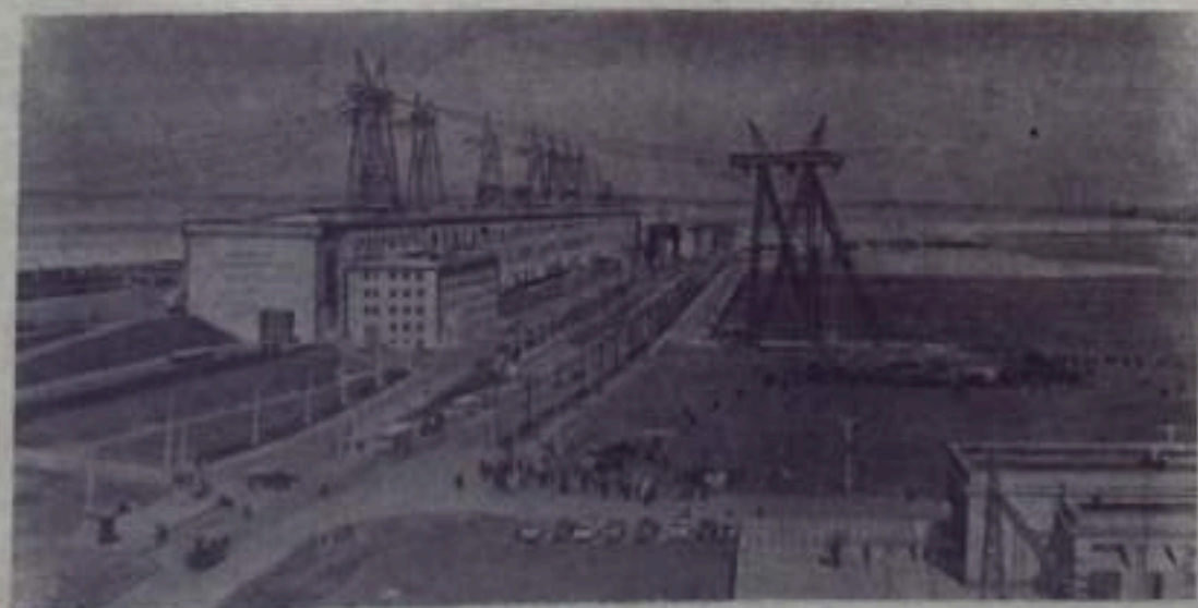
Нуйбышевская область. Общий вид Волжской ГЭС имени В. И. Ленина.

В данный момент приняты конкретные меры для борьбы с браком. Наблюдается местный контроль за выпуском продукции; проведены собрания по снижению брака; проводятся беседы о качестве выпускаемой продукции.