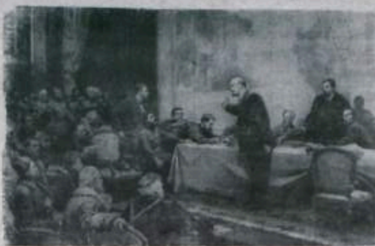
Картина художника Л. А. Шматко «В. И. Ленин у карты ГОЭЛРО» (VIII Всероссийский съезд Советов. Декабрь 1920 года).

Великими успехами коммунистического строительства страна отмечает знаменательную историческую дату—сорокалетие плана ГОЭЛРО.