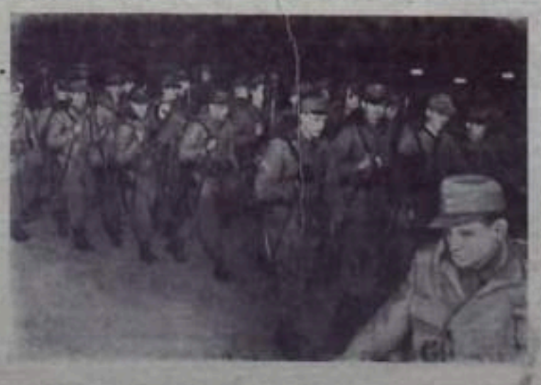
По французским дорогам движется боевые танки с западногерманскими водителями. 35 тысяч солдат бундесвера приближаются во Францию. По улицам французских городов Мушкетеры и Сиссона разгуливают офицеры бундесвера. Они прибили сады в колыбели французского правительства для военных учений.

Как сообщает корреспондент агентства Франс Пресс, в Стэнливилле состоялась подудиторная демонстрация жителей города в знак протеста против подерживаемого властями ООН реакционного иобутовского режима и за освобождение Лумумбы.