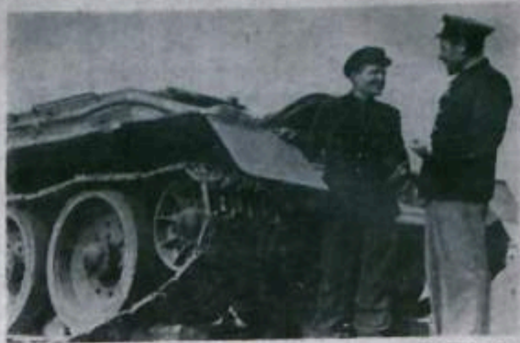
ТАШКЕНТ. Машинный парк восстановительных поездов Ташкентской железной дороги пополнился пятью тяжелыми танками, переданными транспортникам из бронетанковых войск Советской Армии.

С танков сняты орудийные башни и пулеметы. Железнодорожники по-прежнему переоборудовали боевые машины и успешно используют их в качестве тягачей, экскаваторов и подъемно-транспортных механизмов.