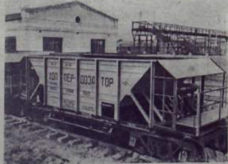
ИСКОВСКАЯ ОБЛАСТЬ. На Великилуковском паровозостроительном заводе освоено производство универсальных специальных вагонов, предназначенных для строителей — путевиков. Универсальность позволяет автоматически, на ходу производить установку мебели и балласта при сооружении или реконструкции железнодорожного пути. Инженерно-технические механизмы полностью исключают ручной труд на тяжелых строительных путевых работах.

В нынешнем году таких вагонов будет выпущено в 10 раз больше, чем первоначально намечалось, а в дальнейшем их производство возрастет еще в 2,5 раза.