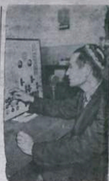
УЗБЕКСКАЯ ССР. На нефтепромысле «Планиция» Ферганского нефтедобывающего объединения работая по автоматизации и диспетчеризации отковки нефти из главных резервуаров в центральный нефтепроход Могария, приводящие в действие насосы, подключены к центральному пульту управления, с которого по показаниям приборов производится пуск и остановка их.