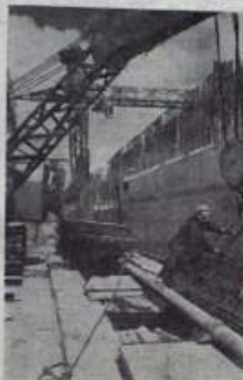
Строительство Воронежской атомной электростанции. Монтаж арматуры.

Июльский (1960 г.) Пленум ЦК КПСС в своем решении еще раз подчеркнул, что резервы и возможности дальнейшего повышения темпов технического про-