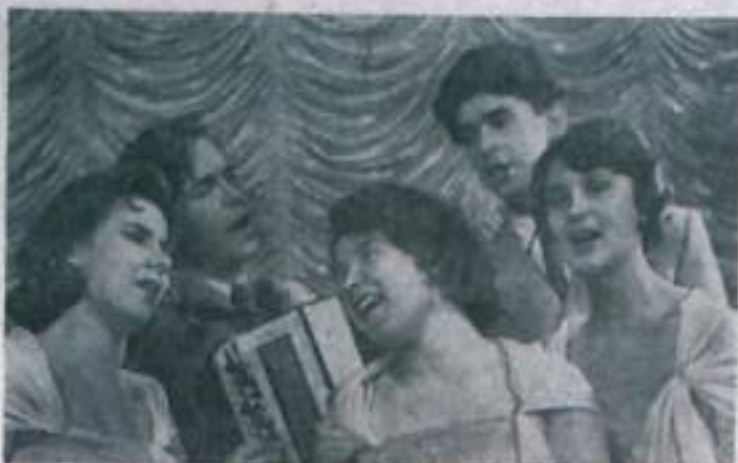
Ярославль. Выступление молодого ансамбля «Гигант» Ярославского швейного завода пользуются немалым успехом. Ансамбль неоднократно выступал в Москве.

К Новому году коллектив готовит большую программу, с которой выступит на новогоднем балу перед работниками швейного завода.