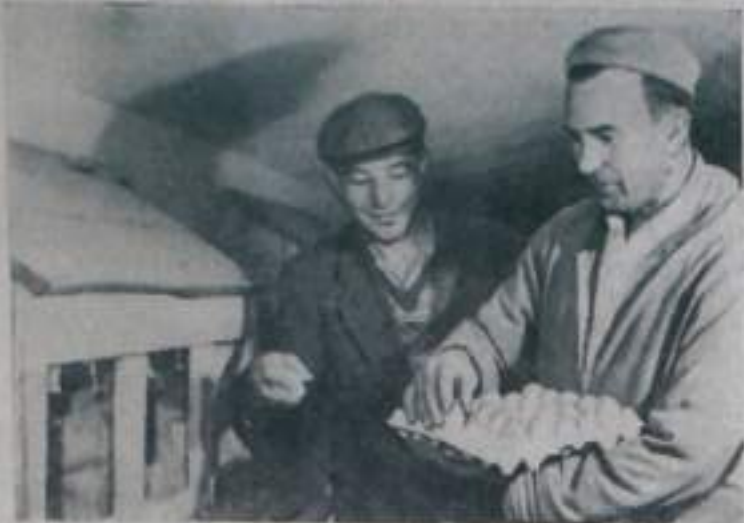
Чехословацкая Социалистическая Республика. Единый сельскохозяйственный кооператив села Полны Косоа. Натренированный район награжден орденом Труда за достижения в развитии хозяйства. Хорошо работают птицеводы, кооперативом досрочно сдано государству свыше 270 тысяч яиц, годовой план перевыполнен.

По желанию членов кооператива хозяйству присвоено название кооператива имени Чехославио-советской дружбы.