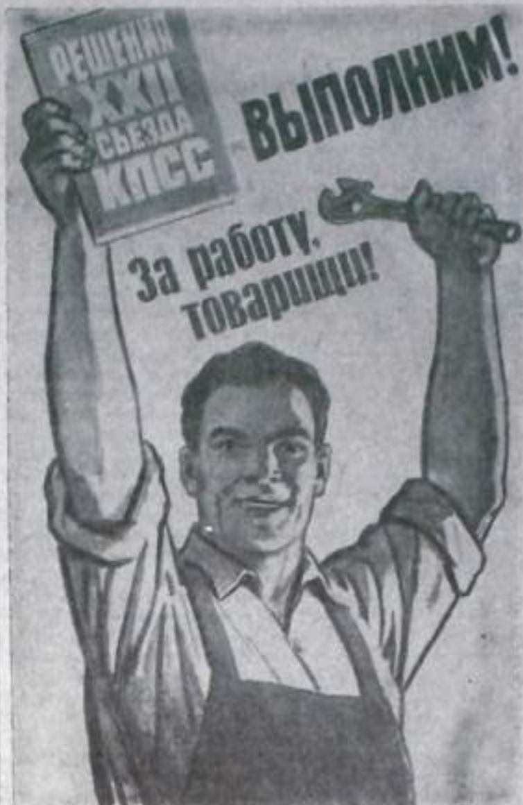
Плакат художника Иванова (ИЗОГИЗ).

Новая доменная печь — точная копия уже существующих на заводе сверхмощных чугуноплавиль-