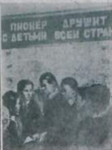
Хабаровский край. В центре Нагайского района — оаза Трофимов на Амуре высятся многоэтажные здания. Это — новы средняя школа № 1. Русские и индийцы — дети рыбаков и олов заготовителей живут здесь дружной, единой семьей.

Н. ГУЩИН, инженер ПТО треста «Кумертаустрой».