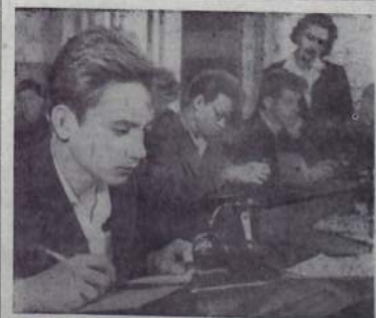
Горный. С этого учебного года единнадцатилетняя школа № 40 начала готовить лаборантов-программистов, операторов-механиков по обслуживанию электронных и счетно-аналитических машин. Наряду с общеобразовательными предметами школьники будут изучать программирование, радиотехнику, электротехнику. Учащиеся ознакомятся также с методом приближенных вычислений, с работой на арифмометрах.

А. ЕЖИКОВА, инженер отдела труда и зарплат комбината «Вашкируголь».