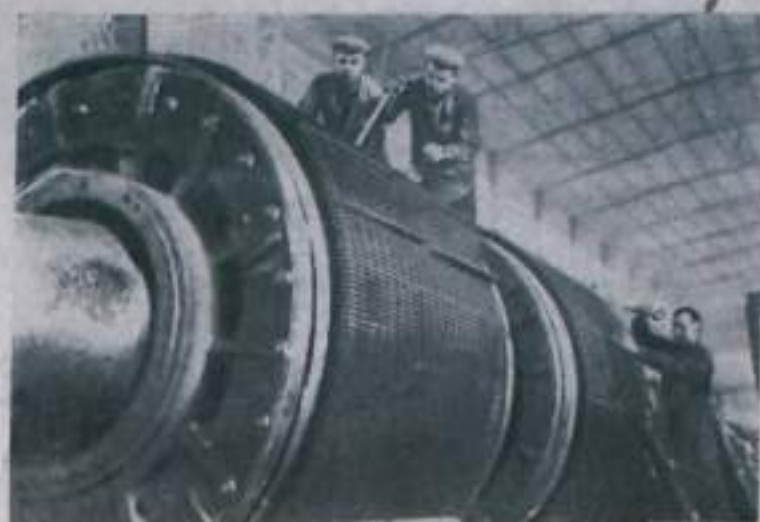
Коллектив харьковского завода «Электротрактор» имени В. И. Ленина заканчивает сборку двух одноименных электрических двигателей общей мощностью 13.200 киловатт для Ждановского металлургического завода имени Ильича.