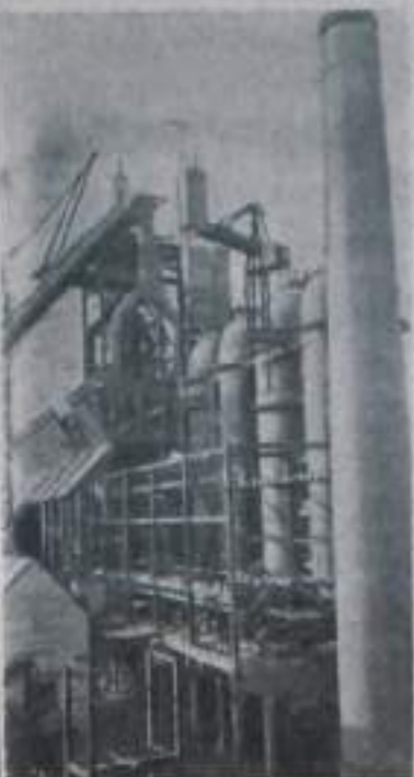
На Новолипецком металлургическом заводе сооружается домик. Она должна вступить в строй действующих в конце этого года.

На снимке: строящийся домик.