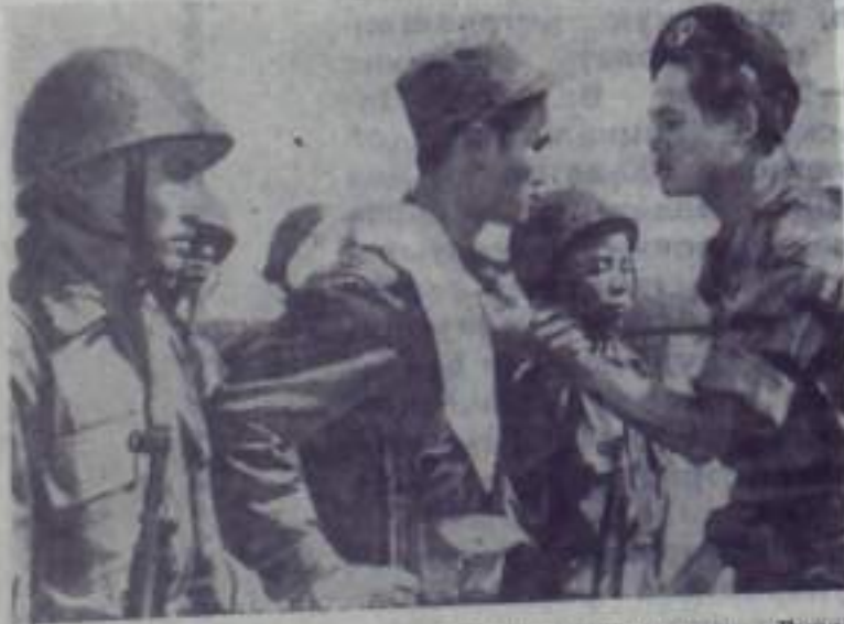
Кадр из вьетнамского художественного кинофильма «Бури поднимается». Этот фильм рассказывает о борьбе вьетнамских патриотов.