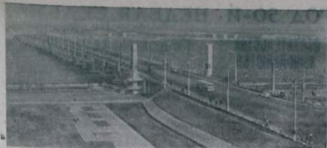
Замечательный подарок — получили жители Днепропетровска. Здесь вступил в эксплуатацию новый мост через Днепр.