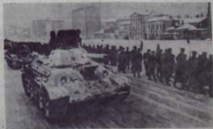
На сцене: в те дни на улицах Москвы. Новые боевые резервы отправляются на фронт.

Родина высоко оценила героизм и мужество защитников столицы. Москве присвоено почетное звание города-героя, многие воины и труженники предприятий награждены орденами и медалями.