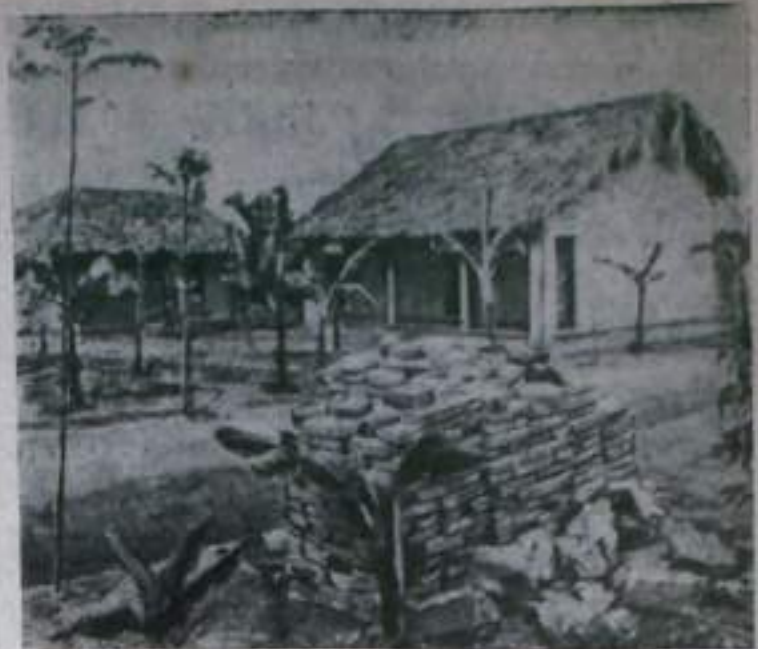
На снимке: в деревне Фуха.