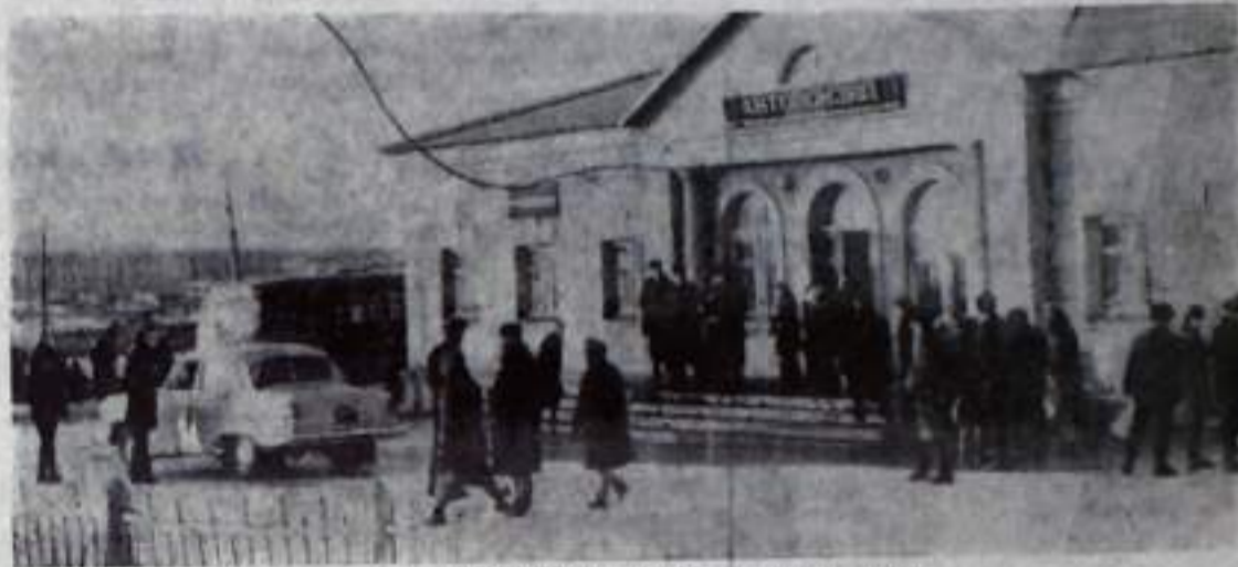
НА СНИМКЕ: автовокзал нашего города.