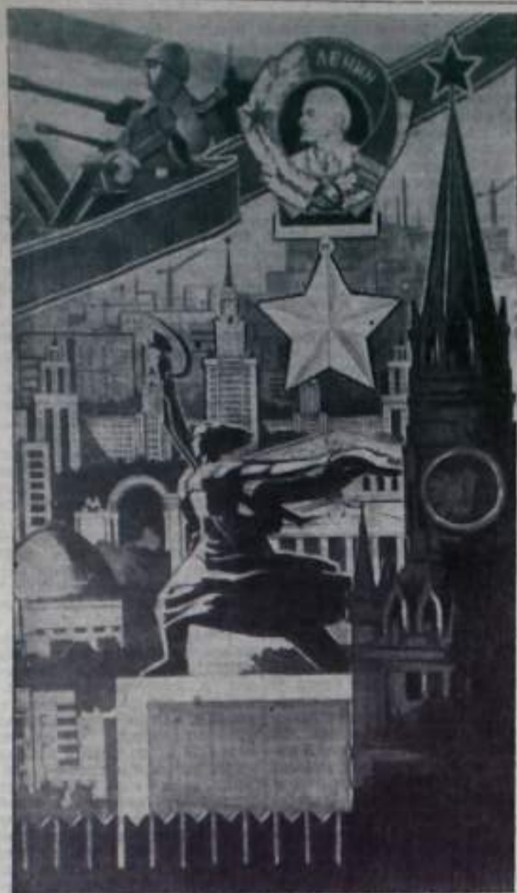
Всей великой страны светлица, Городам всей земли пример,— это— наша Москва-столица, сердце СССР!