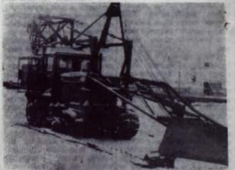
На снимке: сломанный трактор.