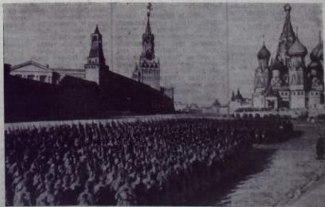
НА СНИМКЕ: защитники столицы направляются на фронт.

Умножая славу своего родного города, москвичи своим трудом вносят большой вклад в общенародное дело борьбы за коммунизм.