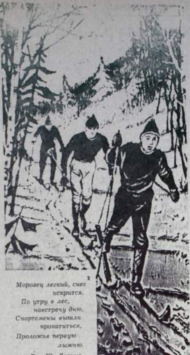
Морозец легкий, снег искрится. По утрам в лес, навстречу дню, Спортсмены вышли прокатиться, Проложили первую лыжню. Рис Ю. Ларина.