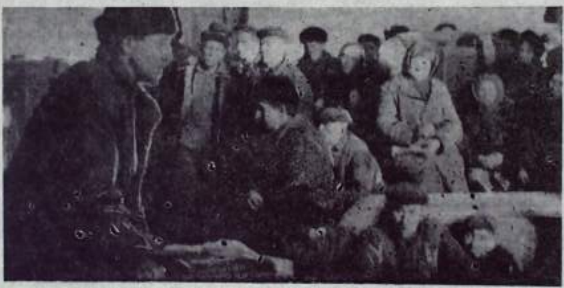
На снимке: митинг в механическом цехе депо погрузочно-транспортного управления.