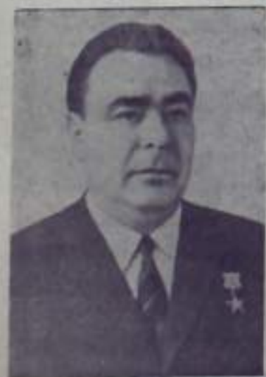
19 декабря 1966 года исполняется 60 лет со дня рождения Генерального секретаря ЦК КПСС Леонида Ильича Брежнева.