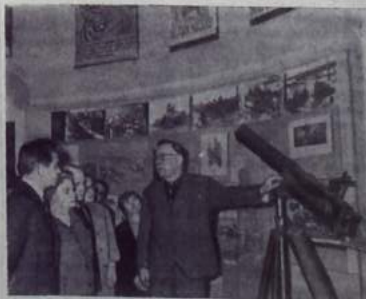
На снимке: в одном из залов выставки.

Москва. В Государственном историческом музее открылась выставка, посвященная 25-летию разгрома немецких фашистов под Москвой.