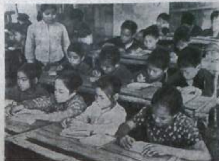
Лаос. Во всех районах, контролируемых патристическими силами Нео Лао Хак Сат, налажено школьное обучение детей лаотинцев.

ных утвердило план работы общества на 1969 год. В нем предусмотрено обмен высококлассными специалистами, лекторами, выставками, артистами, делегациями, туристическими группами. Ряд мероприятий планируется в связи с предстоящим празднованием 100-летия со дня рождения В. И. Ленина. Общество усилит свою активность в деле изучения русского языка в Финляндии.