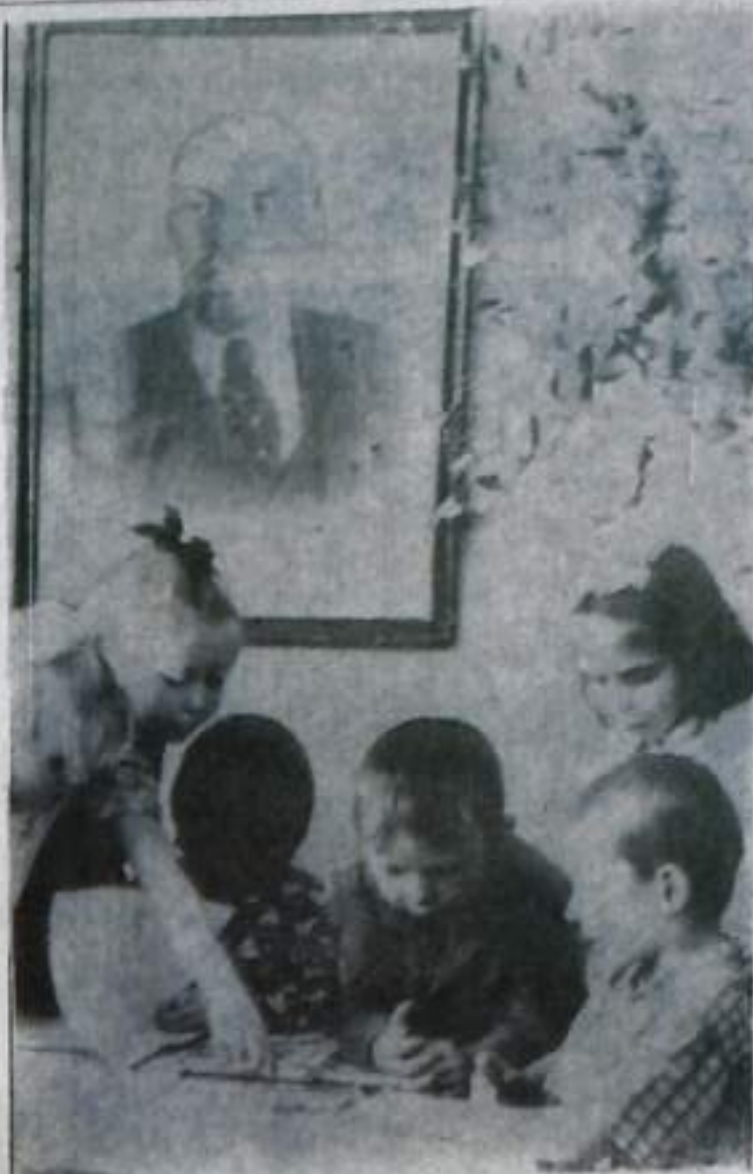
На снимке: в детском саду подхожа «Дружба» дети читают о Ленине и думают о нем.