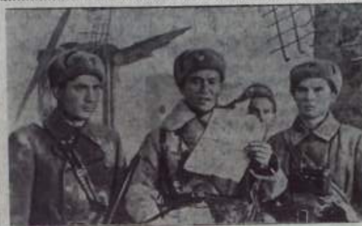
Новый художественный фильм «За нами Москва», созданный на киностудии «Казахфильм», посвящен подвигу Гвардейской дивизии имени Панфилова.

Сценарий написан В. Соловьевым и М. Бегалиным по мотивам книг и материалов участника событий Б. Момыш-Улы.