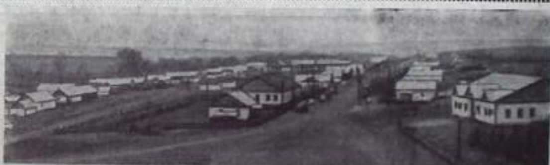
Оренбургская область. Более двухсот тысяч рублей выделяет ежегодно на жилищное и культурно-бытовое строительство колхоз имени Фрунзе Новосергиевского района. Новые школы-интернаты, три клуба, баня, больница, детские ясли-сад появились на улицах

села. Для специалистов построено 34 четырехкомнатных дома.