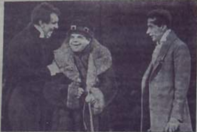
Москва. Центральный театр Советской Армии поставил новый спектакль «Тайное общество» — драму из времен декабристов. Авторы пьесы — И. Мамонин и Г. Шпалников.

Меняется однокомнатная квартира со всеми удобствами в г. Светлом Оренбургской обл. на равноценную в г. Кумертау. Обращаться по адресу: г. Кумертау, 1-й пер. К. Маркса, 1, Гривичной Марии.