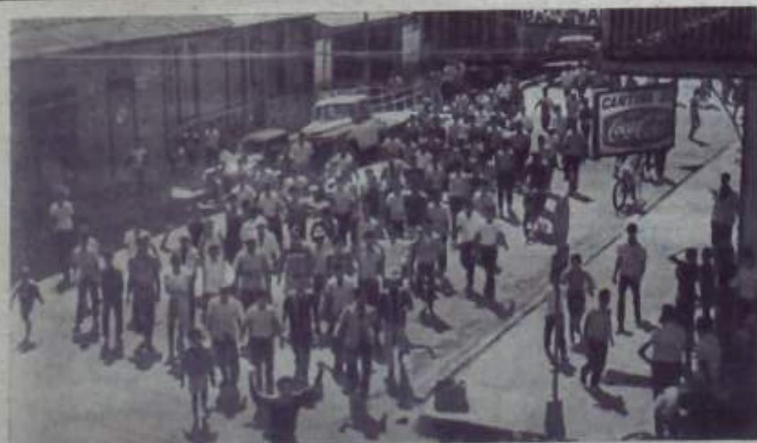
Коста-Рика. По всей стране ширится движение трудящихся против тяжелого условия жизни, непрерывного роста дорожных цен, за повышение заработной платы. На снимке: трудящиеся на одной из улиц самого большого города страны Пуэрто-Лимона в дни забастовки. Они требуют повышения заработной платы и полной оплаты за отработанные часы при погрузке бананов на корабль американской компании «Стандарт Фрут Компани».

бастовки. Они требуют повышения заработной платы и полной оплаты за отработанные часы при погрузке бананов на корабль американской компании «Стандарт Фрут Компани».