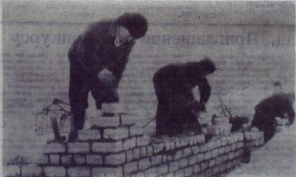
Разрастается город Кумертау. Новые здания одно за другим дополняют архитектурный ансамбль микрорайона. На снимке вы видите колонщиков брига-

Сейчас артозавод им. Лихачева получает в 8 раз меньше рекламаций, чем в 1965 году. Заводцы борются за присвоение заводского «аттестата качества», который присуждается при отсутствии брака и рекламаций.