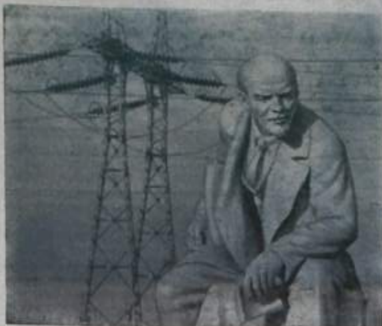
«Коммунизм — это есть Советская власть плюс элек- трификация всей страны. В. И. Ленин»

На снимке: памятник В. И. Ленину на Центральной усадьбе совхоза имени X-летия Октября (Московская область).