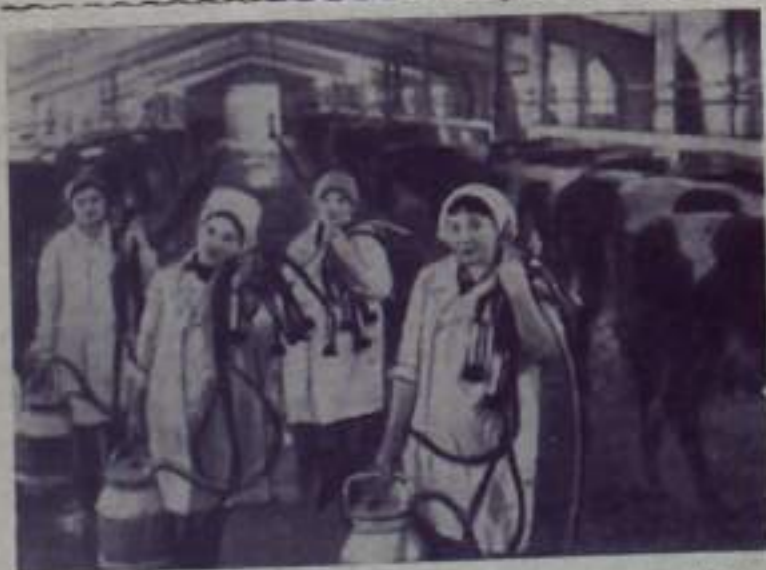
Марийская АССР. Комсомольско-молодежный коллектив Манайнучинской механизированной фермы совхоза «Алексеевский» взял обязательство получить больше от каждой коровы на 500 килограммов молока больше, чем в прошлом году. Завершив годовой план, доярки сейчас успешно выполняют обязательство.

Кумертауский совхоз, отделение «Горный ключ».