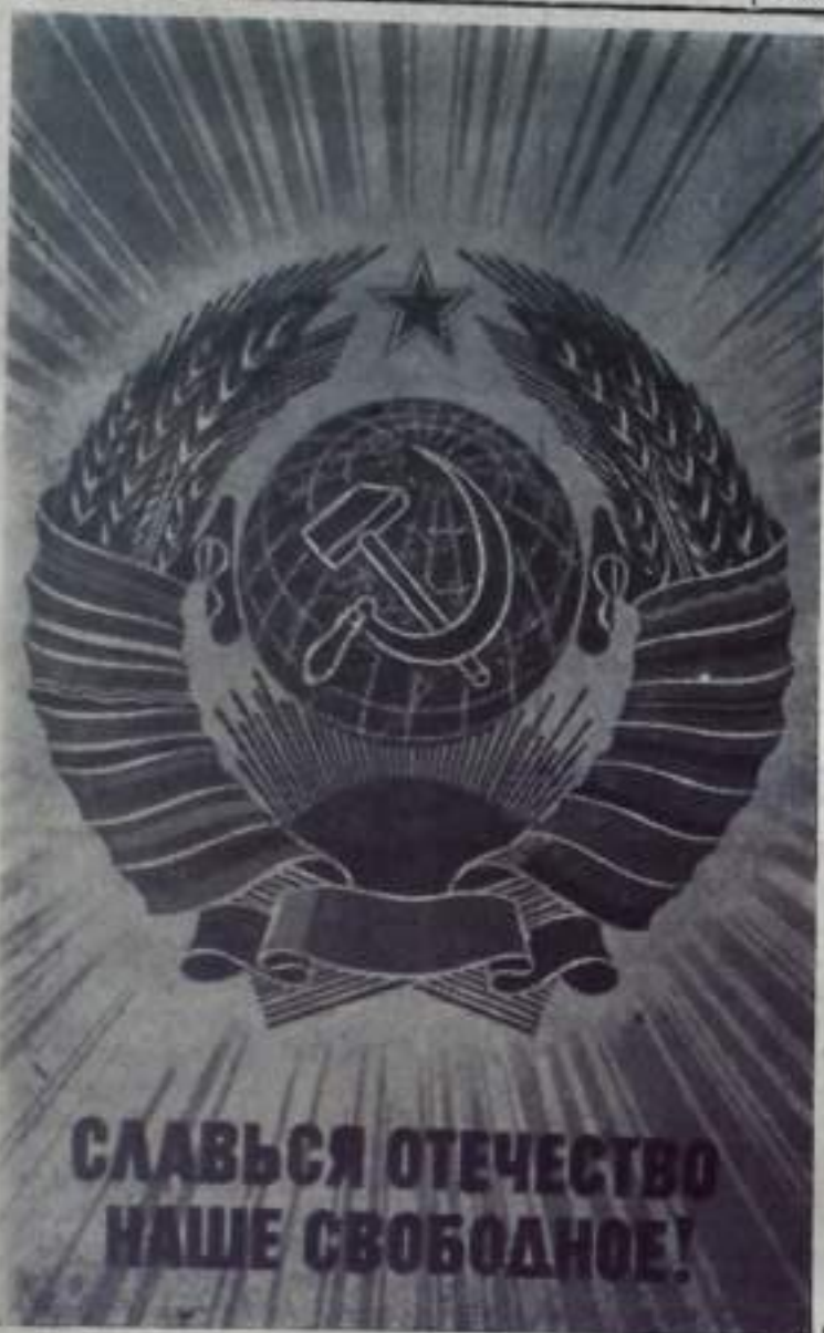
Плакат художника В. Викторова.