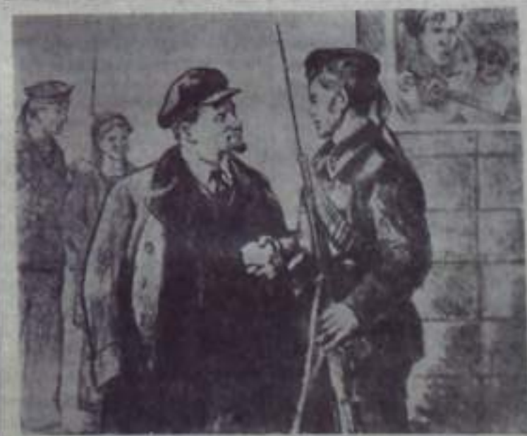
Рисунок художника Н. Н. Жукова «Спасибо медикам!».

За этот же период проведено 20 заседаний исполкома райсовета, где рассмотрено около двухсот различных вопросов.