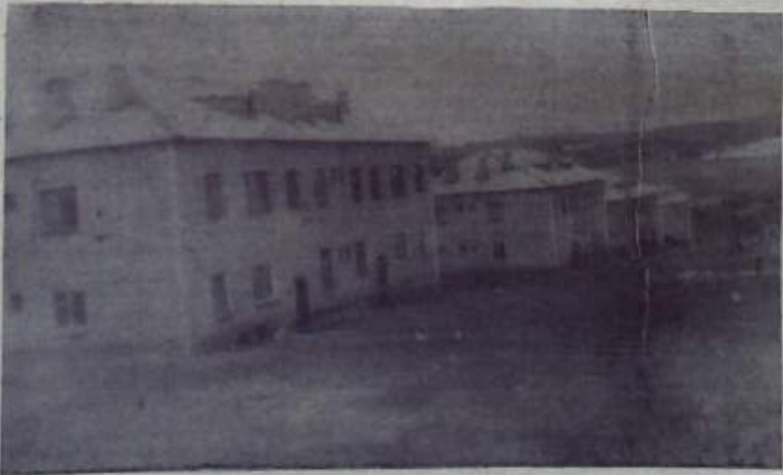
На снимке: вид центральной усадьбы Куюргазинского совхоза. На переднем плане благоустроенные многоквартирные дома, в которых жи-

вут рабочие, специалисты сельского хозяйства, учителя, медицинские работники.