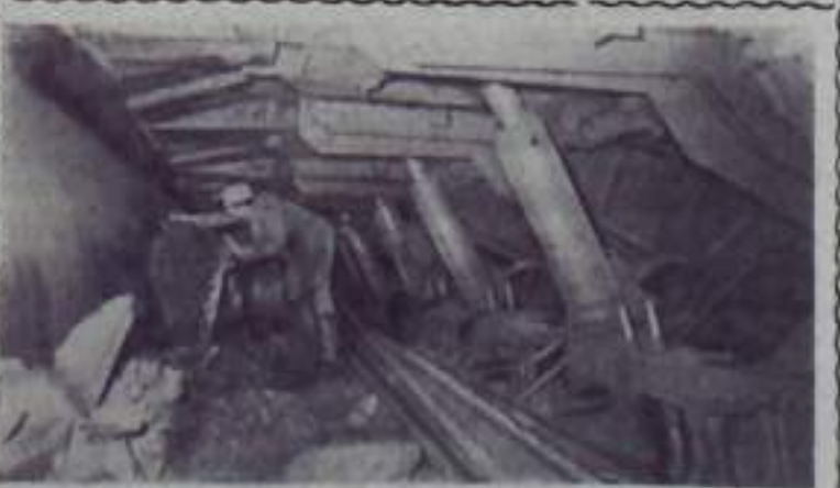
Кемеровская область. Шахты Томь-Усинского рудника реконструируются, оснащаются новыми высокопроизводительными механизмами, угольными комплексами.

В принятом конференцией постановлении намечены конкретные мероприятия по ликвидации вскрытых недостатков. В частности, конференция обращается к руководству «Главбастроя» с просьбой о выделении средств на строительство профилактория, клуба строителей и других культурно-бытовых объектов.