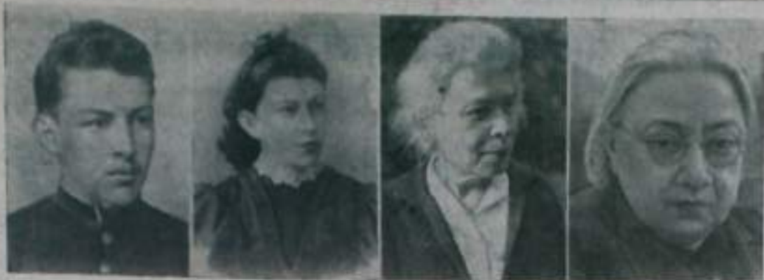
Дмитрий Ильич Ульянов (1874—1943). Снимок сделан в Самаре. Брат В. И. Ленина. Старый член партии, по профессии врач. Участвовал в революционном движении с 1895 года. Анна Ильинична Ульянова-Елизарова (1864—1935). Сестра В. И. Ленина. Старый член КПСС. Принимала активное участие в революционном движении с 1886 года. Мария Ильинична Ульянова (1878—1937). Сестра В. И. Ленина. Старый деятель КПСС. С 1899 года — профессиональный революционер.

неоднократно подвергалась царским притеснениям: арестам, тюремному заключению и ссылке.