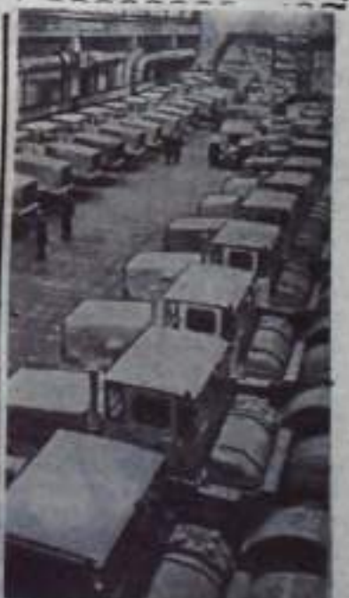
На сентябрьском Пленуме ЦК КПСС, посвященном вопросам сельского хозяйства, Генеральный секретарь ЦК КПСС Л. Н. Брежнев сказал: «В ближайшие годы надо расширять также выпуск на Ленинградском Кировском заводе мощных колесных тракторов К-700, которые хорошо зарекомендовали себя, особенно в степных районах». Кировцы восприняли эти слова, как программу действий. На снимке: тракторы К-700, готовые к отправке.

БЕЛГОРОД. На Стойленский рудник Курганской магнитной аномалии доставлены из Чехословакии последние узлы и детали гигантского роторного экскаватора. Для их перевозки потребовалось более ста вагонов и платформ. За час стальной «землекоп» может переработать 3500 кубометров грунта. (ТАСС)