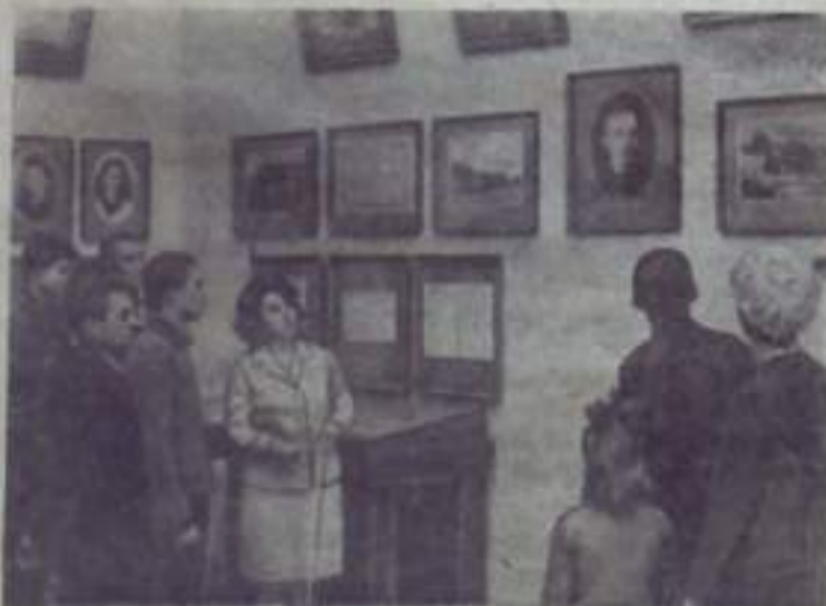
МОСКВА. Центральный музей В. И. Ленина после капитального ремонта и обновления экспозиции снова распахнул свои двери перед москвичами и гостями столицы.

В залах впервые представлена около 500 новых ленинских, партийных документов и других материалов.