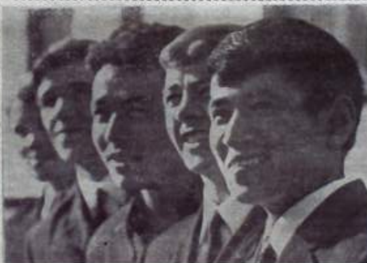
Сотни колхозных стипендиатов учатся в институтах, техникумах и училищах Оренбургской области. Получив специальность, они вернутся в родные хозяйства.

И. ПАЧУЕВ, председатель районного охотообщества.