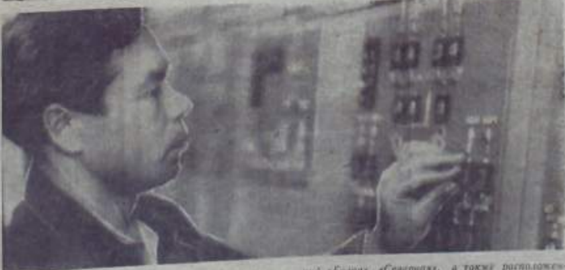
Третий год в Кумертауских электросетях действует телеуправление. С его помощью диспетчер может включать в работу или отключать любую электропередачу, трансформаторы подстанций «Белая», «Северная», а также расположенных в Мелурке и Маячном.