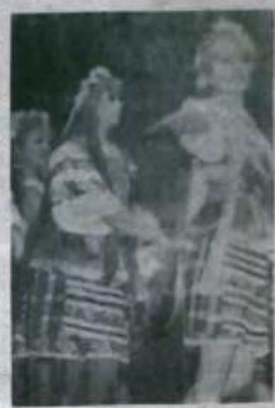
На снимках: танцевальные номера в исполнении самодеятельных артистов Дворца культуры угольщиков. Слева танец «Гульмаира», сверху — сцена из украинской сюиты.