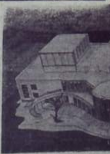
МОСКВА. В разделе «Строительство» ВДНХ СССР открыта тематическая выставка «Сельское строительство в СССР». Многие численные макеты и фотографии рассказывают о жилищном, бытовом и производственном строительстве на селе.