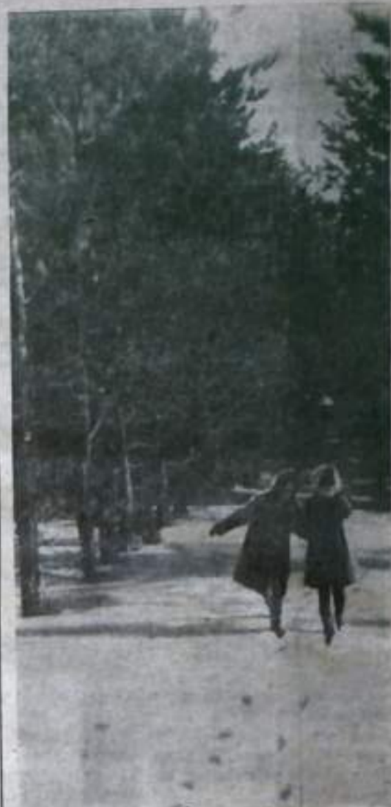
Снег не горит, но лужи возможны. Поэтому в лес шли осторожно. Чтоб избежать непредвиденных бед и возвращаться следом в след.

За справками обращаться в отдел кадров ОРСа или к уполномоченному по использованию трудовых ресурсов — ул. Паровая, 38.