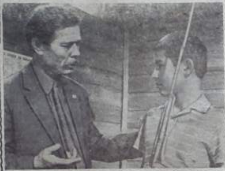
Беседа на международные темы