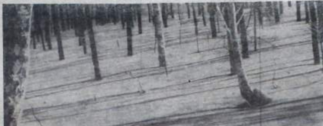
В зимнем лесу.