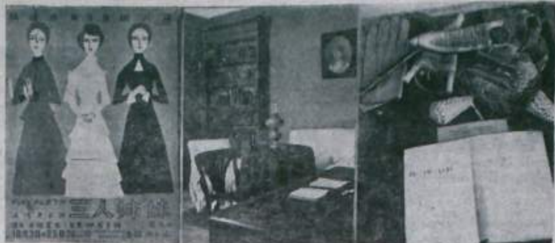
МОСКВА. В доме-музее А. П. Чехова на Седово-Кудринской улице, 61, где с 1886 по 1890 год жил великий русский писатель, открыта новая экспозиция. На снимках (слева направо): афиша спектакля «Три сестры», поставленного в Японии.