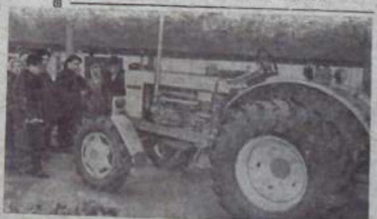
МОСКВА. На Выставке достижений народного хозяйства СССР открыта большая экспозиция сельскохозяйственной техники. Здесь представлено свыше 400 машин, позволяющих механизировать многие производственные процессы в сельском хозяйстве. На СНИМАКЕ посетители осматривают новый трактор Липецкого завода Т-40 АН повышенной проходимости с ведущими передними мостом. Трактор предназначен для работы с тяжелыми и прицепными машинами и орудиями в условиях холмистой местности и на склонах. Т-40 АН оснащен двигателями в 50 лошадиных сил и имеет 6 передач вперед и одну — назад.

Собрание обсудило второй вопрос повестки дня: выбор комиссии по подработке Устава колхоза. В состав этого органа вошли руководители, специалисты, ветераны труда и передовики колхозного производства. Всего избрано 20 человек. Единогласно утвержден список представителей колхоза на районное собрание послатца колхозной деревни, которое состоялось 24 декабря.