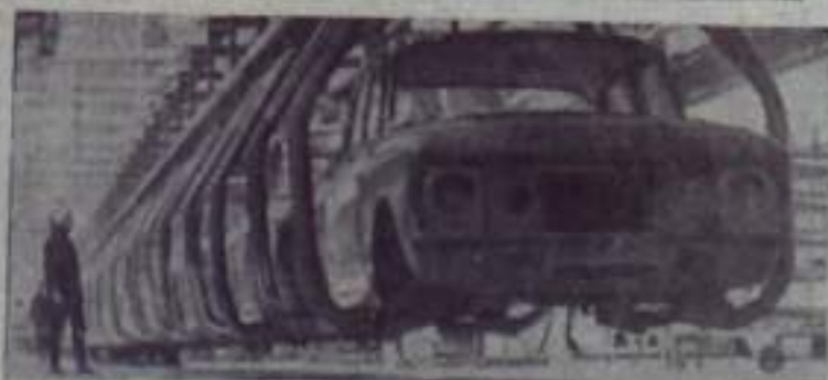
На Ижевском автомобильном заводе вышла первая очередь главного конвейера по сборке автомобилей «Москвич-412» (на снимке)

Наши животноводы приложат максимум усилий, чтобы еще полнее использовать имеющиеся резервы и обеспечить выполнение обязательств, принятых в честь XXIV съезда партии.