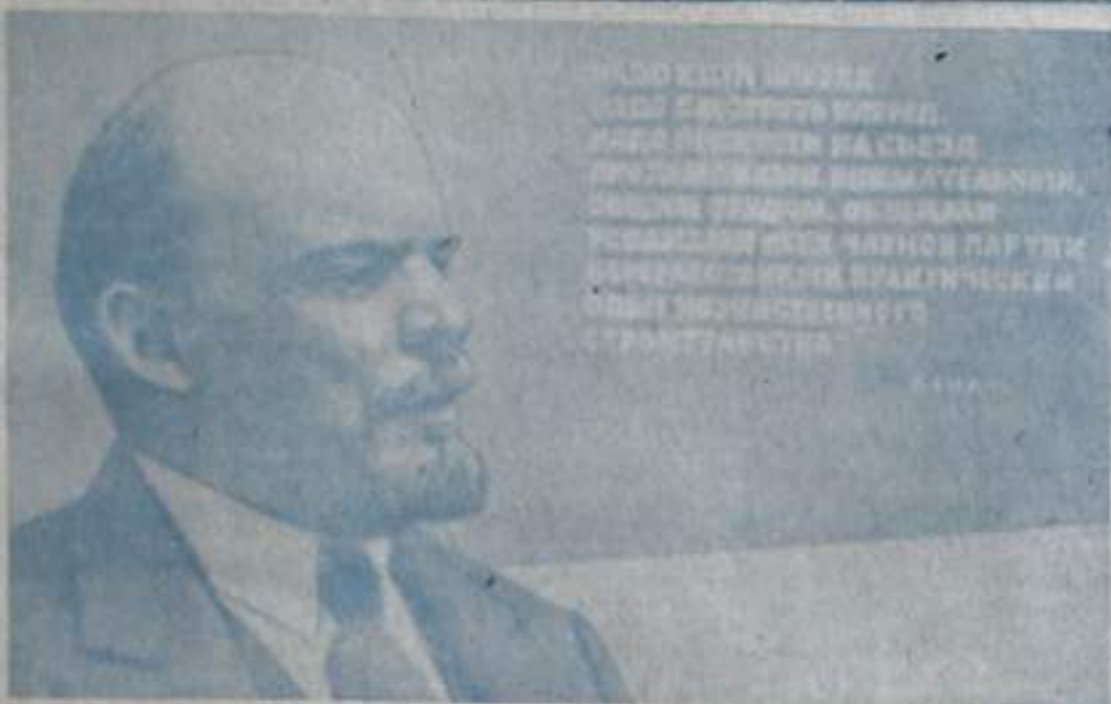
Плакаты художника Б. Березовского, вышедший из мастерской «Изобразительное искусство»