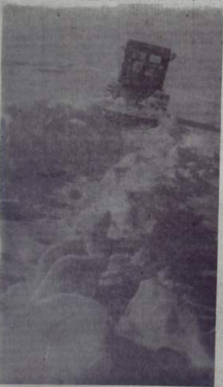
На снимке: задержание снега на полях колхоза им. Куйбышева.