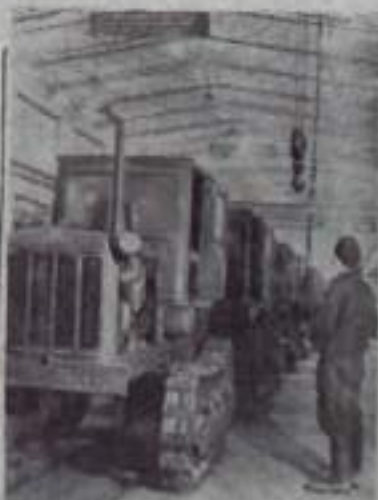
Винницкая область. В мастерской Барского районного объединения «Сельхозтехника» ремонтируют тракторы «Т-38» водятся круглогодично прогрессивными методами. Соревнуясь за достойную встречу XXIV съезда КПСС, коллектив облизал годовой план ремонта вывозить досрочно — к 25 декабря. На снимке: линия сборки тракторов.

секретарь парткома колхоза «Путь к коммунизму».