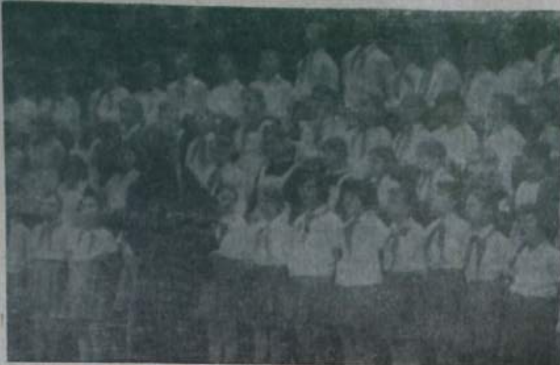
На сцене: концерт художественной самодеятельности для изобретателей во Дворце культуры уральщиков. Выступают хор детской музыкальной школы № 2.