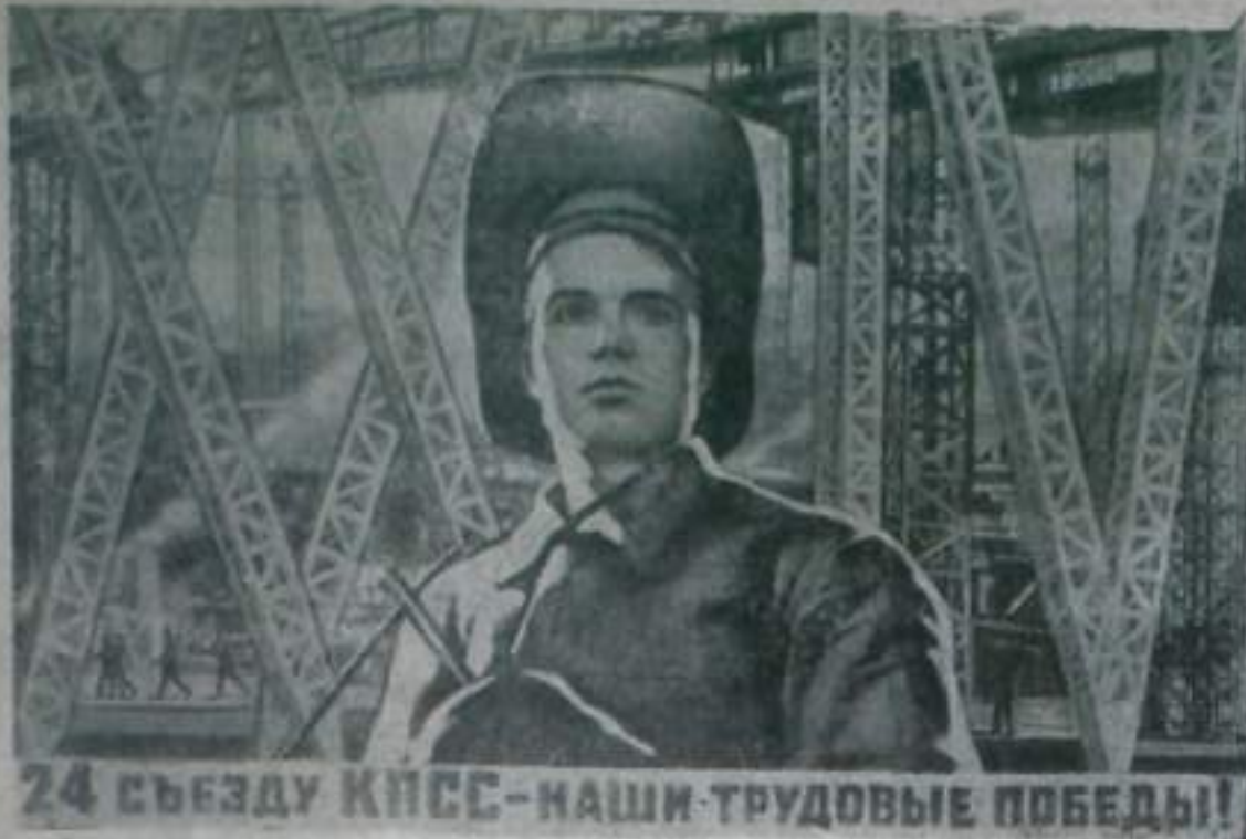
24 СЪЕЗДУ КПСС—НАШИ ТРУДОВЫЕ ПОБЕДЫ!

Плакат художника В. Корецкого (издательство «Изобразительное искусство»).