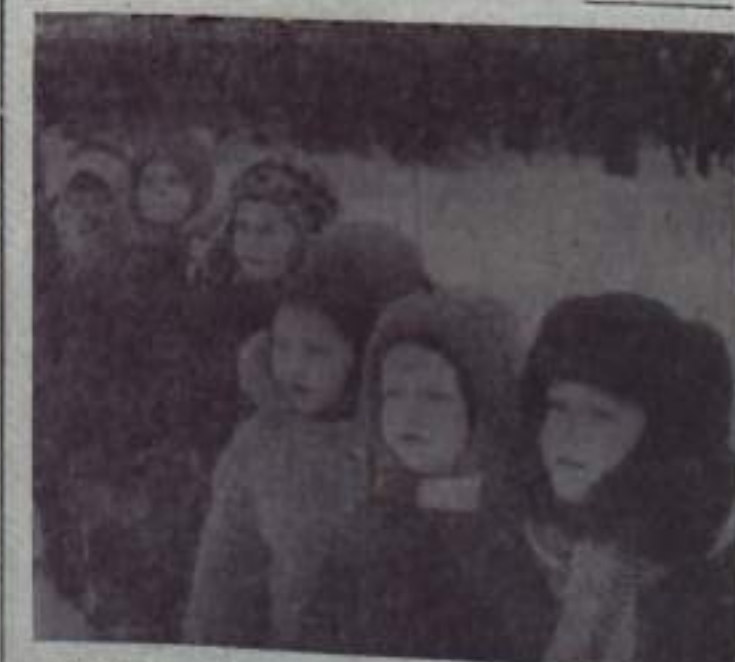
Выгляните на радостные лица ребятшек из детского сада № 3 р. л. Ермолаево, записанных на снимке, и вам станет словками веселее. За детство счастливое наше Спасибо, родная страна!