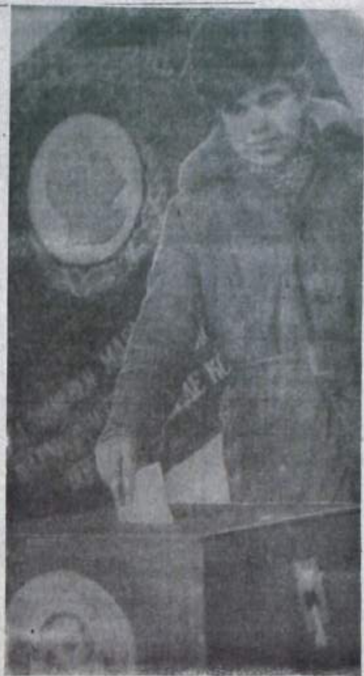
На снимке: на Гафурьевском избирательном участке.