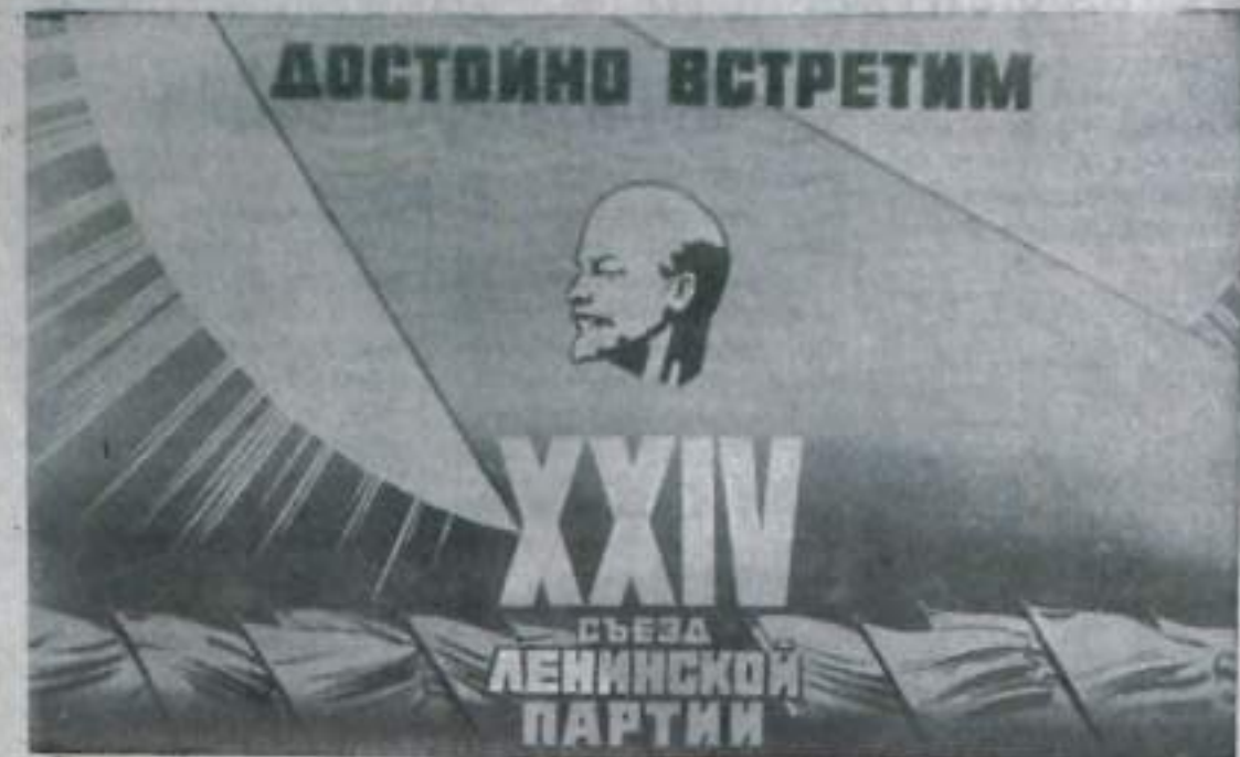
Достоинно встретим XXIV съезд Ленинской партии. Плакат художника В. Викторова (издательство «Изобразительное искусство»).