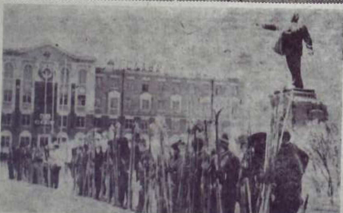
14-го декабря с площади Советов стартовала комсомольско-молодежная звездно-лыжная эстафета, посвященная 50-летию образования СССР. По четырем маршрутам отправились ее участники: лыжники горномеханического техникума, педагогического училища, вертолетного завода и комбината «Башкируголь». Они побывают в хо-

Он нежный, грустный, добрый, По-своему ласкает. Он малый, белый-белый, Так чудно обнимает. Люблю тебя я, снег мой, Ложись мне на ресницы, А детям паров Не позабудь присниться.