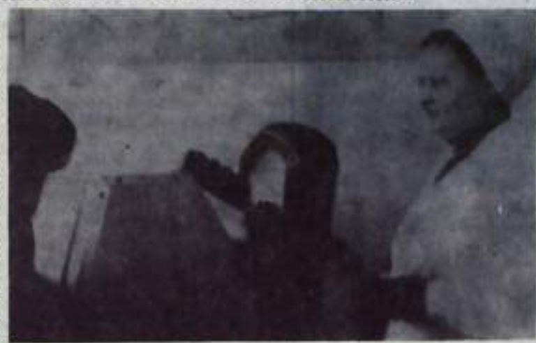
Беседа на международные темы