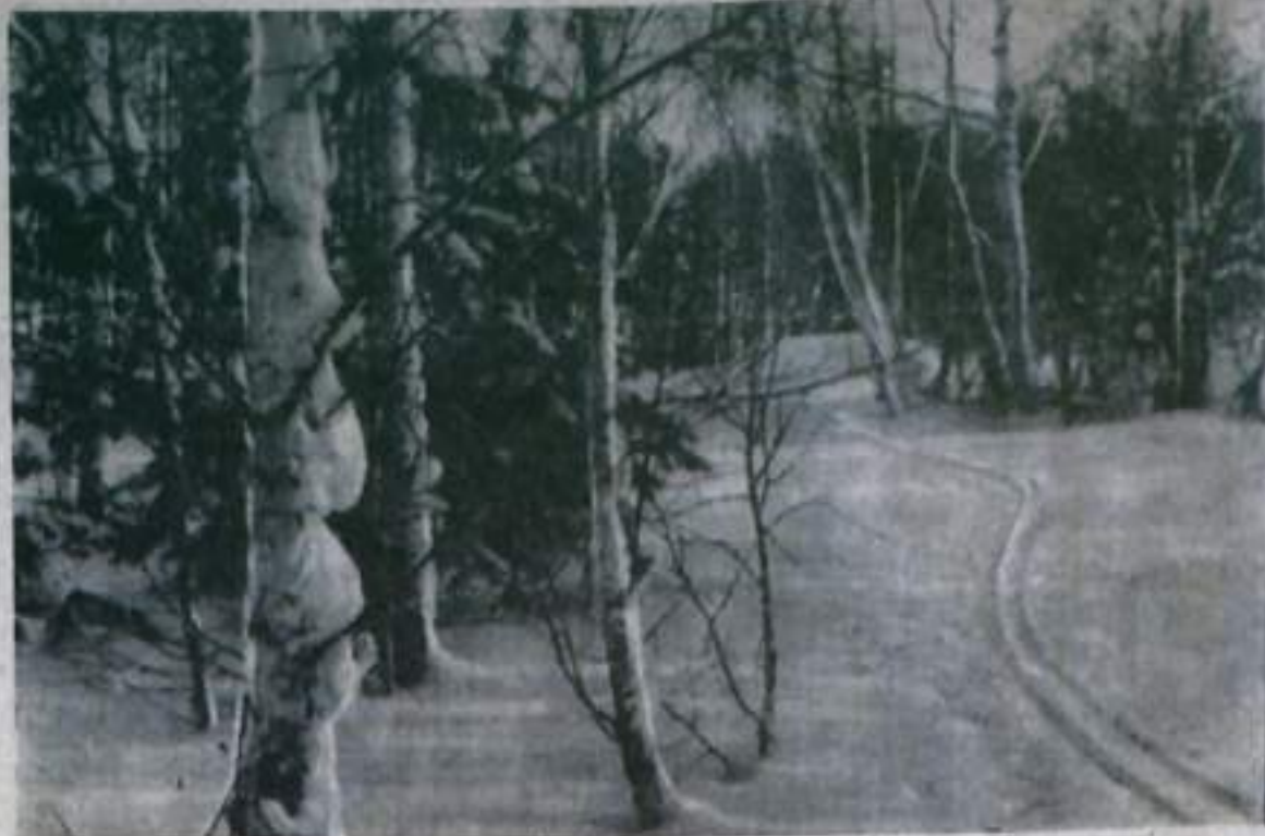
В окрестностях Кумертау.