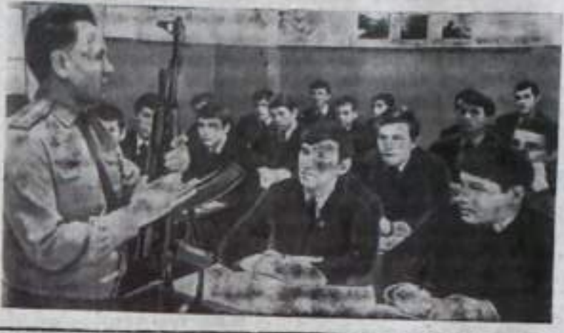
Беседа с читателем

Башкирская АССР. В средние профтехучилище № 26 города Салавата получают социальности: буковые аппаратуры, электрослесари, машинисты компрессоров. Учители хорошо оснащены необходимым оборудованием и пособиями, учебно-воспитательную практику юности и девушки проходят на комбинате. На снимке: идут занятия по начальной военной подготовке.