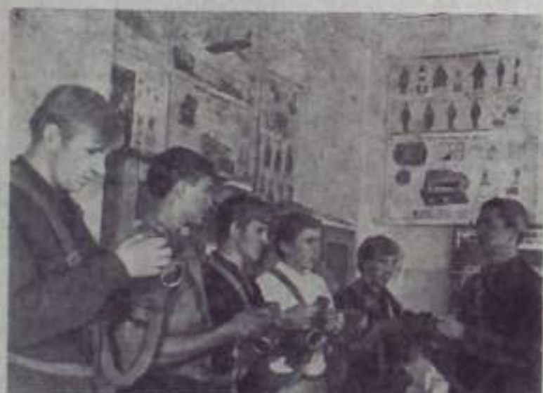
Минская область. Интересно организована работа с допризывниками из Борисовской фабрики шпатель. Здесь создан военно-учебный пункт с хорошо оборудованным классом, тиром, небольшим кинозалом. Юноши изучают автомобильное дело, знакомятся со средствами противотанковой защиты, следят за новизной ГТО. На стенде есть книга Почта. В нее записаны фамилии бывших работников фабрики, а ныне солдат, отличившихся по службе. На стенке — картина запаса М. Ю. Акчурина изобретает допризывников с устройством противотанка.