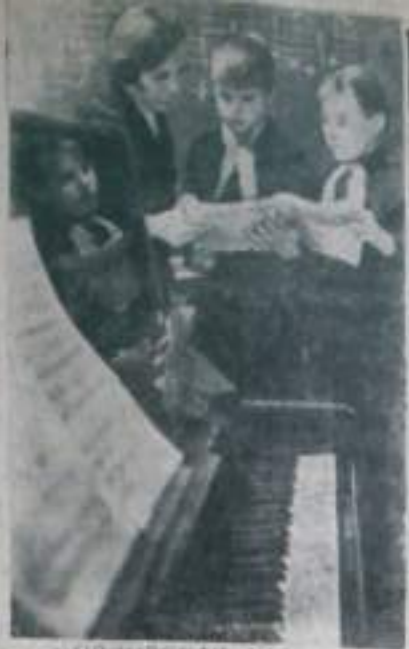
МОРДОВСКАЯ АССР. В селе Алаши Атяшевского района работает мужицкая школа. После пятидесяти лет полководца, капитана, механизатора колхоза имени М. Горького обучаются здесь юные и взрослые.