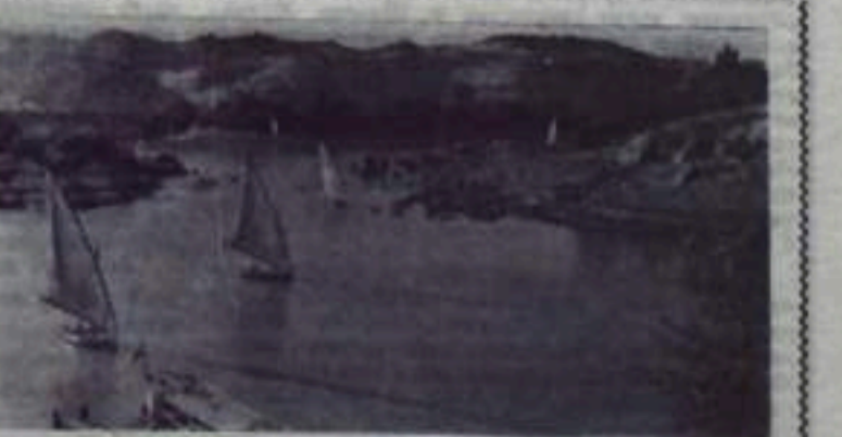
Объединенная Арабская Республика. В Асуане открыты работы на строительстве высокой Асуанской плотины, которая сооружается по разработанным советскими экспертами проекту, в сотрудничестве и с экономической и технической помощью Советского Союза. Она позволит за счет орошения и освоения новых земель увеличить национальный доход страны на 35 процентов. На снимке: река Нил у Асуана.