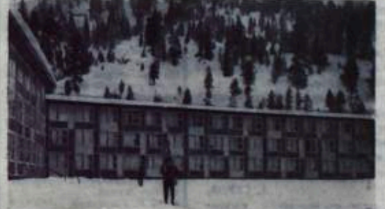
К предстоящим зимним Олимпийским играм в Сяо Вэли (США).