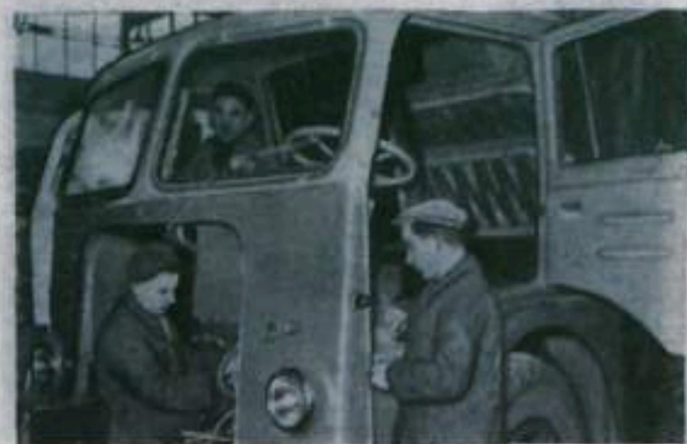
Польская Народная Республика. Автозавод в Эльче близ Вроцлава начал выпускать восьмитонные грузовые машины «Зубр». Автомобиль может двигаться со скоростью 80 километров в час. Он сконструирован польскими инженерами. На снимке: монтаж грузовика «Зубр».