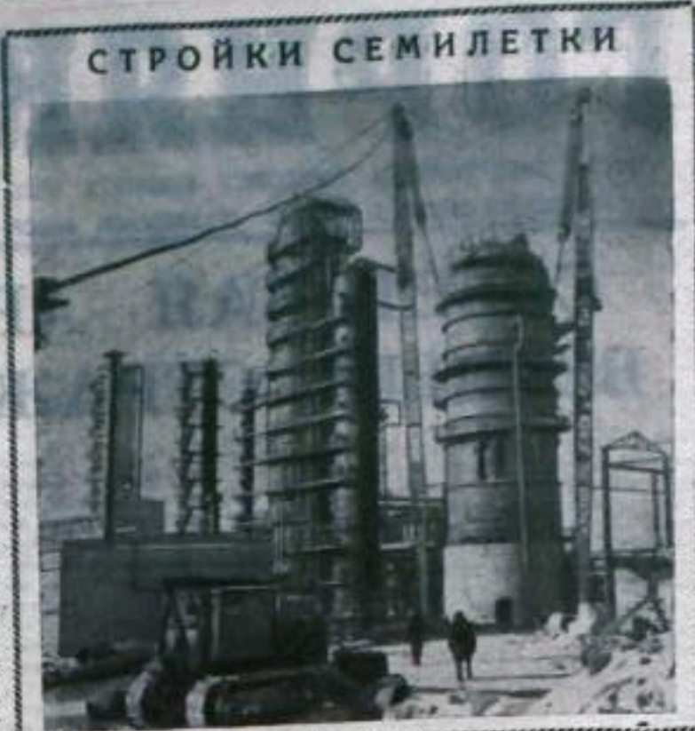
Куйбышевская область. На Новокуйбышевском нефтеперерабатывающем заводе сооружается крупная атмосферно-вакуумная установка. В этом году она войдет в строй действующих.