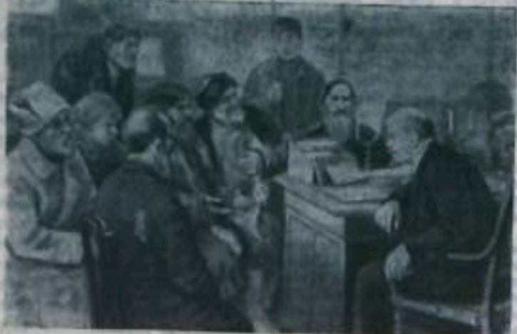
В. И. Ленин беседует с крестьянами. (С картины худ. М. Соколова)