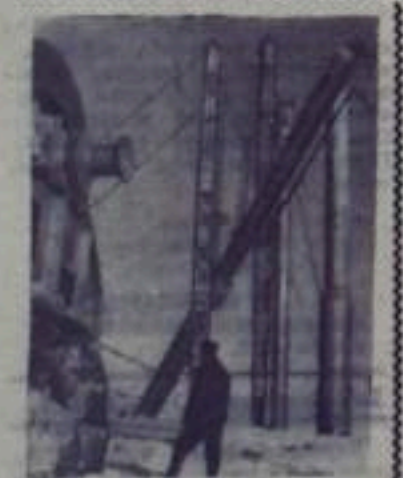
Ярославль. На строительстве Ново-Ярославского нефтеперерабатывающего завода начался период главных работ. Ведется монтаж технологического оборудования. Уже смонтировано несколько арктических печей, установлено много другого оборудования. Началась установка вертикальных аппаратов термического крекинга. Собрано свыше 50 металлических резервуаров для полуфабрикатов и готовой продукции, проложены трубопроводы длиной в несколько десятков километров.

Несмотря на эти трудности, у нас уже есть значительные сдвиги. Если в 1958 году было подано и внедрено 3 рациональных предложения, то в прошлом году было подано 11, из которых 7 внедрено. А в новом, 1960 году, поступило 9 рациональных предложений, из них 8 принято.