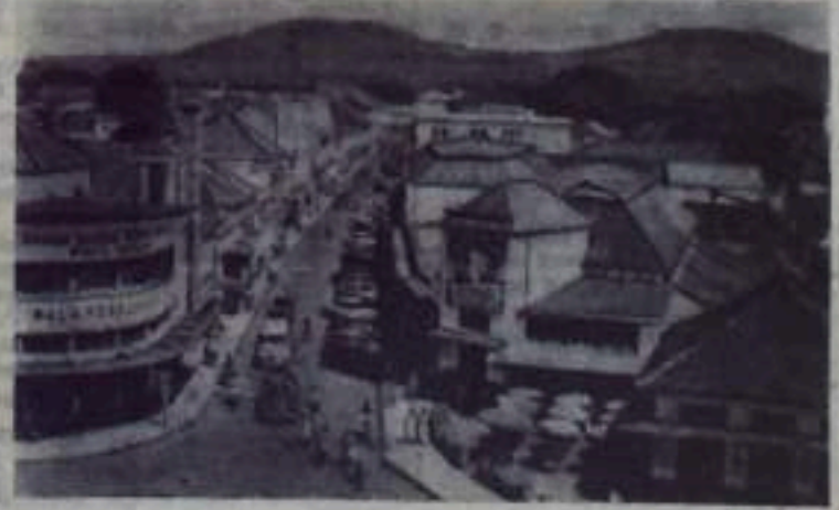
Индонезийская Республика. На снимке: улица Брага — один из деловых и торговых центров Бандунга.