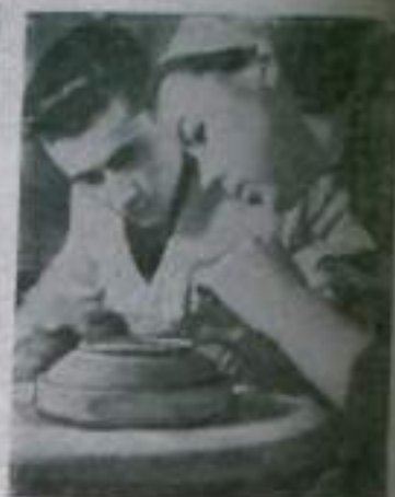
ЛАТВИЙСКАЯ ССР. Хорошою славою пользуются изделия учащегося Рижского училища прикладного искусства — мебели, различные ткани, керамика. Они неоднократно демонстрировались на выставках в Риге, Москве, во Франции и всюду пользуются неизменным успехом. Сейчас учащиеся активно готовят и предстоящей Всесоюзной выставке работ учащиеся высших и средних специальных учебных заведений.