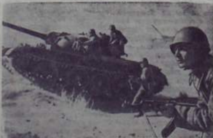
В Н-ской части на тактических занятиях.

Советская Армия стоит на защите мира, она не агрессивная армия, а народная армия, которая создана и выполняет роль верного защитника социалистического отечества.