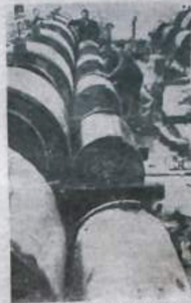
НАРОДНАЯ РЕСПУБЛИКА БОЛГАРИЯ. В Благоевграде сооружается корпус нового текстильного комбината. В его цехах будут установлены 400 станков и 1500 веретен.

Коммунистическая партия Болгарии постоянно заботится о повышении материального и культурного уровня жизни народа. Наша страна занимает