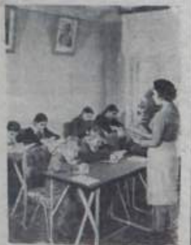
АСТРАХАНСКАЯ ОБЛАСТЬ. В селе Харабали открылась детская музыкальная школа. На открытии выступили хор мальчиков и балетная труппа.

А. ЖУЛЯБИН, директор детской музыкальной школы.