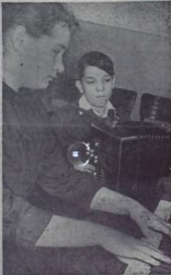
Близится к концу месячник музыкальной культуры. Активное участие в его проведении приняли и учащиеся детской музыкальной школы.

Большим и радостным событием в жизни учащихся был отчетный концерт, с которым