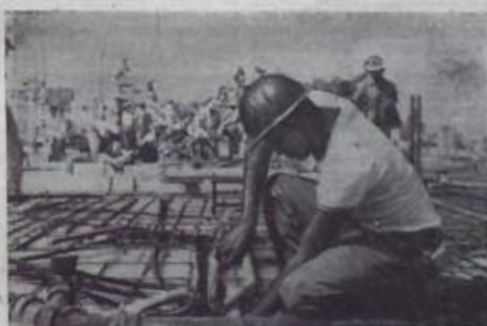
Кубинский народ с большим энтузиазмом отдаёт силы коллективному и культурному строительству. В стране сооружаются учебные центры, в городах создаются жилые районы. Большое строительство ведётся в столице Кубинской Республики — Гаване.

В настоящее время на месте катастрофы ведут раскопки пожарные бригады и сапёры.