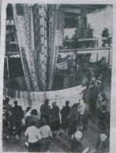
МОСКВА. В Центральном выставочном зале открыта Всесоюзная выставка текстильных товаров. Здесь демонстрируется 30 тысяч образцов отечественной текстильной продукции, представленных 250 предприятиями страны.

Недавно на сцене поселкового клуба выступили участники башкирской самодеятельности