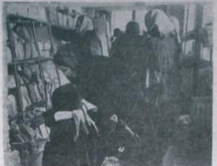
— Это очень удобно, — говорят наши горожане и торговцы без профиля, организованной в новом магазине самообслуживания, где все весовые товары предлагаются покупателям в радиопрограммном виде.

НА СНИМКЕ: в новом застрахованном магазине.