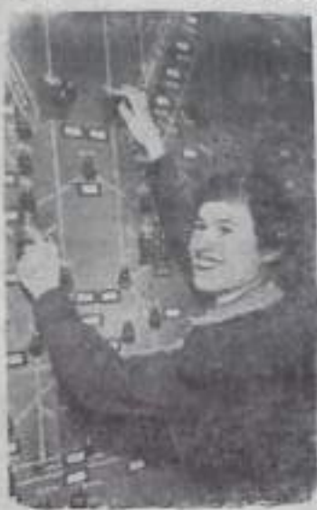
Вблизи Челябинска заканчивается сооружение автоматизированного Скопинского карьера. Первая очередь мощностью в 500 тысяч кубометров вступила в строй. Это предприятие будет снабжать щебнем строительств Оренбургской, Курганской, Омской, Кустанайской и других областей. В комплексе сооружений возводятся большой карьер, дробильно-сортировочная фабрика и несколько подсобных предприятий.