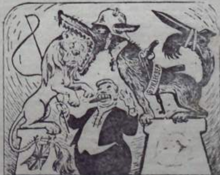
Рис. С. Чистякова.