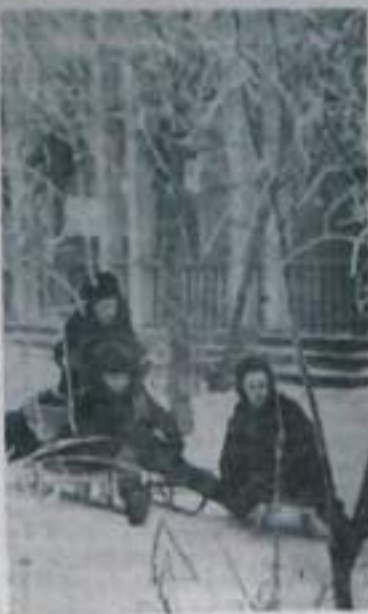
Долго пришлось ребятам ждать в этот лоду снежную зиму. Наконец, они пришли. Дружно выжили во двор с деревянными лопатами ребята, с сугроба на санях не свалились — нужна снежная гора. К нам на помощь пришли шефы — учащиеся школы №1. Лучшее здесь работали учащиеся четвертых классов.

обходимость на путях мирного экономического соревнования с капиталистическими странами настойчиво продолжать борьбу за решение в исторически кратчайший срок основной экономической задачи СССР. Важное место в работе съезда занял вопрос о преодолении последствий чуждого марксизму культа личности, восстановлении и дальнейшем укреплении ленинских норм партийной жизни и принципов коллективного руководства. Большое внимание съезд уделил дальнейшему улучшению идеологической работы партии, укреплению ее связи с практикой коммунистического строительства. Решения съезда партии вдохновили советский народ на еще более самоотверженный героический труд. В борьбе за выполнение предначертаний съезда были достигнуты выдающиеся успехи в развитии социалистической экономики и культуры, в повышении благосостояния народа, которые позволили Советскому Союзу перейти к решению задач разветвленного строительства коммунистического общества. Решения XX съезда КПСС оказали плодотворное влияние на дальнейшее укрепление международного коммунистического и рабочего движения, способствовали его дальнейшему развитию на основе марксизма-ленинизма.