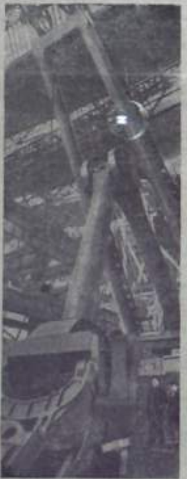
СВЕРДЛОВСЬ. 600 экскаваторов выпустил коллектив Уралмашзавода с начала семилетия. За этот период созданы 2 новых экскаватора, производительность которых на 20 процентов выше выпускаемых ранее.

На монтажной площадке цеха сборки крупных узлов авантюристы сборки монтируют образцы экскаватора ДКГ-5. В отличие от других машин этого типа их имеет лишь несколько в мире. Значительно снижен вес агрегата, удлинена свесная конструкция. Новый экскаватор создан коллективом конструкторов Уралмашзавода под руководством начальника конструкторского бюро В. З. Раскина. Новая машина будет производиться производственными предприятиями на территории предприятий Урала.