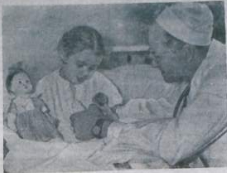
НОВОСИБИРСК. Институт экспериментальной биологии и медицины Сибирского отделения Академии наук СССР известен далеко за пределами страны. возглавляет его крупный ученый, лауреат Ленинской премии, профессор Евгений Николаевич Мешалкин.

Осенью 1958 года он сделал первую операцию на сердце. С тех пор Евгений Николаевич и его ученики сделали в Новосибирске триста операций на сердце и легких, вернув здоровье людям, страдавшим тяжелыми недугами.