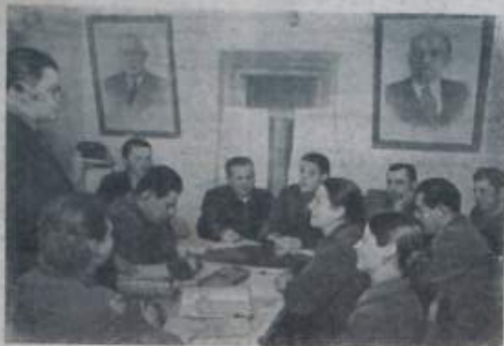
Волынская область. Хорошо организована учеба в сети партийного просвещения в колхозе «Новое життя» Ковельского района. Здесь более 120 человек регулярно посещает занятия различных политкружков.