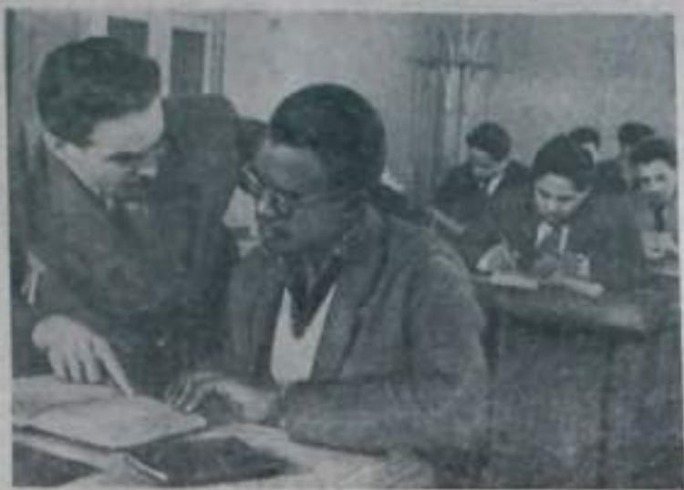
В Киевском государственном университете имени Т. Г. Шевченко на подготовительном факультете учится молодежь из Алжира, Афганистана, Объединенной Арабской Республики, Ганы, Гвинеи, Нигерии, Индонезии, Камеруна и других стран Азии и Африки.

В течение года они будут изучать русский язык и общеобразовательные дисциплины, а затем поступят на различные факультеты высших курсов.