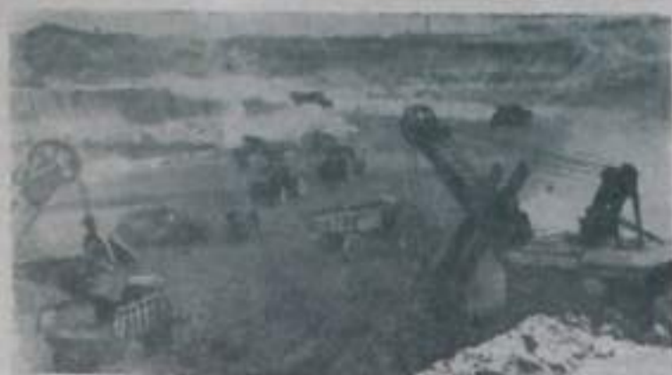
КАЗАХСКАЯ ССР. Сдана в эксплуатацию первая очередь крупнейшего в стране Сарбайского рудника Соколовско-Сарбайского горнообогатительного комбината. На подступах к железной руде горняки намостили лучшие мировые достижения, известные в истории горнорудной промышленности. За 1960 год они увеличили суточную добычу руды на 55 метров и вывели в отвалы 17 миллионов кубометров грунта.