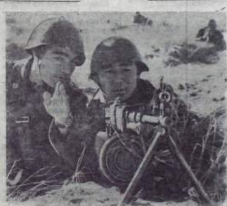
В Н-ской части на тактической занятиях.