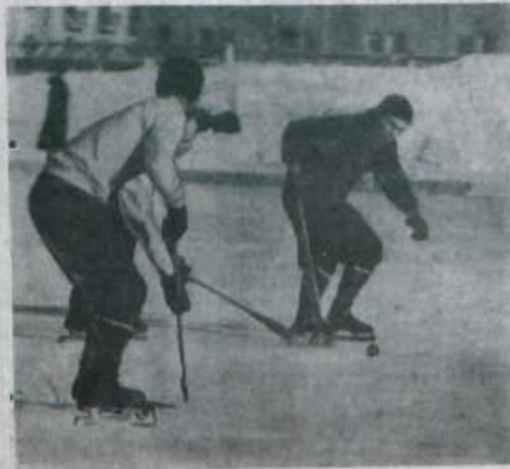
На хоккейном поле.