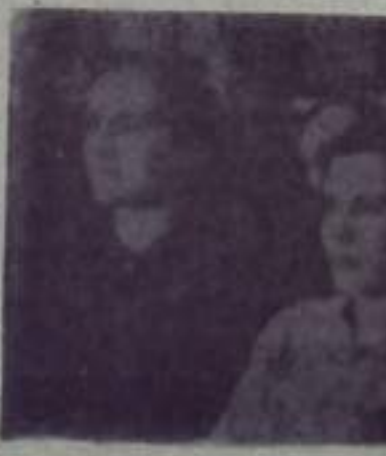
Внимательно слушают брикетчики рассказ агитатора и выступления товарищей о моральном кодексе строителя коммунизма.

В Программе партии указывается, что труд на благо общества — священная обязанность каждого человека. Великий труд на пользу общества, наш физический так и умственный, уважаем и почитаем. Поэтому ман-