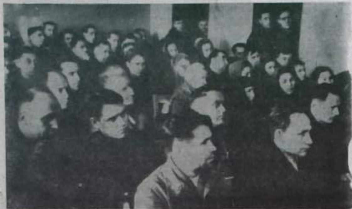
Общий вид собрания энергетиков.