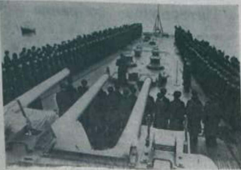
НА СНИМКЕ: на морable Н.