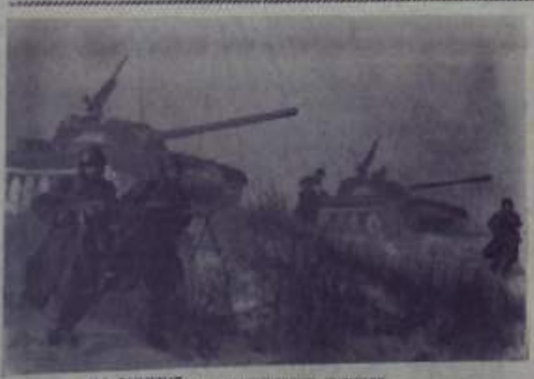
НА СНИМКЕ: на тактических учениях.

К 1921 году состав крепостных матросов резко изме-