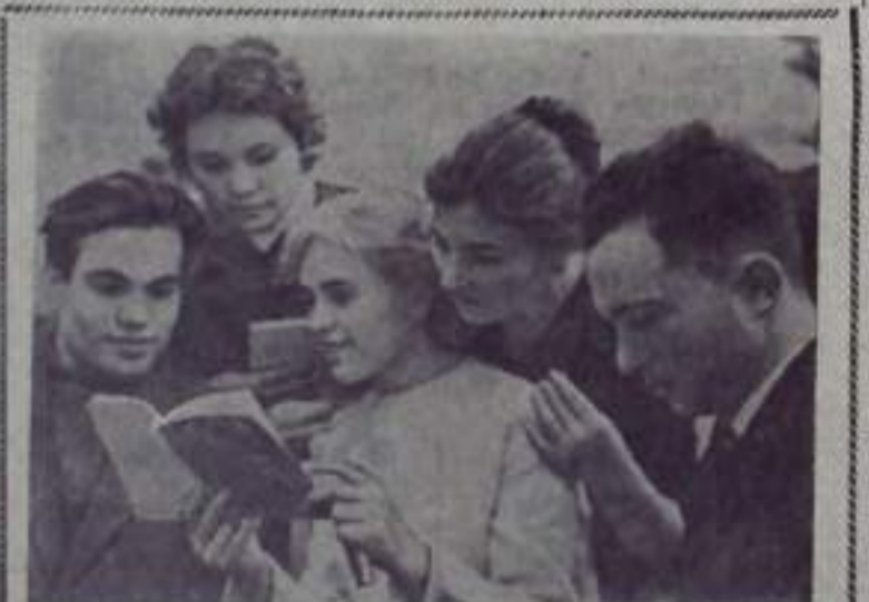
Саратов. Уже несколько лет при саратовской областной комсомольской газете «Взгляд молодежи» существует литературное объединение из молодых рабочих, учащихся, студентов.

На лекции присутствовало около 70 человек.