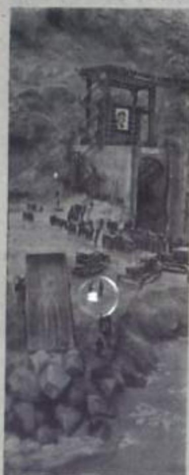
Киргизская ССР. Строители Токтогульской ГЭС направляют бурный поток Нарына по новому руслу. Оно прорито сквозь толщу скального монолита. Подземный коридор высотой в пятнадцать метров вытнулся на восемьсот метров.

Токтогульская ГЭС — крупнейшая энергетическая постройка Средней Азии. Четыре агрегата станции дадут в год 4,4 миллиарда киловатт-часов электроэнергии. За бетонной плотинной, поднявшейся на двести тридцать метров, образуется водохранилище емкостью девятнадцать миллиардов кубометров. Оно вдоволь напорт влаги около двух миллионов гектаров земель Киргизии, Узбекистана, Таджикистана и Южного Казахстана.