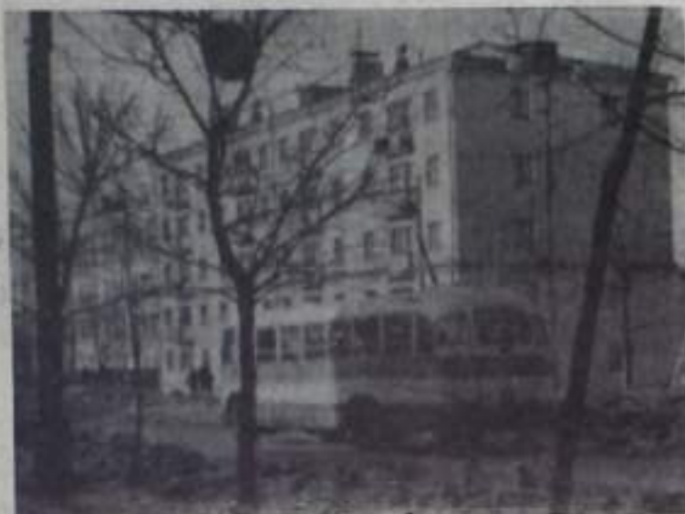
На снимке: новый дом на улице Карла Маркса.