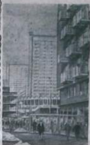
На руин и пепелищ волей и трудом всего польского народа восстала Варшава. Вновь обрели свой прежний облик реставрированные дома старого города, радуют глаз богатством красок и форм центральные улицы и новые жилые кварталы. На снимке: на Маршалковской улице.

М. МАРКЕЛОВ, секретарь парторганизации машзавода.