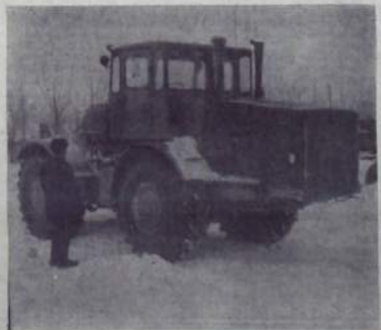
На снимке: новый трактор «К-700».

Всего в район поступит свыше 5 таких тракторов-гигантов. Хозяйства, заказавшие новые мощные машины, готовят для работы на них трактористов.