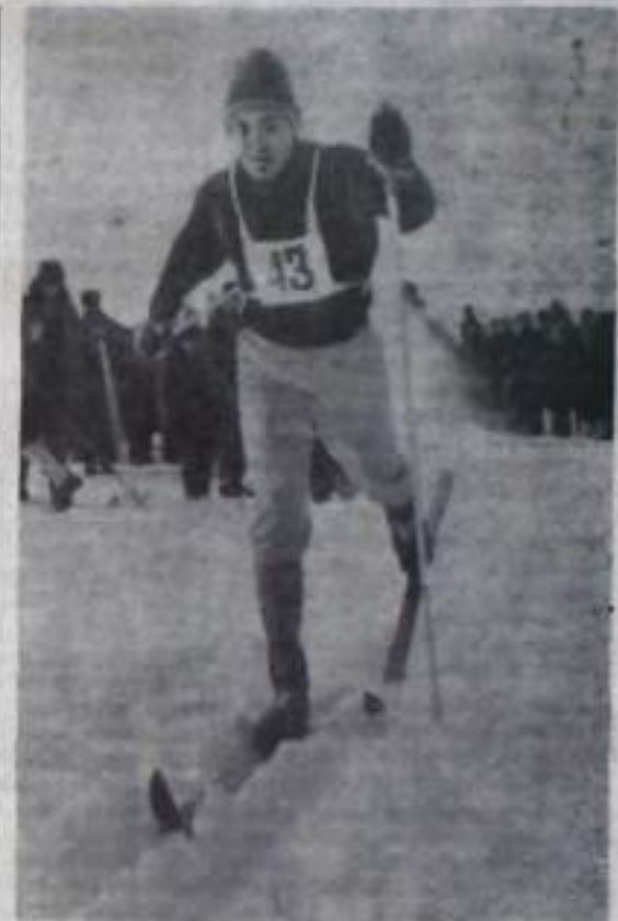
На снимке: момент соревнования.

Неудачное выступление наших спортсменов объясняется слабой технической и физической подготовкой кумертауских лыжников, отсутствием круглогодичных тренировок и ослаблением спортивной работы в целом коллектива горномеханического техникума, (преподаватель физкультуры А. И. Аминов).