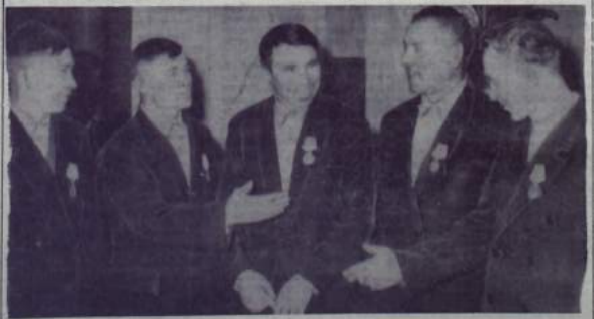
На сценке: группа передовиков-свекловодов, отмеченных правительственными наградами.

Участники совещания приняли обязательства по выращиванию сахарной свеклы на 1966 год.