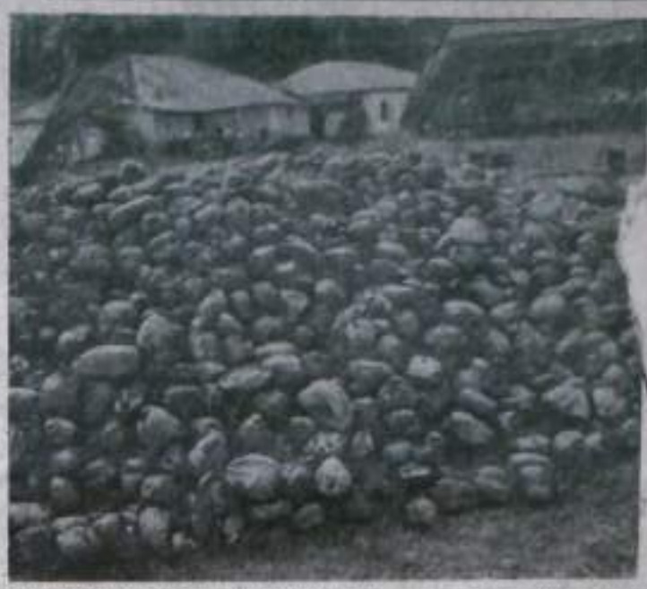
Занзибар. За последние годы остров стал поставщиком кофры — высушенных ядер кокосовых орехов. Под пальмовые плантации занято около пятидесяти тысяч гектаров. Местная разновидность пальмы отличается высоконкачественной кофрой, не уступающей лучшим африканским сортам. Масло и жмых, кокосовое волокно — кофра составляют важнейшие статьи дохода Занзибара от внешней торговли.