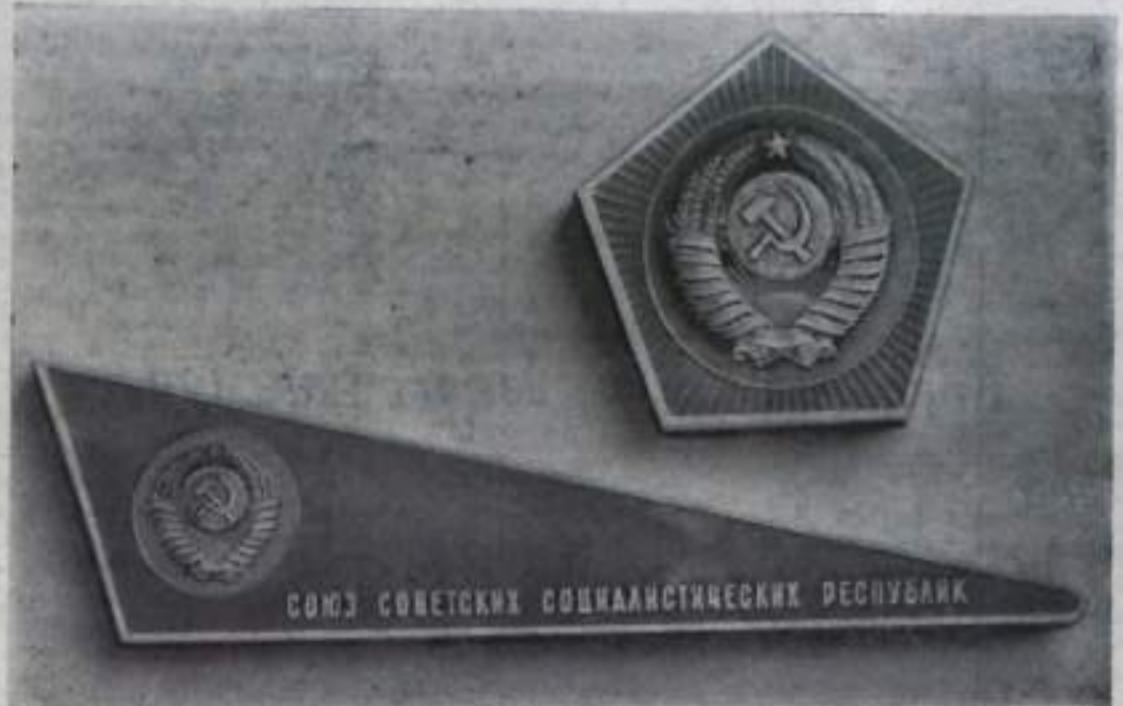
Вымпел и Государственный герб Советского Союза (лицевая сторона), доставленные на Луну советской космической станцией «Луна-9».

Поздравления прислали президент Франции Ш. де Голль, президент США Линдон Б. Джонсон, премьер-министр Великобритании Г. Вильсон, президент Индии С. Радхакришнан, император Эфиопии Хайле Селассие.