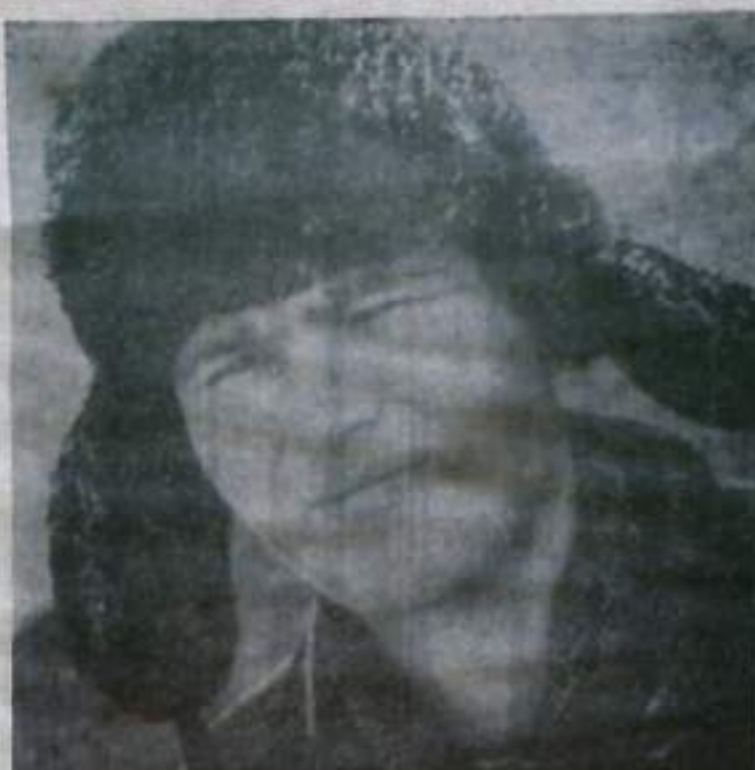
— А мне нравится профессия скотника. Работа трудная, вроде бы не творческая, но я нахожу в ней удовлетворение, потому что чувствую ее важность для общего дела.

Партийные бюро и комитеты обязаны повседневно проявлять заботу о развертывании политической информации среди трудящихся, квалифицированно учить политинформаторов, контролировать и направлять их деятельность.