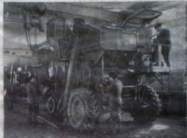
Саратовский край. Поставить на линейку готовности трактора, всю посевную и почвообработочную технику к 10 февраля, а комбайны, жатки и зерноуборочные машины — к 1 июня — под таким девизом трудятся механизаторы совхоза «Грачевский». В местечках, оснащенных современным оборудованием, применяется прогрессивная технология поточного ремонта. Ежегодно ремонтники ставят свыше двадцати машин.

на складе. Ремонт комбайнов в мастерских совхоза.