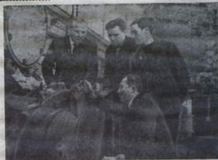
Донецкая область. В институте «Донуглемаш», создающем машины для угольной промышленности, организована школа механизаторов шахт Украины. Авторы новой техники знакомят курсантов с машинами и комплексами, идущими на смену устаревшим агрегатам с современной автоматизацией и электроникой.