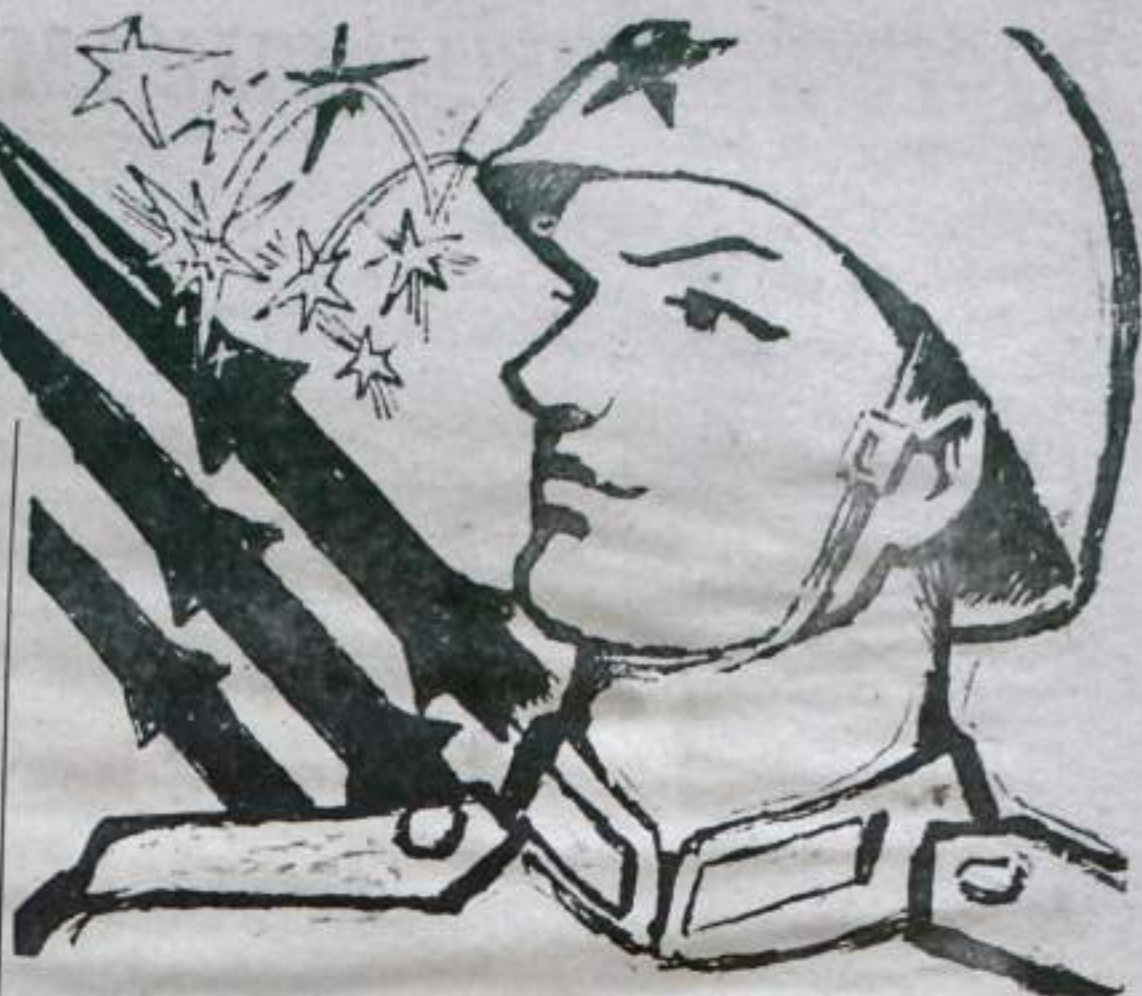
Рис. Ю. ЛАРИНА.