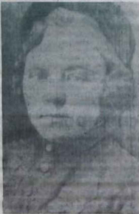
осеив, подняла голову подруги.