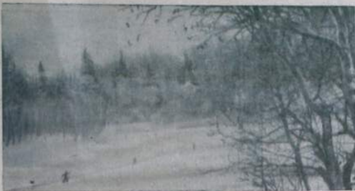
В зимнем лесу.