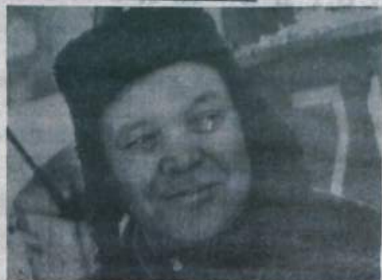
го «форда» к Одеру солдат-победитель.

Через Венгрию, Чехословакию, по дорогам Германии вывел свое-