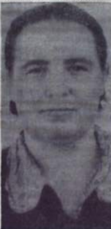
Она отлично потрудилась в юбилейном году и значительно перекрыла задание по сбору яиц.

Литература: 50 лет Великой Октябрьской со-