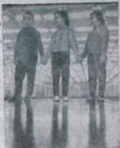
Курский камвольно-трикотажный комбинат приступил к выпуску продукции — женских платьев, кофт, костюмов, мужских рубашек, детских костюмчиков различных фасонов и расцветок.

Торговые эксперты признали, что продукция, которую выпускает это крупнейшее в стране предприятие, — отличного качества.