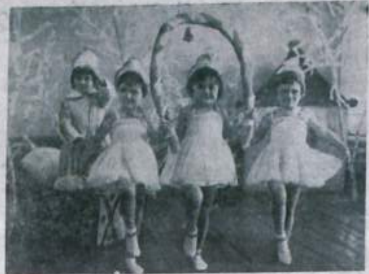
АЛТАЙСКИЙ КРАЙ. В детском саду совхоза «Новоалтайский» — сто двадцать малышей. Хорошую программу подготовили дети к утреннику, на который пришли их мамы и папы.

Молодежь общежития искренне благодарит их за материнскую заботу. В. БУТОРИН.