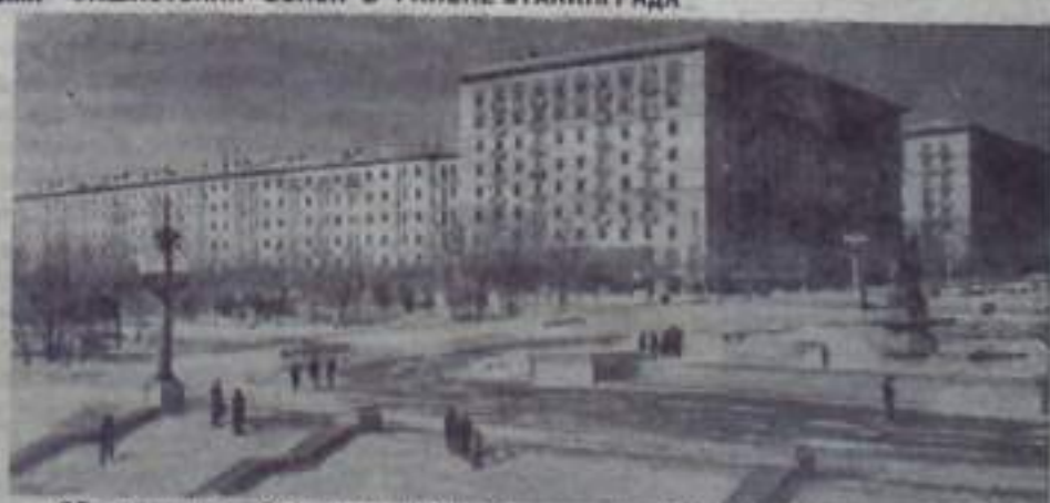
25 лет назад — 2 февраля 1943 года — Советская Армия завершила ликвидацию фашистских войск, окруженных в районе Сталинграда. Победа советских войск в битве на Волге положила начало коренному повороту в военных действиях на советско-германском фронте и во всей 2-ой мировой войне.