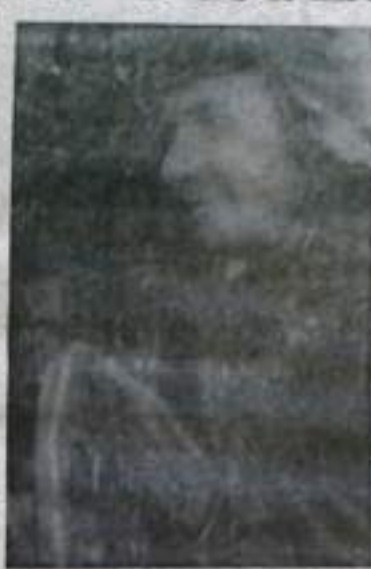
Скуб. — Активно участвует во всех проводимых группой мероприятиях.

— На редкость добросовестный товарищ, — с удовлетворением характеризует его председатель группы народного контроля П. Н.