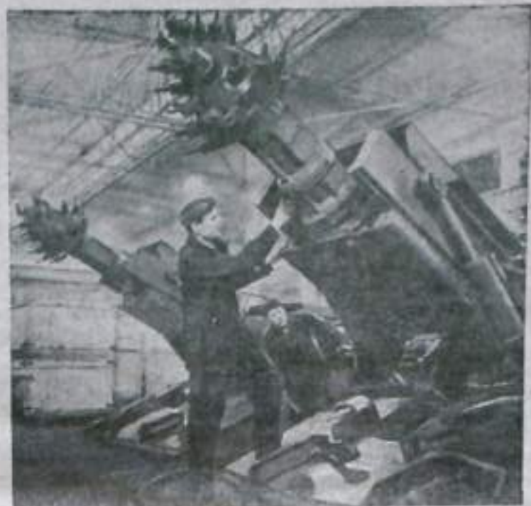
Челябинская область. Угольные комбайны и другие горючие машины, изготовленные Челябинским машиностроительным заводом имени Кирова, известны во всех бассейнах нашей страны и далеко за ее пределами.

Задача партийных, комсомольских и профсоюзных организаций вместе со специалистами колхозов и совхозов в кратчайший срок принять решительные меры, чтобы обеспечить стопроцентную готовность техники к весенним полевым работам.