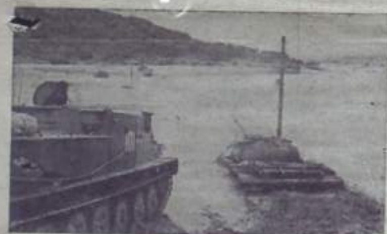
Танкисты на тактических учениях преодолевают водную преграду.