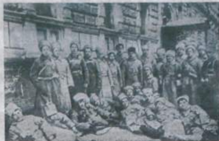
ПЕТРОГРАД. Один из первых отрядов Красной Армии.