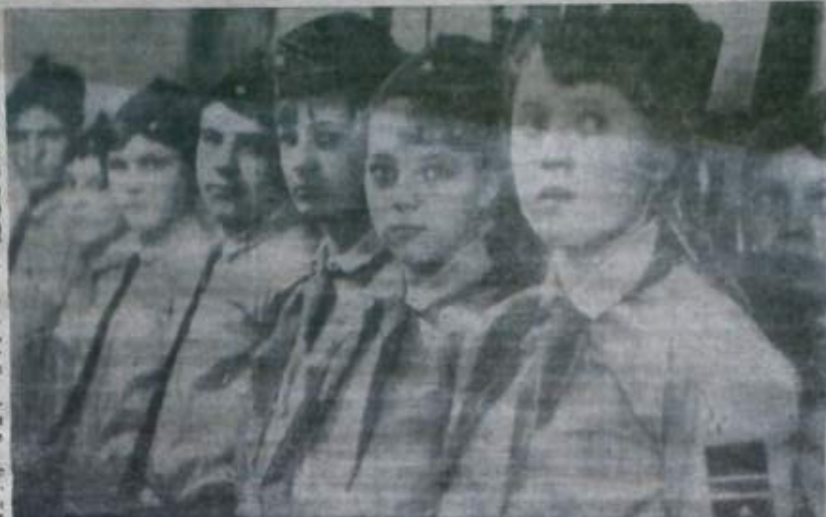
Боевой отряд ЮДМ перед выходом на «операцию».