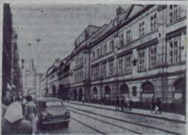
Чехословацкая Социалистическая Республика. Здание улицы В. И. Ленина в Праге.

невского округа будет построен новый содовый завод — один из самых крупных в Европе. В его строительстве примут участие страны СЭВ.