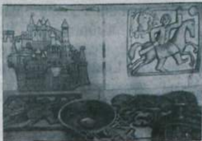
Московский завод цветного литья начал выпускать новую продукцию — русские сувениры. Среди них оригинальные литейные подсвечники, настольные лампы, подсвечники и другие сувениры, сделанные по мотивам русской старины московскими художниками.