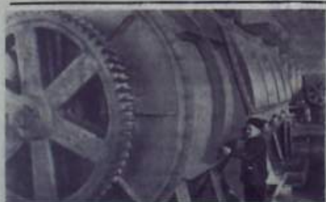
Тулская область. Беловский машиностроительный завод, выпускающий оборудование для сахарной, молочной и мясной промышленности, увеличивает в этом году выпуск продукции. План прошлого года завод перевыполнил, реализацию заказов на сотни тысяч рублей доплатил к заданию.

В текущем году комитетам профсоюзов, советам ВОИР и заводским руководителям предприятий необходимо поднять рационализаторскую работу на должный уровень.