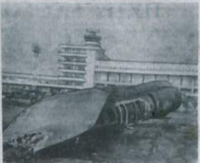
Израильская военная совершает провокации против арабских стран. Израильский десант, выброшенный с вертолетов в конце прошлого года, атаковал крупнейший на Ближнем Востоке беirutский аэропорт. Уничтожены пассажирские самолеты, принадлежащие арабским авиакоманим компаниям (на снимке).