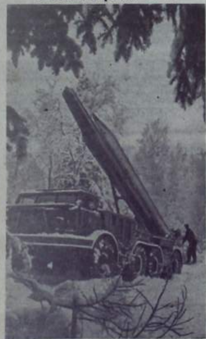
На снимке: ракетная установка готовится к пуску.