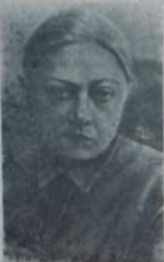
На снимке: Н. К. Крупская. 1924 г.