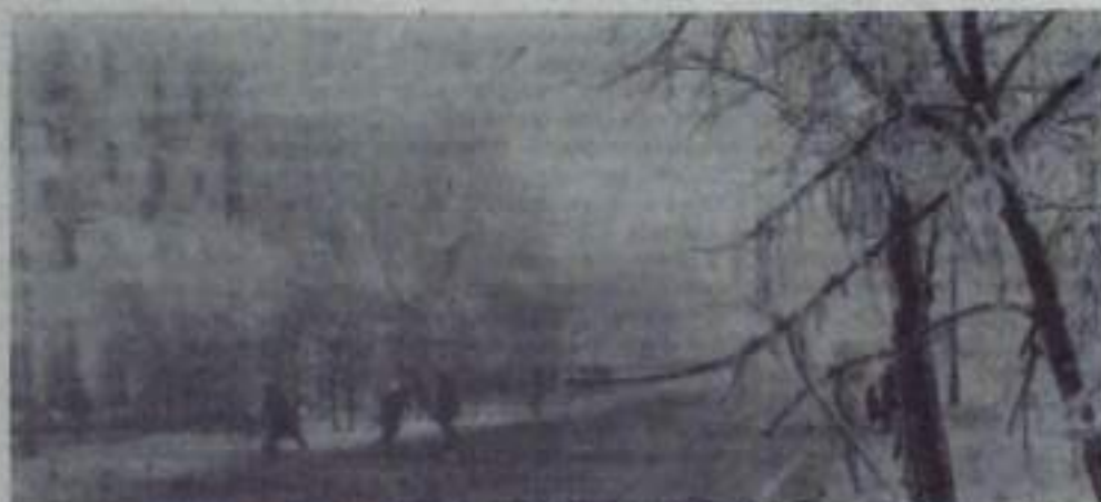
А зима все же горюха!