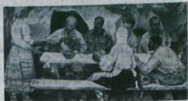
Минск. В Государственном художественном музее Белоруссии экспонируется выставка «50 лет БССР и КПБ». На ней представлены 600 произведений живописи, скульптуры, графики, декоративного и прикладного искусства. С интересом знакомятся местные гости с работами белорусских художников. На снимке: картина художника П. С. Кропоткина «Первая коммуна».