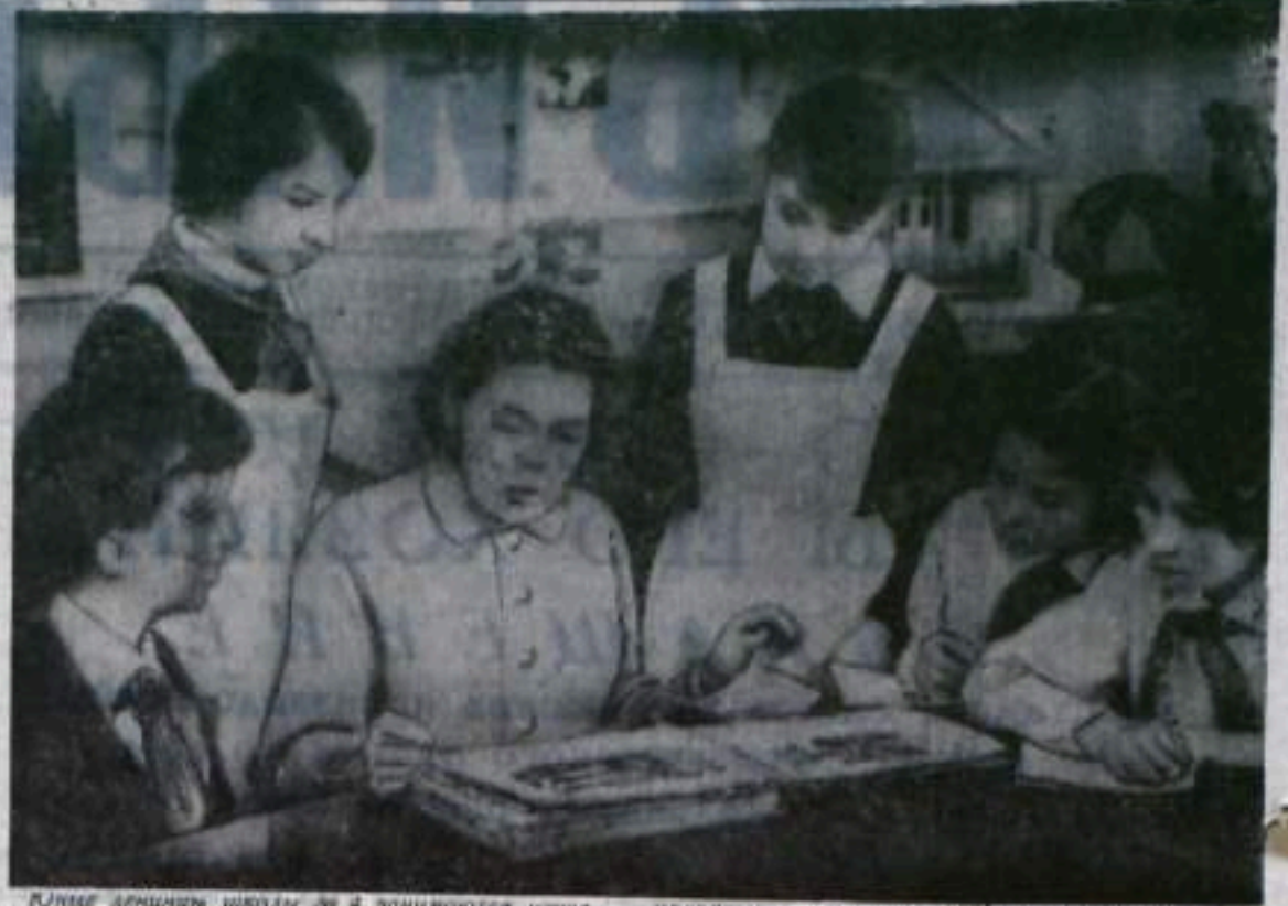
Ученики ленинской школы № 4 занимаются изучением истории пионерской организации нашего города. В этом деле им помогают ветераны партии и комсомола. Пионеры часто встречаются с ними, в беседах узнают об энтузиазме комсомольцев и

секретарь комитета комсомола комбината «Башикруголь».