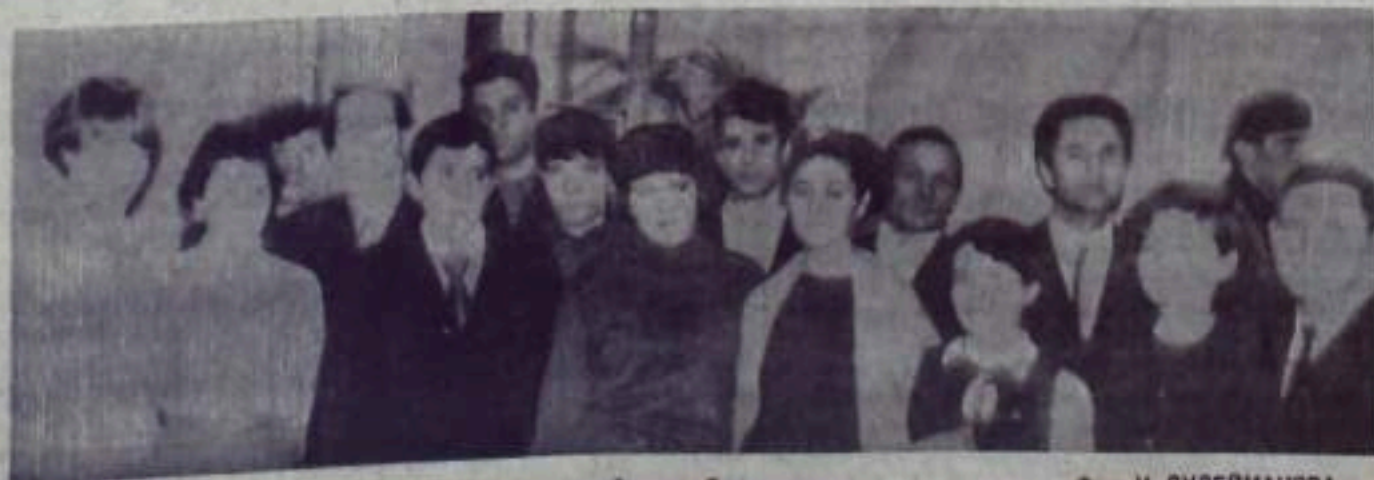
На снимке: группа делегатов, комсомольцев комбината «Башкируголь».