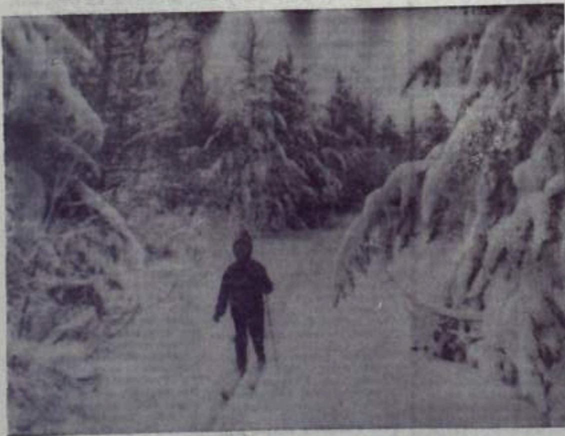
В зимний день