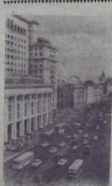
Москва сегодня. На Манежной площади у здания съездиним «Москва».

Членов коллективов и ударников коммунистического труда называют разведчиками будущего. То же самое можно сказать о рационализаторах и изобретателях, воплощающих в себе черты человека коммунистического общества. Новаторы — это люди передовых взглядов, крылатой фантазии, носители всего передового, прогрессивного. Своим самоотверженным творческим трудом они вносят большой вклад в досрочное выполнение планов семилетки, быстрее приближают светлое коммунистическое завтра. Поддерживать, всемерно способствовать росту их рядов, развивать на них остальных — это почетная и благородная задача, которую призваны решать в своей повседневной работе партийные организации и общественность всех предприятий города.