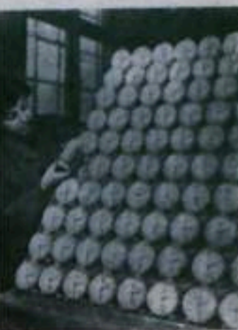
Польская Народная Республика. Независимо коллектив часового завода в Лодзи отметил своеобразный юбилей. Предприятие выпустило миллионный буровик. Завод выпускает буровики, кабинетные и настольные часы.

На снимке: готовые буровики в цехе завода.