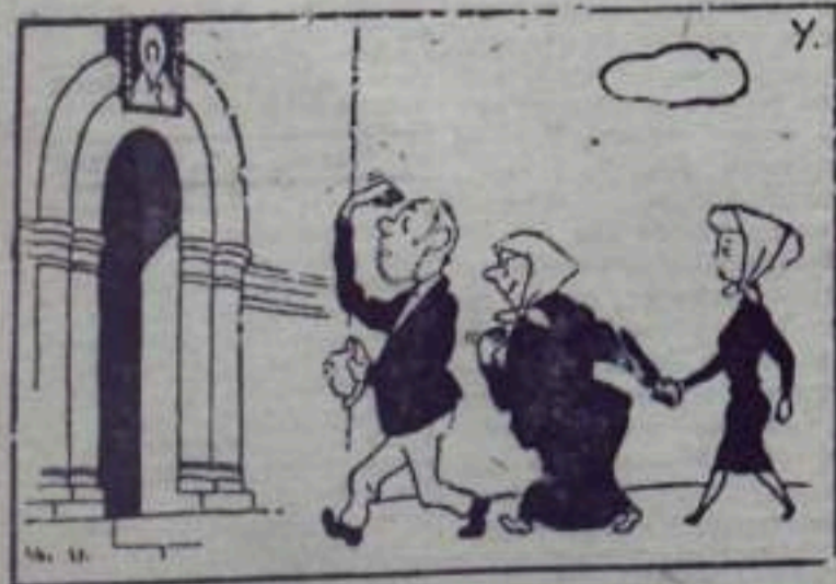
Баба за дедом, внучка за бабой.