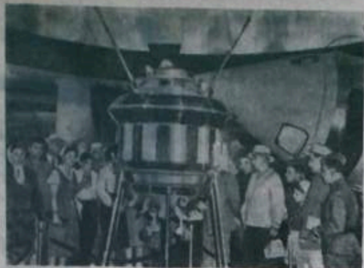
МОСКВА. На Выставке достижений народного хозяйства СССР открыта для обозрения новая экспозиция авиационной Академии наук СССР.

На снимке: посетители в одном из залов авиальона. На первом плане — модель авиационной межпланетной станции, на которой была установлена аппаратура, сфотографировавшая обратную сторону Луны и передавшая снимки на Землю.