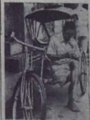
Таиланд Велорикша подвезает свой дневной заработок.

секретарь парторганизации автобазы треста «Кумертаустрой».