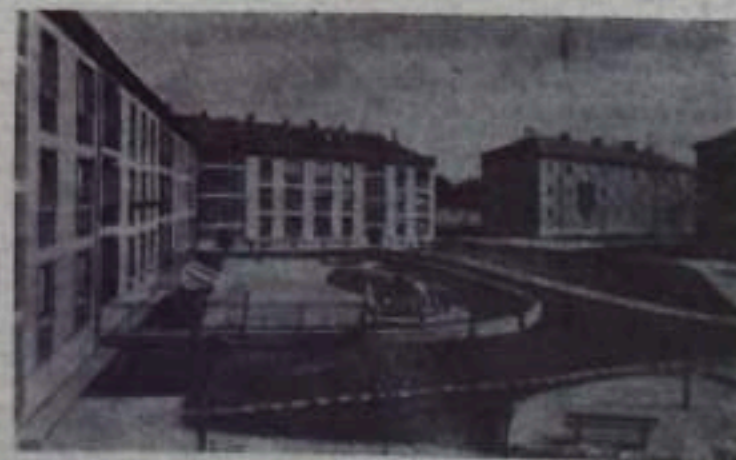
Новый жилой квартал Будапешта.

Урожай раннего риса собирается в этом году значительно быстрее, чем раньше. Деревья в этом году получили большое количество простейших сельскохозяйственных машин и механизмов, облегчающих труд людей.