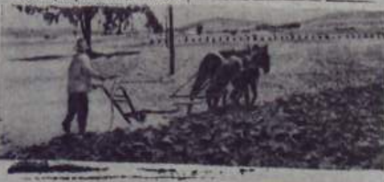
Выпуск № 1030.