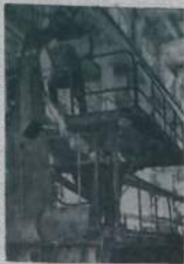
Тульская область. Скуратовский экспериментальный завод. Центрального научно-исследовательского и проектно-конструкторского института подземного и шахтного строительства выпускает новые машины и механизмы. На снимке: сборка самоходной вращательно-ударной буровой установки, предназначенной для бурения забоев горизонтальных выработок различного назначения высотой до 12 метров. Она облегчает труд буровишников и повышает его производительность.