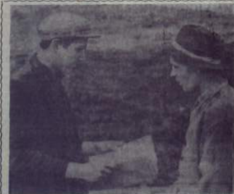
На строительстве Вузуского водохранилища работает много молодежи. Одни сюда приехали из учебных заведений и превращают свои знания на практике, другие получили специальность на стройке. Каждый молодой труженик вносит свой вклад в общее дело.