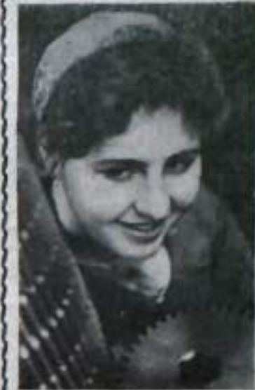
Здравствуй, солнце и лес!

Теплым, летним вечером жители домов 1-го Комсомольского переулка собрались на детской площадке послушать беседу, посвященную 60-летию со дня рождения певца С. Лемешева. Беседа сопровождалась прослушиванием записанных на пленку произведений в исполнении С. Лемешева.