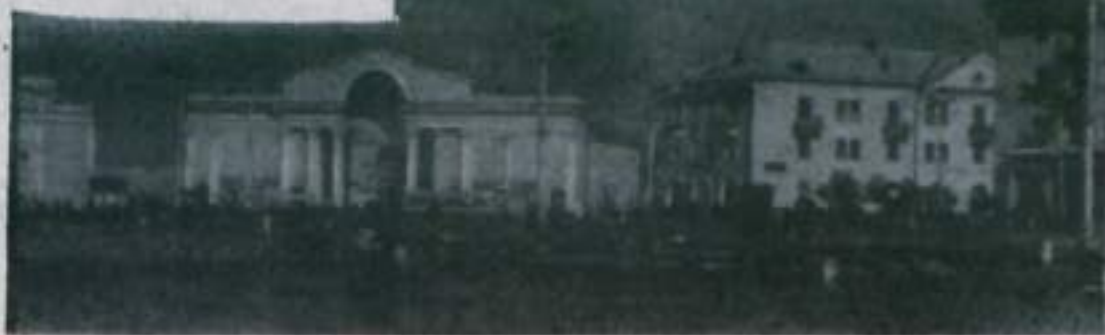
Александрия. Площадь Революции.

Бригада стала на карту мира и успешно осуществляет взятые на себя социалистические обязательства.