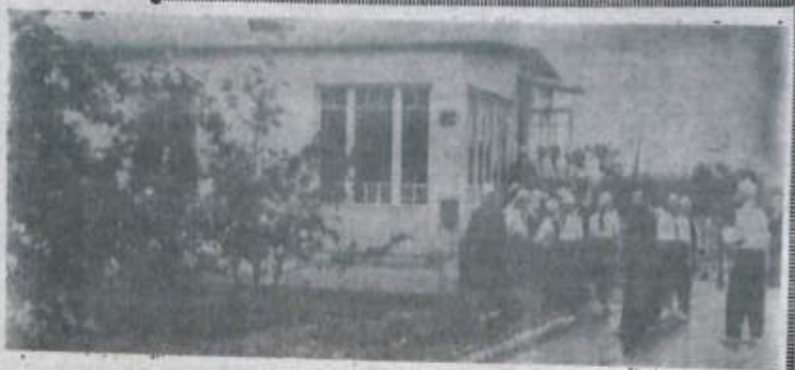
На этом снимке вы видите новый дом Гагариных и 7 «б» класс школы-интерната имени Ю. Гагарина.