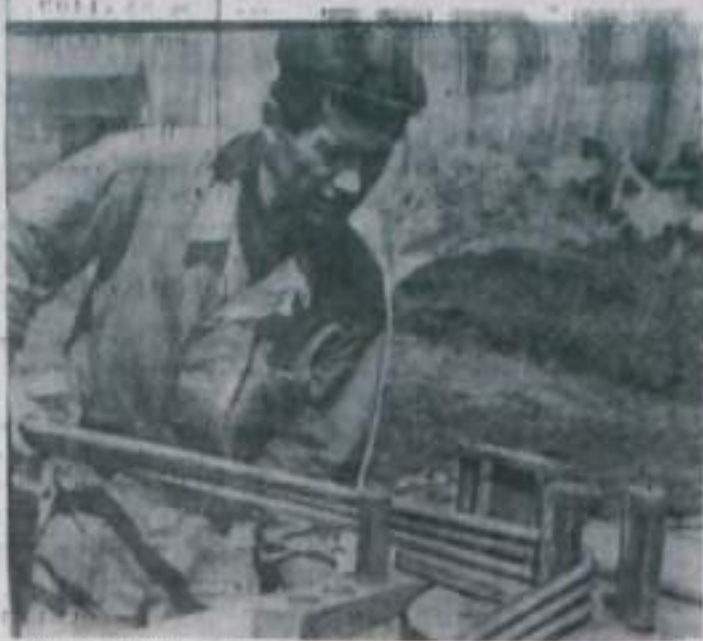
Строители, проходя у зданий, которые они строят своими руками, с гордостью говорят: