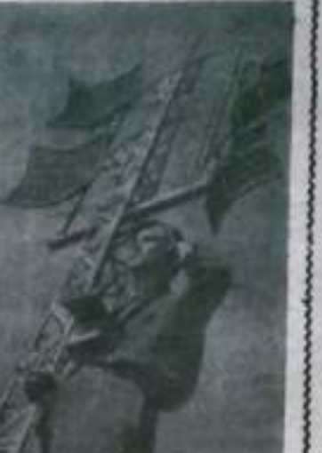
Саратов. Новая радиорелейная станция построена при местном отделении Главнефтегаза РСФСР. Станция оснащена новейшей аппаратурой, которая позволяет одновременно вести разговор с 22 абонентами. Кроме того, установлен и действует радиотелеграф. Новая станция обеспечивает регулярную связь с нефтяными и газовыми промыслами Заволжья, расположенными в 60—100 километрах от Саратова. На снимке: старший инженер связи А. Грибков проверяет работу радиорелейной станции.