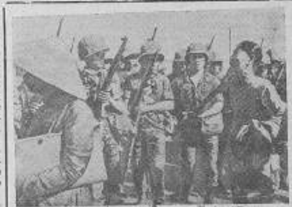
Юный Вьетнам. Миллионетная северная армия вьетнамцев готовится к наступлению.

Мы рады приветствовать в нашем институте студентов из различных городов и предприятий.