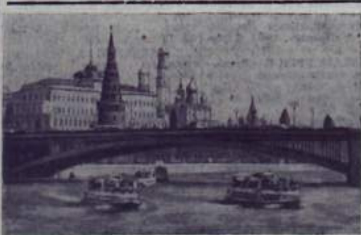
Москва сегодня. Вид на Кремль со стороны Большого Каменного моста.

Труженики сельского хозяйства! Полностью обеспечим животноводство грубыми и сочными кормами, создадим скоту ситую зимовку — в этом залог наших дальнейших успехов в деле увеличения производства мяса, молока, яиц и шерсти.