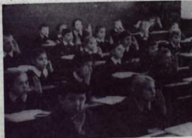
Пятиклассники сосредоточены. Вопрос один. А сколько готовых ответов!