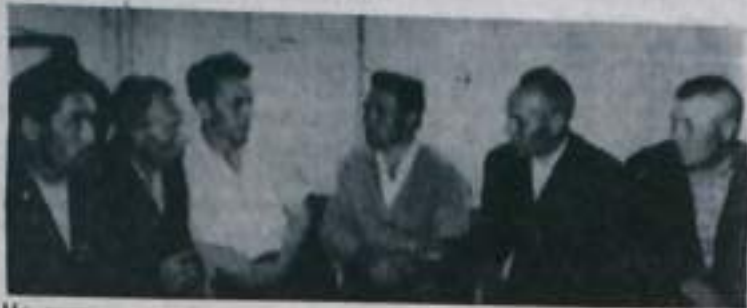
На снимке: труженники колхоза «Искра» и представители шефской организации — автотранспортной конторы Башавтотрансуправления.

Мне поручено заверить вас, товарищи шефы, что мы будем добиваться еще более лучших производственных успехов в решении задач, поставленных мартовским Пленумом ЦК КПСС.