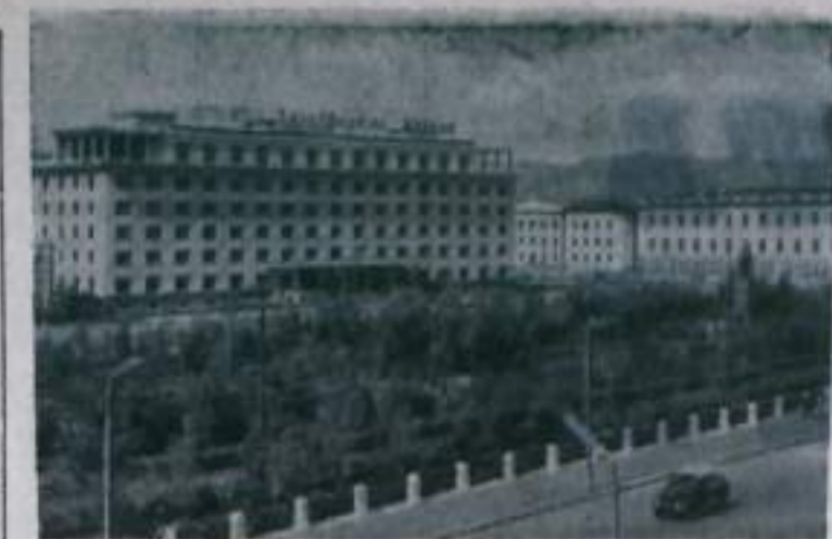
Сегодня национальный праздник трудящихся Монгольской Народной Республики — 44-я годовщина победы народной революции.