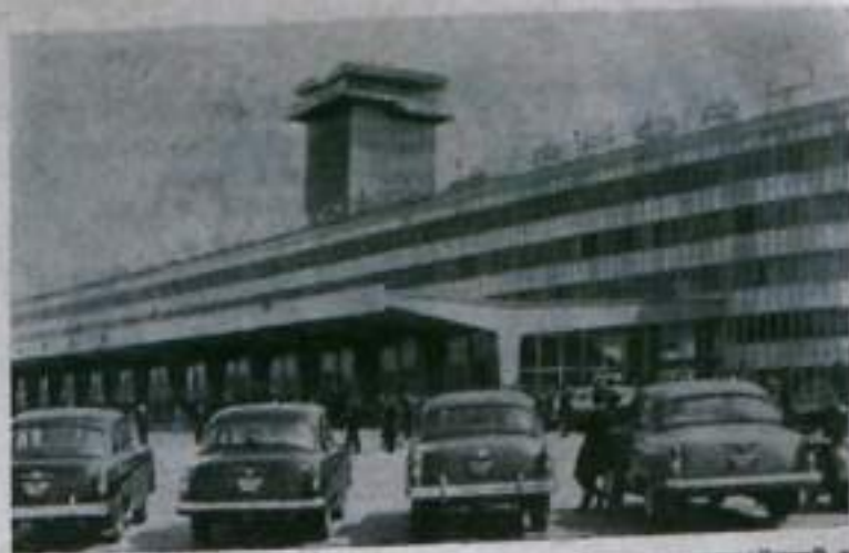
В 43 километрах восточнее Москвы открылся крупнейший в стране аэровокзал «Домодедово». Новый аэровокзал состоит из комплекса пассажирских помещений, линейно-эксплуатационно-ремонтных мастерских, командно-диспетчерского пункта, грузовой службы отделения перевозки почты, гостиницы для пассажиров и ресторанов. Пропускная способность аэровокзала 3 тысячи пассажиров в час.

НА СНИМКЕ: новый аэровокзал.