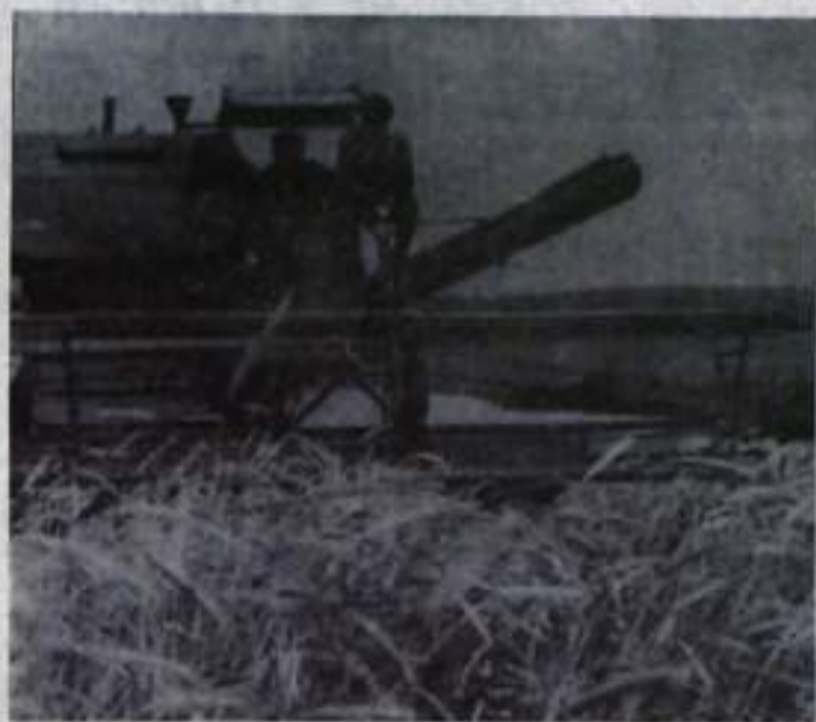
На снимке: косовица ржи в колхозе имени Калинина.