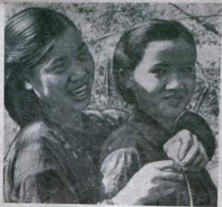
ДЕМОКРАТИЧЕСКАЯ РЕСПУБЛИКА ВЬЕТНАМ. На всю страну прославился высоким урожаем кооператива «Красный восток» в провинции Тханьхоа. До 70 центнеров риса с гектара получают здесь крестьяне. Многие юности и мужчины ушли в армию. Основная тяжесть пеллегого труда легла на женщин. Они работают сейчас за двоих, забывая о сне и усталости. «Каждый дополнительный килограмм риса — это наш шаг к миру», — говорят отважные патриотки. НА СНИМКЕ: женщины из кооператива «Красный восток».