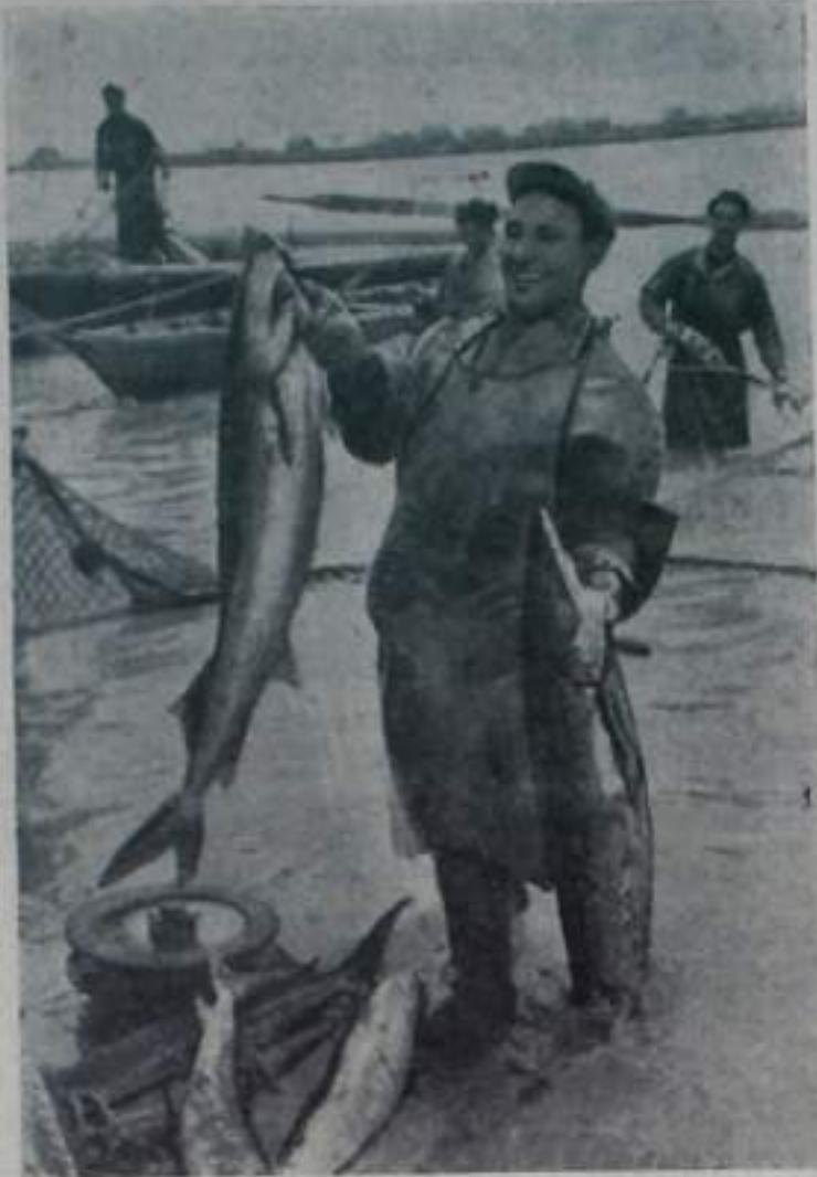
С хорошим уловом!