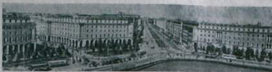
Огромные успехи в строительстве социализма достигнуты трудящимися Польши за годы народной власти.

Сейчас польский народ успешно трудится над выполнением нового пятилетнего плана (1966—1970 гг), направленного на завершение строительства основ социализма. На международной арене польское государство последовательно проводит в жизнь политику единства мировой социалистической системы, политику союза и дружбы с Советским Союзом, выступает активным и признанным борцом за мир и свободу народов.