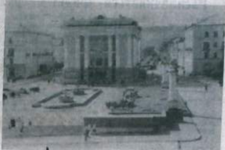
Белоречье сегодня. Площадь Металлургов.

Таковы перспективы металлургического комбината в новой пятилетке.