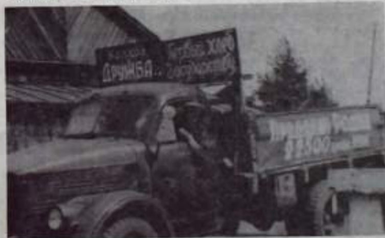
На снимке: хлеб идет...