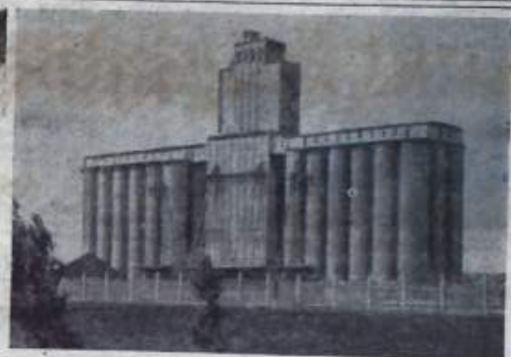
Этот мощный элеватор построен в районном центре Шумила Курганской области. В дни уборки сюда повезут зерно хлеборобы Целинного, Алашевского, Шумилинского, Щучанского и других глубинных районов Зауралья.

на нового урожая. Ежедневно здесь по несколько автомашин ставится на углубленный осмотр и профилактический ремонт. Автохозяйство поставило перед собой задачу — хорошо подготовить в уборке все автомашины, чтобы в любое время выдвинуть в хозяйства района потребное количество автомашин для перевозки зерна нового урожая.