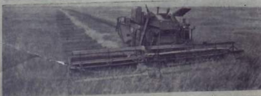
Больше всех в Ижевском районе Оренбургской области продают зерна государству хлеборобы колхоза «Россия».