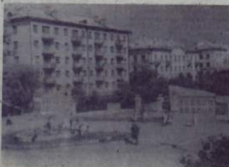
Белоречье сегодня. Улица Точисского и север Дружбы.