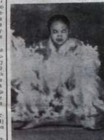
Южный Вьетнам. В городе Гуэ монахини подвергла себя самоожожению в знак протеста против политики США во Вьетнаме.

В. СУЛТАНОВ, зам. центрального аппарата № 7722 г. Кумертау.