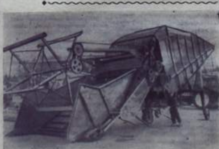
МОСКВА. Этот опытный образец самооборочного комбайна «КНС-1», предназначенного для уборки на самохоту, подсолнечника и других культур, можно увидеть на Выставке достижений народного хозяйства СССР. Комбайн навешивается на самоходное шасси «СШ-73» и обслуживается одним механизатором. Производительность его — 15 килограммов массы в секунду.