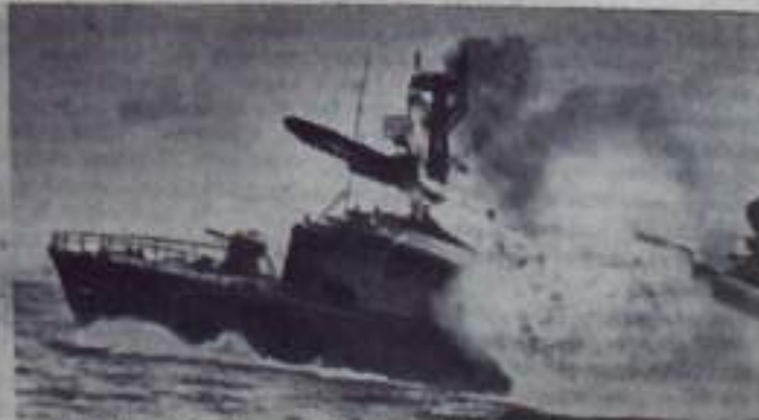
На снимке справа: ракетный хатер произвел пуск ракеты.

успехи в боевой и политической подготовке они получили высокие награды.