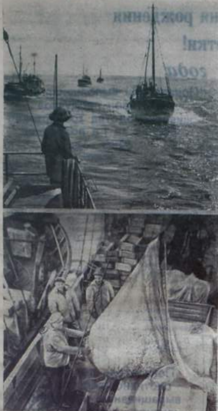
В воскресенье 14 июля советский народ чествует труд рыбаков и всех работников рыбной промышленности, ежегодно дающих к столу советских людей десятки миллионов центнеров рыбы.

За годы Советской власти рыбная промышленность прекратилась в крупнейшую отрасль народного хозяйства страны. Она охватывает самую крупную в мире флотилию больших морозильных и рыбообрабатывающих судов. Мощная материально-техническая база позволяет советским рыбакам добывать рыбу во многих районах Мирового океана. Большое внимание уделяется расширению рыболовства и рыболовства во внутренних водоемах страны.