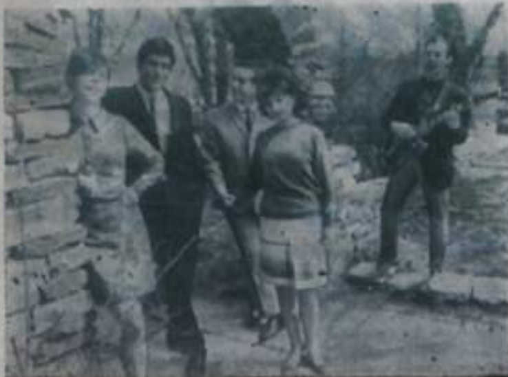
БОЛГАРИЯ. В дни IX Всемирного фестиваля молодежи и студентов в Софии перед многочисленными гостями, которые придут более чем из 120 стран мира, выступит несколько музыкальных коллективов Болгарии. Среди них будет и студенческий эстрадный ансамбль «Метроном».

НА СНИМКЕ: участники ансамбля.