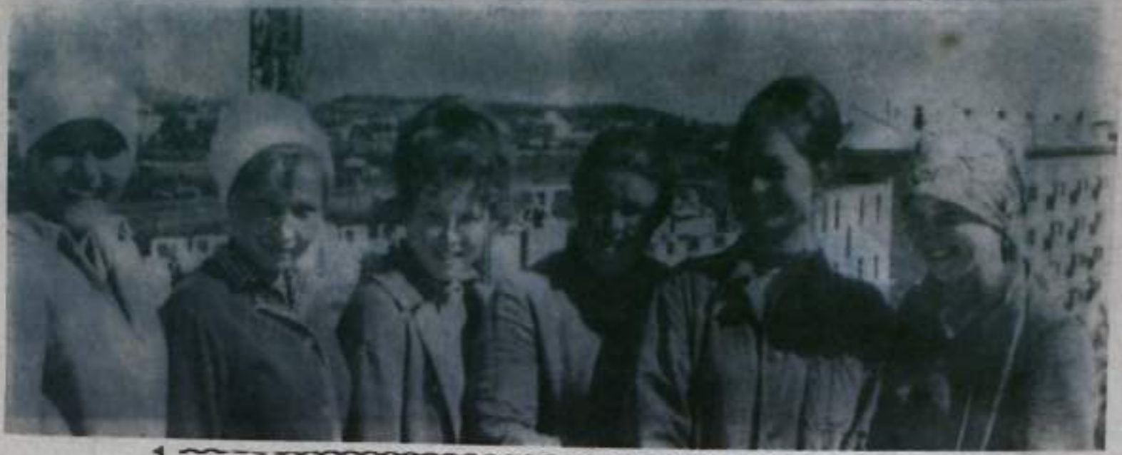
Пролетарии всех стран, соединяйтесь!