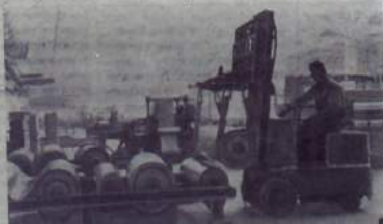
ЛЕНИНГРАД. В Колпине построен и принят Государственной комиссией завод линолеума и профильных изделий.

Мощность нового предприятия 9,5 миллиона квадратных метров линолеума и 10 миллионов погонных метров профильных изделий в год.