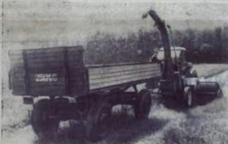
Новый образец сельскохозяйственной техники, вывезенный известным будапештским заводом «Красная звезда». К трактору «Дура» присоединена сенокосилка. Свежескошенная трава поступает в кузов автоприцепа.