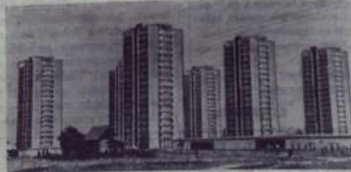
Эти многоэтажные жилые дома выросли в последние годы в новой части старинного Загреба. Ежегодно социалистической Федеративной Республике Югославия строятся десятки тысяч новых благоустроенных квартир.

Министр обороны заявил, что американские вооруженные силы будут находиться в Южном Вьетнаме по крайней мере до 1970 года. Клиффорд высказался за продолжение бомбардировок территории ДРВ.