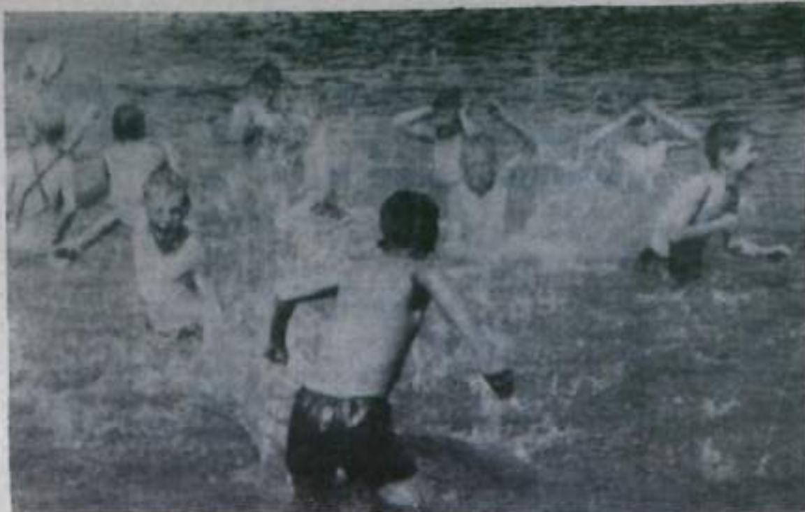
В жаркий летний день.