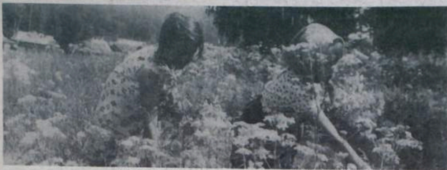
На лесной полянке,