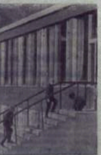
Новый магазин и поликлиника в поселке строителей Сайно-Шушенской ГЭС.