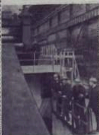
Накануне пуска находится важнейшая стройка пятилетки — стан холодной прокатки «2500» Магнитогорского металлургического комбината. Этот стан будет производить высококачественный лист для Волжского автомобильного завода, сооружаемого в Тольятти. Производственные процессы стана «2500» максимально механизированы и автоматизированы.

Прибрежные предприятия рыболовецких колхозов решили принять долговое участие в строительстве тележелезнодорожной станции «Орбита». Большие доходы промышленников позволяют им выделять на эту дело значительные суммы. (ТАСС).