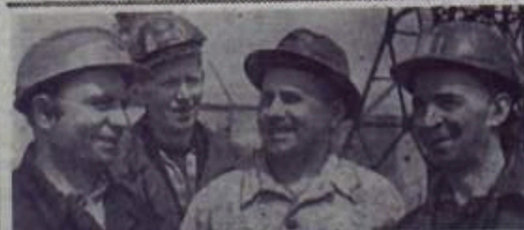
ТУЛЬСКАЯ ОБЛАСТЬ. В Подмосковском угольном бассейне строятся новые шахты. Одна из них — № 3-4 Западно-Шекнинская вступит в строй в этом году. Высокой выработкой на стрижилотегах шахты обогатили слесари-