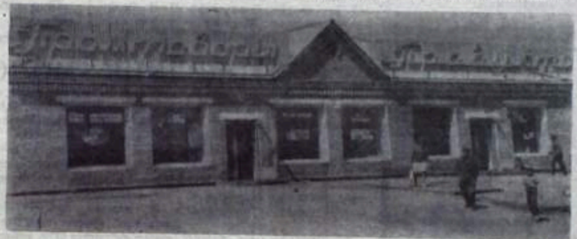
На центральной усадьбе Кумаргизинского совхоза вступил в строй новый магазин, построенный Кумартауским райпотребсоюзом. В нем два отдела: продовольственный и промтоварный.