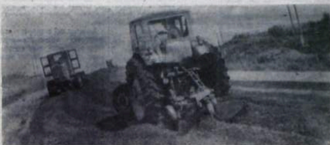
На строительстве дороги.