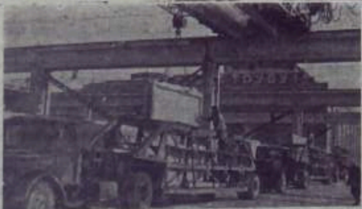
Жуковский демонстрационный комбинат — передовое предприятие строительной индустрии Московской области.

В избирательный округ № 46 входят населенные пункты Калтаево и Красный Мах.