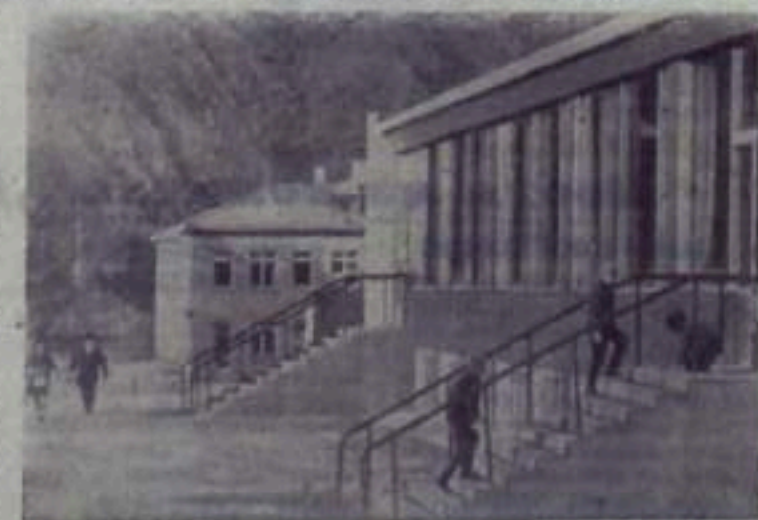
К электрификации всей страны, о которой мечтал Владимир Ильич Ленин.

В 60 километрах от села Шушенского, где три года прожил в парекой семье В. И. Ленин, развернулась грандиозная стройка — сооружается Сайно-Шушенская ГЭС. Она будет выдавать огромной. Высота плотины ГЭС — 240 метров. Мощность — более 6 миллионов киловатт. Новая гидроэлектростанция поможет сделать еще один широкий шаг