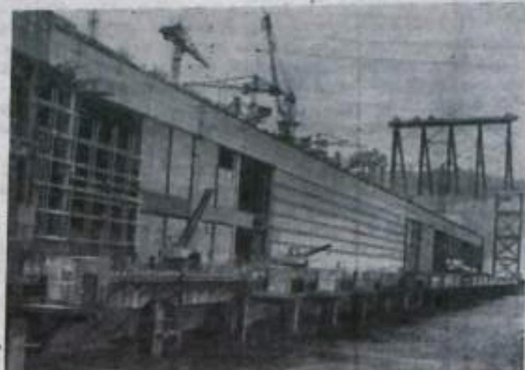
Красноярский край. Десять агрегатов Красноярской ГЭС начали вводить в эксплуатацию к 100-летию со дня рождения В. И. Ленина строители гиганта гидроэнергетики на Енисее. Шесть агрегатов уже дают энергию предприятиям и стройкам Сибири.