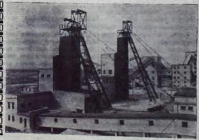
НА СНИМКЕ: новая шахта.

Начата добыча угля на новой шахте № 3 Восточной-Батуринской треста «Емашкиноуголь» Челябинской области. Шахта будет давать 500 тысяч тонн угля в год. Производственные процессы здесь механизированы и автоматизированы. Первые тонны угля выданы на-гора.