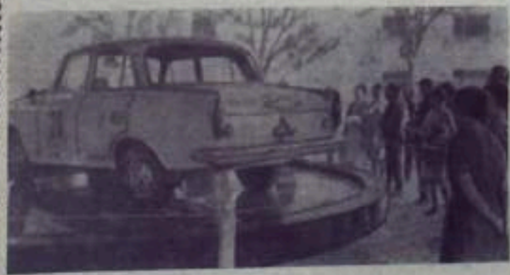
МОСКВА. Этот «Москвич-412», поставленный перед входом в павильон «Автомобильная промышленность» ВДНХ СССР — один из четырех «Москвичей», прошедших свыше 16 тысяч километров по дорогам Европы, Азии и Америки во время прошлых лет. В этом составлении приняли участие многие крупнейшие автомобильные фирмы мира. Из 98 экипажей, стартовавших в Лондоне, к финишу в Сиднее пришли лишь 36, в том числе все четыре советских экипажа на автомобилях «Москвич-412».

К. КАРТОШИН, инженер по рационализации СУ-2.