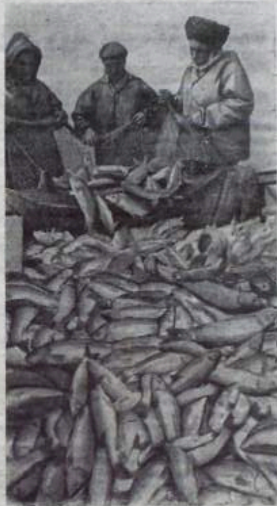
Хороших успехов добились рыбаки передового в Туркменинии колхоза «Верховный Совет». План улова они значительно перевыполнили.

«День рыбака установлен Указом Президиума Верховного Совета СССР от 3 мая 1968 года и отмечается ежегодно во второе воскресенье июля. На земном шаре ежегодно добывается свыше 60 миллионов тонн рыбы и морепродуктов, но долю Советского Союза приходится более 10 процентов добычи».