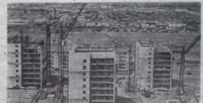
УЛАН-БАТОР. В столице Монгольской Народной Республики ведется большое жилищное строительство. Монгольским друзьям помогают московские специалисты. НА СНИМКЕ: сооружение зданий в 12-м жилом районе.