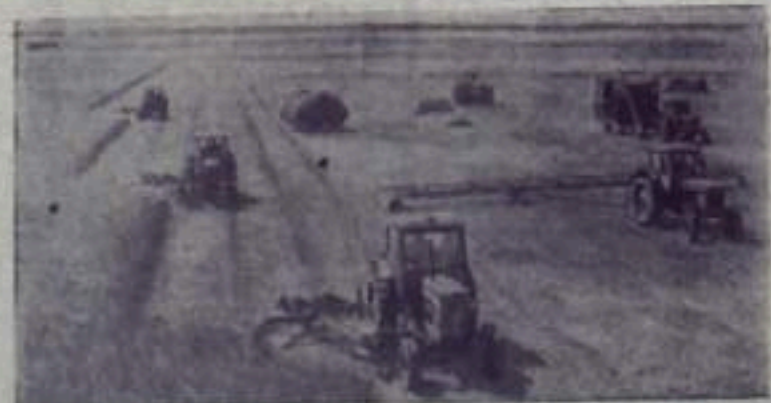
В Ульяновской области начался сенокос многолетних трав. Подборочному началу заготовку кормов труженики колхозов и совхозов области. За сезон они обязаны собрать 20 тысяч тонн сена и примерно 9 тысяч тонн травяной муки.