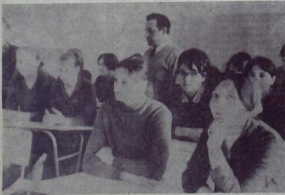
В новом учебном корпусе учащиеся городского профессионально-технического училища № 51 получили светлые про-

сторные классы. Скоро будут введены в строй хорошо оборудованные мастерские.