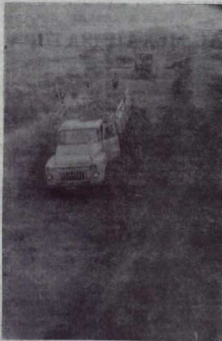
На снимках: сверху — подвоз, разгрузка машин и борка, измельчение и погрузка зеленой массы; внизу — разгрузка машин и трамбовка сенажа.