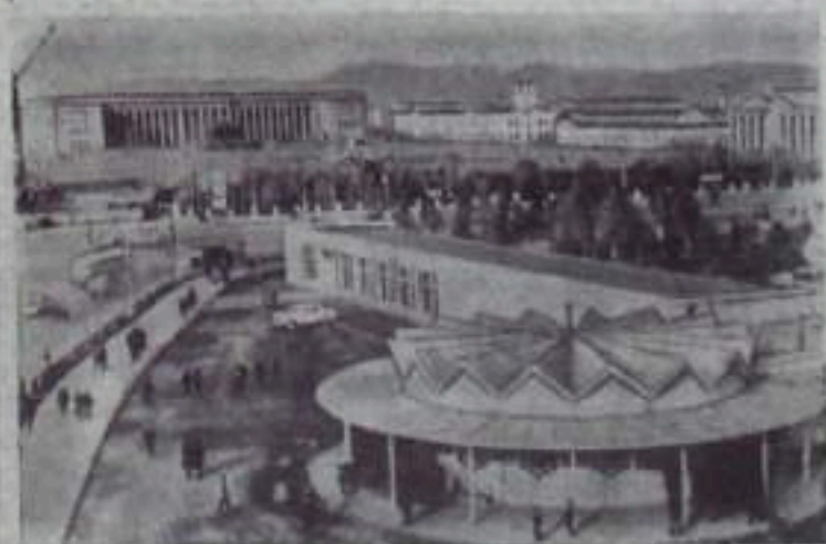
МНР. Вид на центральную площадь столицы республики — Улан-Батор.

Центром торжества 11 июля стала площадь Сузд-Батора, где возмывается памятник выдающемуся революционеру. Здесь состоялся военный парад и праздничная демонстрация трудящихся.