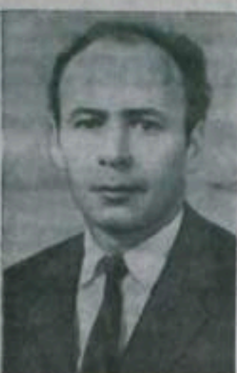
В. Н. Пацаев.