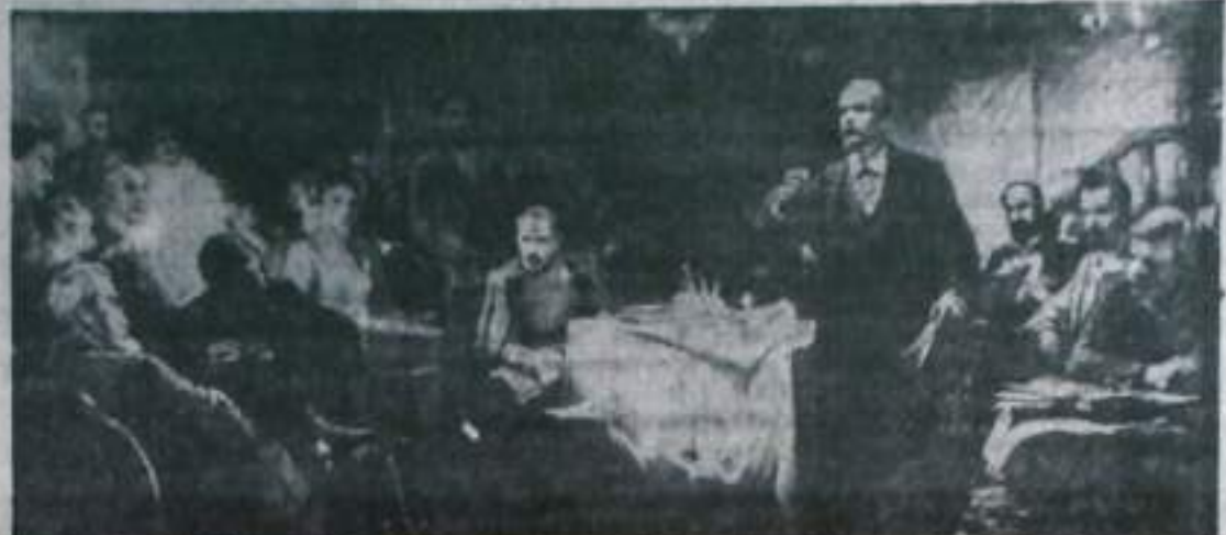
«В. И. Ленин выступает на II съезде РСДРП». С картины Ю. Виноградова.

Второй съезд РСДРП проходил с 17 (30) июля по 10 (23) августа 1903 года в Брюсселе. Главная задача