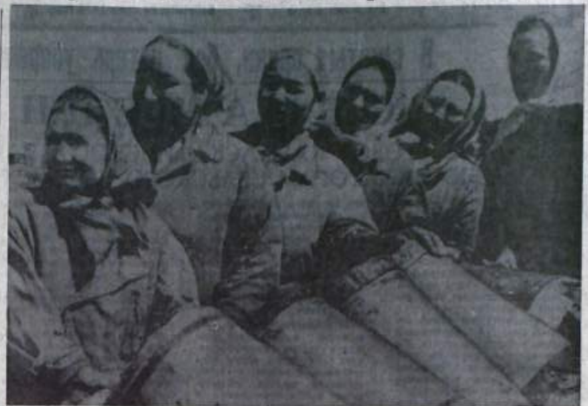
У инициаторов соревнования