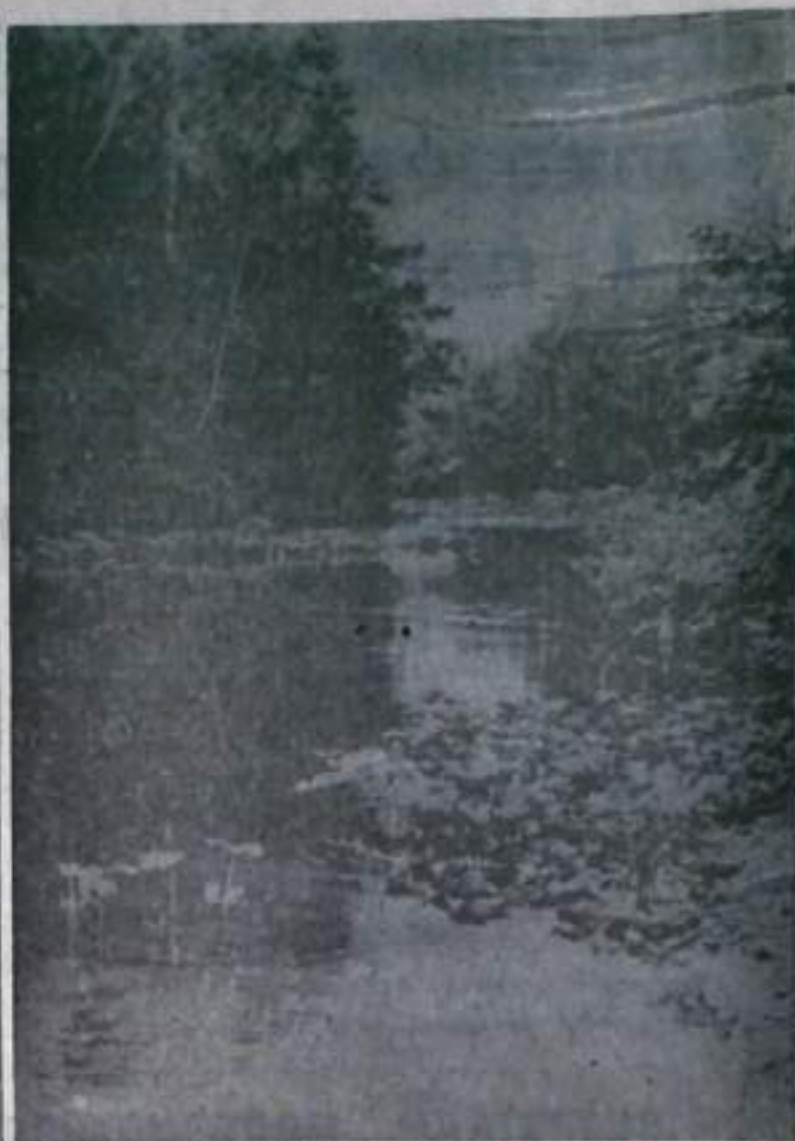
На реке Большой Ик.