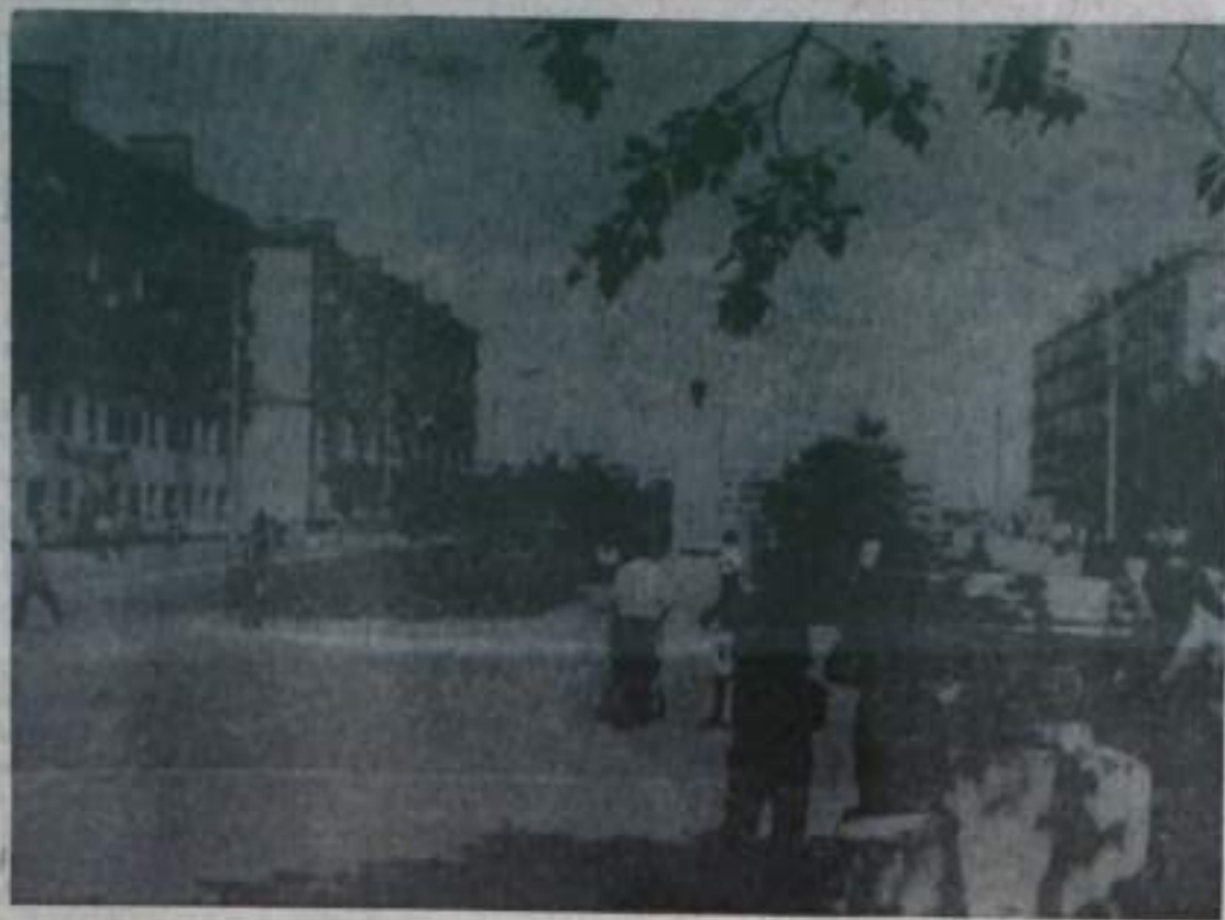
КУМЕРТАУ, У СКВЕРА КОМСОМОЛЬСКОЙ СЛАВЫ.