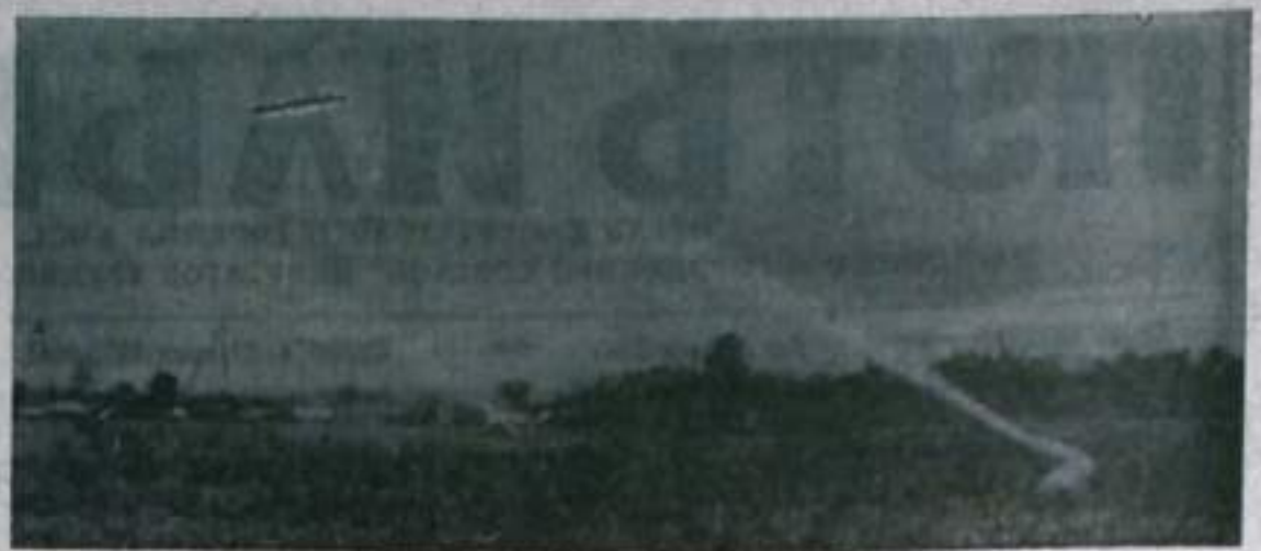
Продуктивность скота возрастет

Т. АККУРАТОВА, Ю. БАРАНОВ, спец. корр. ТАСС.