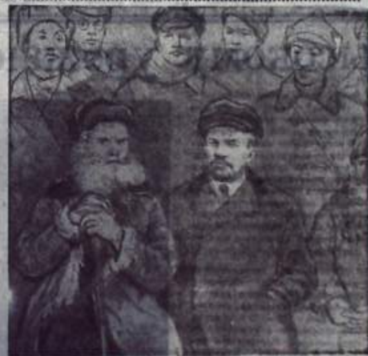
Более двух тысяч рисунков насчитывает Ленинград народный художник СССР Николай Жуков. В течение многих лет он работает над образом вождя и основателя Коммунистической партии Советского Союза.

В Центральном музее В. И. Ленина открылась выставка работ художника, посвященная 70-летию II съезда РСДРП. НА СНИМКЕ: рисунок «Неопубликованный снимок». Автор Н. Жуков. 1971 год.