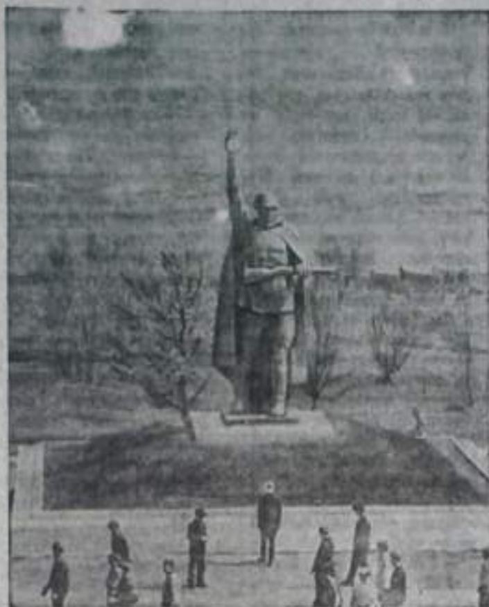
Монумент воин-победителей, установленный в Свободинском мемориале-музее Курской битвы.