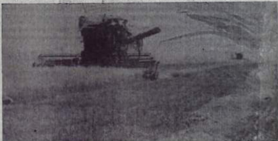
На снимке: комбайн овец в колхозе имени Калинина.

Исполнилось 70 лет со дня открытия II съезда РСДРП