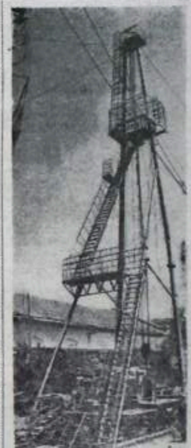
БАКУ. Машинистометелу завода имени лейтенанта Шмидта изготовили выкатный образец буровой станки для структурно-поискового бурения с новой системой пневматического управления. Буровая установка имеет А-образную вышку высотой 28 метров, состоящую из цельной секции труб. Вся установка смонтирована на передвижной площадке, которая в зависимости от времени года устанавливается на железнодорожные или колеса.

В. КИРИЧЕНКО, зам. главного инженера ПТУ.