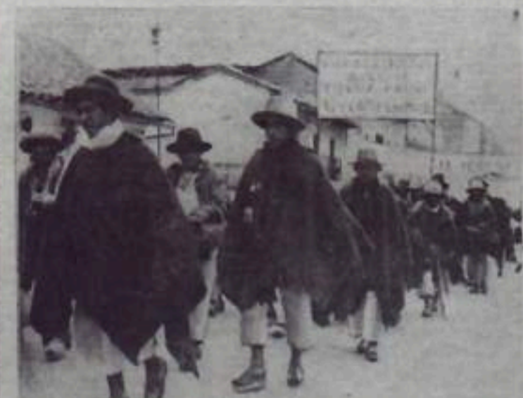
Крестьяне Эквадора требуют аграрной реформы. В настоящее время 1 процент землевладельцев владеет 40 процентами всей земли. До сих пор сохранялись пережитки феодализма — полукрепостное состояние крестьян, прикрепленных к помещичьему хозяйству, кабальная система издольной аренды.

В мае в столице Эквадора — городе Кито состоялся демонстрация крестьян. Они несли плакаты «Да здравствует аграрная реформа!», «Землю крестьянам!».