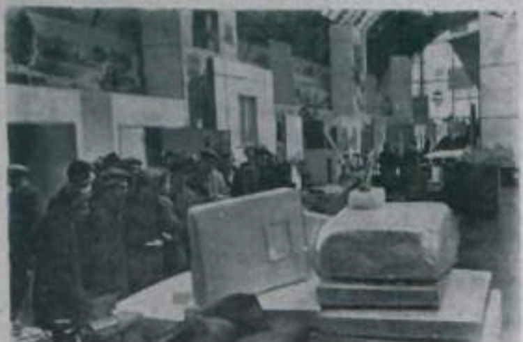
МОСКВА. Большая олимпиада поднимается на ВДНХ выставка на городском строительстве, на которой представлены много новых — новые материалы, строительные материалы и демонстрируются новые методы строительства.

На снимке: посетители обматривают панели на минеральной вате и стекловолокне.