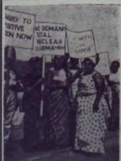
Гама. Участники демонстрации протеста против атомного вооружения и за свободу и независимость народов Африки, состоявшейся в столице страны Аккре, требуют в своих лозунгах полного ядерного разоружения.

Депутаты «Клуба независимости» и группировка «Досидэй» решительно отказались от участия в обсуждении японско-американского военного союза на всех пленарных заседаниях японского парламента.