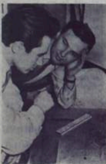
УКРАИНСКАЯ ССР. Коллектив специальной конструкторской бюро гидротурбин Харьковской турбинного завода имени С. М. Кирова создает новые высокопроизводительные машины для новостроек семилетки. Разрабатывается технический проект уникальной по мощности и размерам радиально-осевой гидротурбины для Красноярской ГЭС. Мощность агрегата 508 тысяч киловатт, диаметр рабочего колеса семь с половиной метров. Над проектом наряду с опытными конструкторами трудятся молодые инженеры.

*В семилетке комсомол взял шефство над сооружением 100 мощных предприятий металлургической, горнодобывающей, химической, энергетической и других важнейших отраслей промышленности.