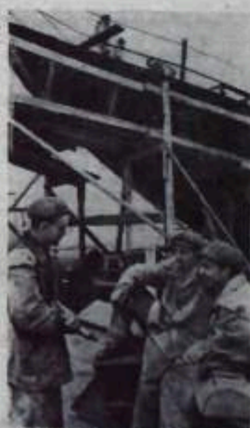
НИКОЛАЕВ. На стенах завода имени В. И. Ленина студенты Никольского кораблестроительского института сооружают большую парусно-моторную лодку (объемом 30 тонн). Они сами спроектировали лодку в своем конструкторском бюро. По слеме, составленной студентами, электрические механизмы будут выбирать якоря и подтягивать лодку при швартовке.