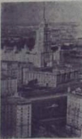
Москва сегодня. Вид на высотное здание Гостиницы «Украина» и новые жилые дома.