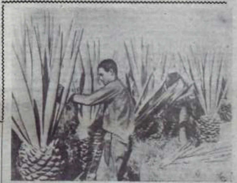
Республика Куба. Члены кооператива «Рене Аркай» (провинция Пинар-дель-Рио) за сбором хевеника — жлоколистного растения, из которого изготавливаются кланты.

закончилась английская оккупация Египта, длившаяся 74 года. По случаю праздника во всех крупных городах страны состоялись парады воинских подразделений и массовые спортивные мероприятия.