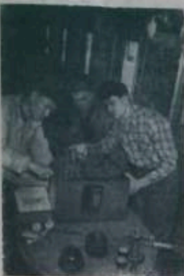
Сталинская область. Работники управления машиностроения и центрального бюро технической информации Сталинского совнархоза создали передвижной Дом техники. Он размещен в железнодорожном вагоне. В нем оборудованы салон-выставка, куле-костудия, радиостанция. Первый выезд вагона на заводы экономического района посвящен внедрению прогрессивных методов сварки.

В этом рассуждении большая доля истины. Руководителям треста необходимо прислушаться. На базе технаба уже третий год «маринуется» асфальтосмесительная установка Д-253 производительностью 8—10 тонн в час. Она при ритмичной работе в состоянии вполне обеспечить город асфальтом. На установку ее не требуется больших затрат и длительного времени. Сейчас в первую очередь следует пустить в действие старую установку, мобилизовав на ее ремонт квалифицированных специалистов и все возможности. Лето не ждет. Дороги должны быть отремонти-