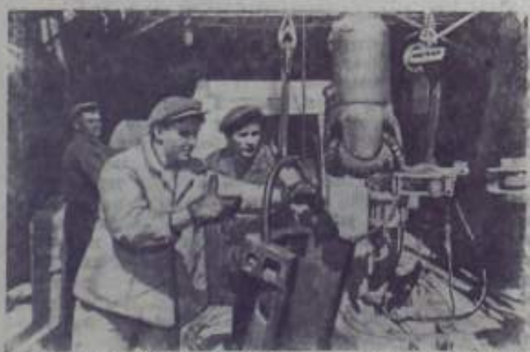
КРАСНОДАРСКИЙ КРАЙ. Вместе со всей страной нефтяники Кубани разрабатывают социалистическое соревнование в честь XXII съезда КПСС.

Поручено также определить минимум оборудования и учеб-