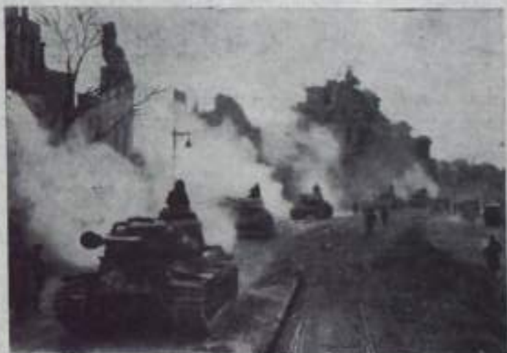
В Берлине. Советские танки проходят мимо Бранденбургских ворот.

вождем — Коммунистической партией, сумели не только остановить врага, но и нанести ему сокрушительное поражение. В грандиозных битвах с фашистскими захватчиками Советская Армия и Флот одержали всемирно-историческую победу, похоронив свои боевые знамена невиданной славы.