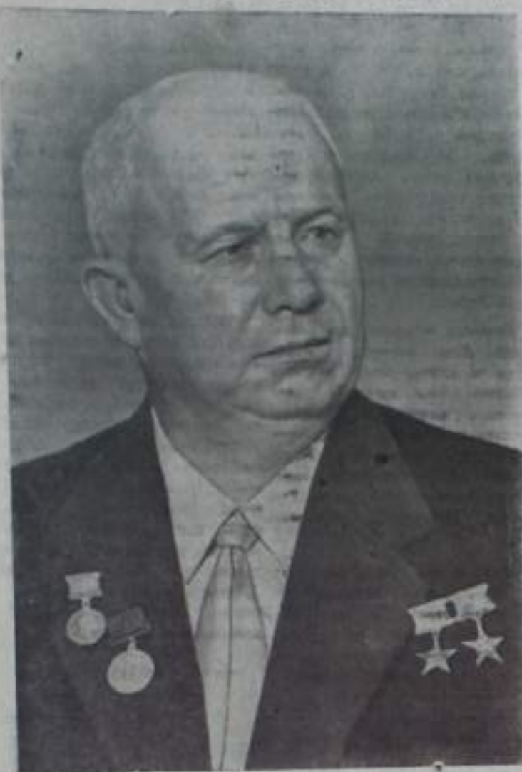
Н. С. Хрущев.