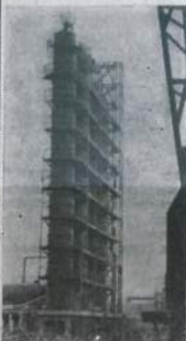
ЯРОСЛАВЛЬ. Полным ходом идет сооружение Ново-Ярославского нефтеперерабатывающего завода. Коллектив строителей обещает приступить к началу 17 октября—в день открытия XXII съезда КПСС.