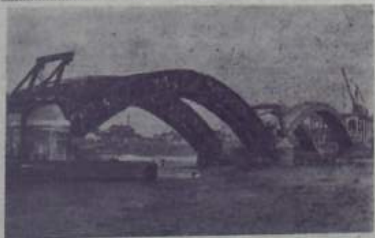
Ярославская область. Строительство автомобильного моста через Волгу в городе Рыбинске.