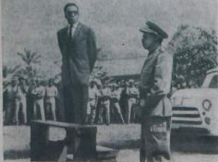
Конго, в Стокгольме состоялась церемония закладки памятника Патрику Лумумбе.