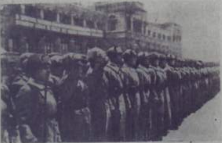
22 июня 1961 г. — 20 лет со дня нападения фашистской Германии на Советский Союз. Начало Великой Отечественной войны Советского Союза против фашистской Германии.