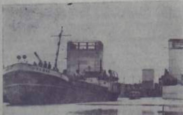
Вологодская область. Через Вытегорский и Белозерский гидроузлы Белого-Бастийского водного пути началось регулярное движение судов. От пристани Вытегра до Череповца совершают рейсы пассажирские и грузовые пароходы.

Шлюзы и образовались водохранилища прокладывает прямой путь на Вытегину и Волге. Десятки старых шлюзов Мариинской системы остались под водой. На снимке суда выходят из Вытегорского шлюза.