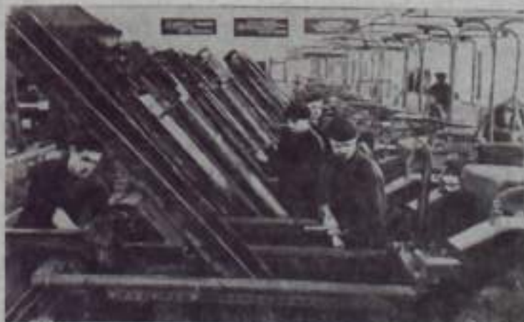
Полтавская область. Соревнуясь за достойную встречу XXII съезда КПСС, коллектив лубенского завода «Комсомолец» досрочно выполнил пятимесячную программу по производству машин и механизмов для хлебоприемных пунктов.

Уже отправлено 120 самоходных зернообрабатывающих машин, каждый производительностью в 100 тонн зерна в час.