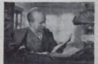
В НАЧАЛЕ ВЕКА