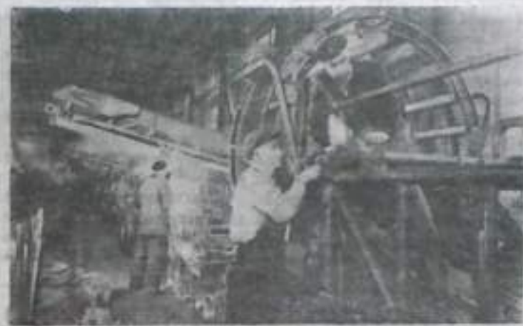
МОСКОВСКАЯ ОБЛАСТЬ. К выпуску новых картофелеуборочных комбайнов «КПН-2» приступил Коломенский теплический строительный завод имени В. И. Куйбышева. В отличие от прежнего комбайна «КНР-2» новая машина более производительна и при уборке дает меньше потерь картофеля.

К началу уборочной кампании завод изготовит тысячу таких машин.