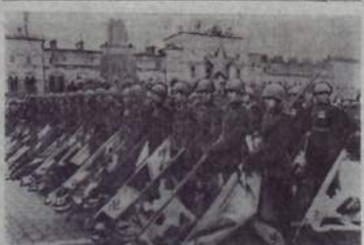
Парад Победы на Красной площади в Москве 24 июня 1945 г. На снимке: советские воины с захваченными у немецких войск знаменами.