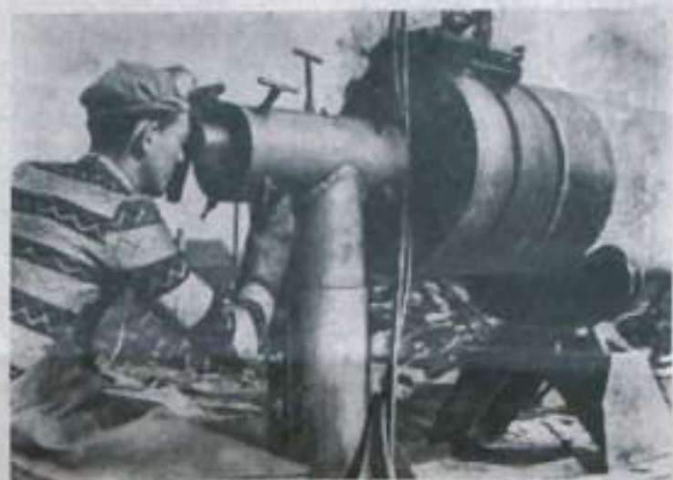
ЧЕХОСЛОВАЦКАЯ СОЦИАЛИСТИЧЕСКАЯ РЕСПУБЛИКА. Строители чехословацкой ветки нефтепровода Дружба по проекту советских товарищей, работающих на сооружении нефтепровода, включились в соревнования за ускорение темпов строительства. Они обещали проложить в этом году на территории Чехословакии 238 километров труб. На снимке: Давид Арпад готовит трубы для отправки на трассу.