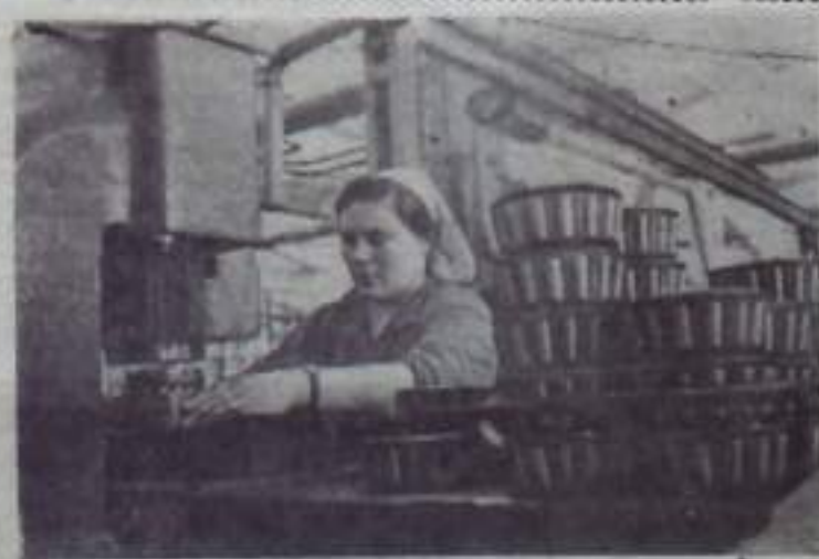
СТАЛИНГРАДСКАЯ ОБЛАСТЬ. Новый Волжский подшипниковый завод в конце мая отпраздновал свою первую продукцию Сталинградскому тракторному заводу, а также предприятиям Ростова-на-Дону и Ленинграда.