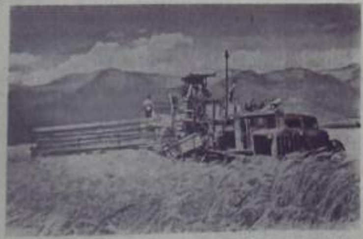
Грузинская ССР. В республике началась уборка ячменя. Механизаторы колхоза имени Державинского Загодежского района приступили к уборке ячменя.