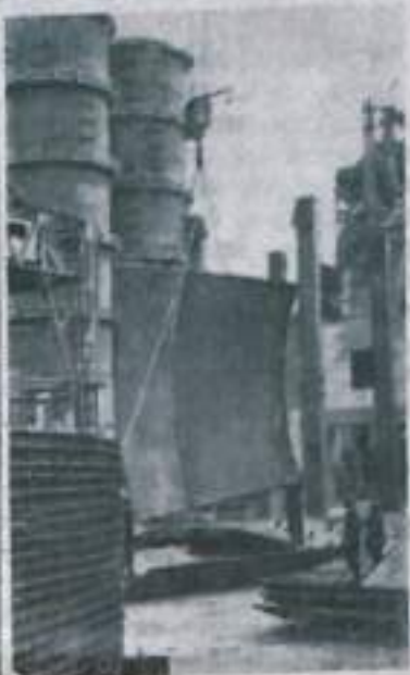
Липаши. На Новолипецком металлургическом заводе строится мощная домна. Это — ударная комсомольская стройка. С каждым днем здесь ширится фронт работ.

На 40-метровую высоту ползали первый и второй воздухоподогреватели, идет монтаж металлических конструкций литейного двора. Сооружаются другие объекты.