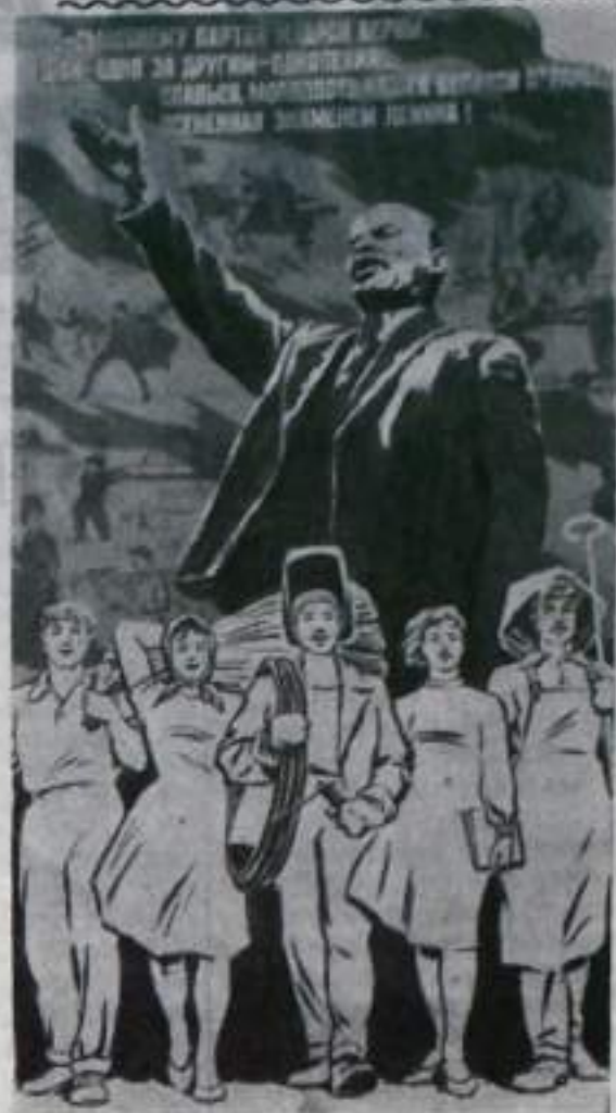
Плакат художника В. Нарышкина. Стихи А. Филатова. Фотохроника ТАСС.

Припев: Запомни, верный друг, У дружбы нет разлук, У дружбы сто дорог И попутный ветерок.