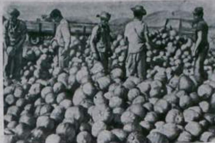
Республика Куба. Остров Пинос богат разнообразными фруктами, являющимися одной из основных статей кубинского экспорта. Здесь приносят хороший урожай бахчевые культуры.